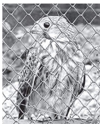
Зачем меня унесли из леса?