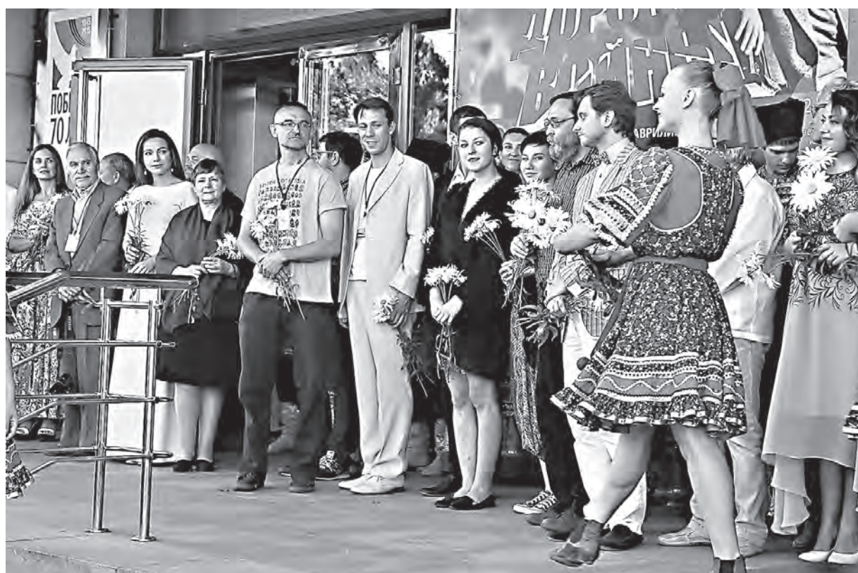
Зрителей приветствуют гости и участники фестиваля.