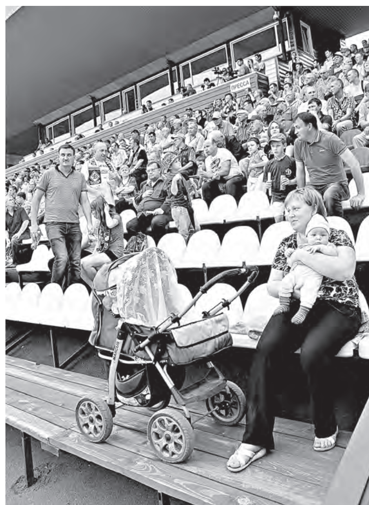
На трибунах даже грудные дети.

30 июля – «Динамо» (Барнаул) – «Сибирь-2» (Новосибирск) 2 августа – «Динамо» (Барнаул) – ФК «Чита» 10 августа – «Иртыш» (Омск) – «Динамо» (Барнаул) 13 августа – «Томь-2» – «Динамо» (Барнаул) 23 августа – ФК «Новокузнецк» – «Динамо» (Барнаул) 30 августа – «Динамо» (Барнаул) – «Смена» (Комсомольск-на-Амуре) 2 сентября – «Динамо» (Барнаул) – «Сахалин» (Южно-Сахалинск)