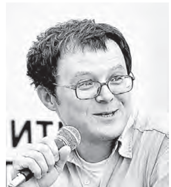
Поэт Глеб Шульпяков.

23 июля в Барнауле на площади перед библиотекой им. Шишкова состоялась литературная перекресток «Шукшин и вся Россия».