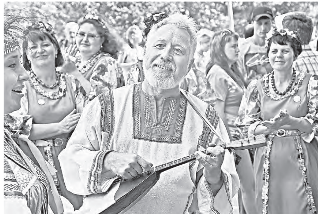
Литературный перекресток был музыкальным.

Даже беседа о Шукшине требует особого масштаба, простора. Раздвинув свои стены, краевая библиотека устроила огромный читальный зал в зеленом сквере.