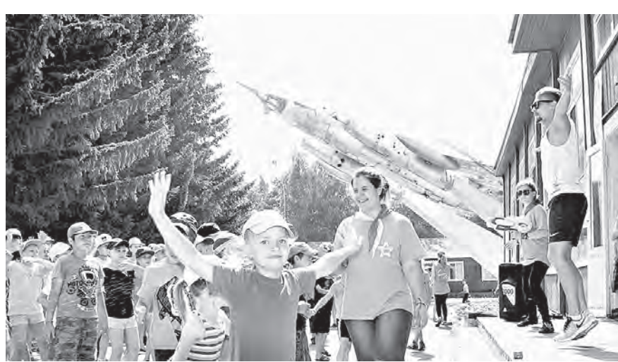
В разгаре – танцевальный марафон.

Обычно дети, побывавшие здесь однажды, приезают снова за новыми впечатлениями, эмоциями. Мальчишки и девочки находят новых друзей, а также открывают новые таланты.