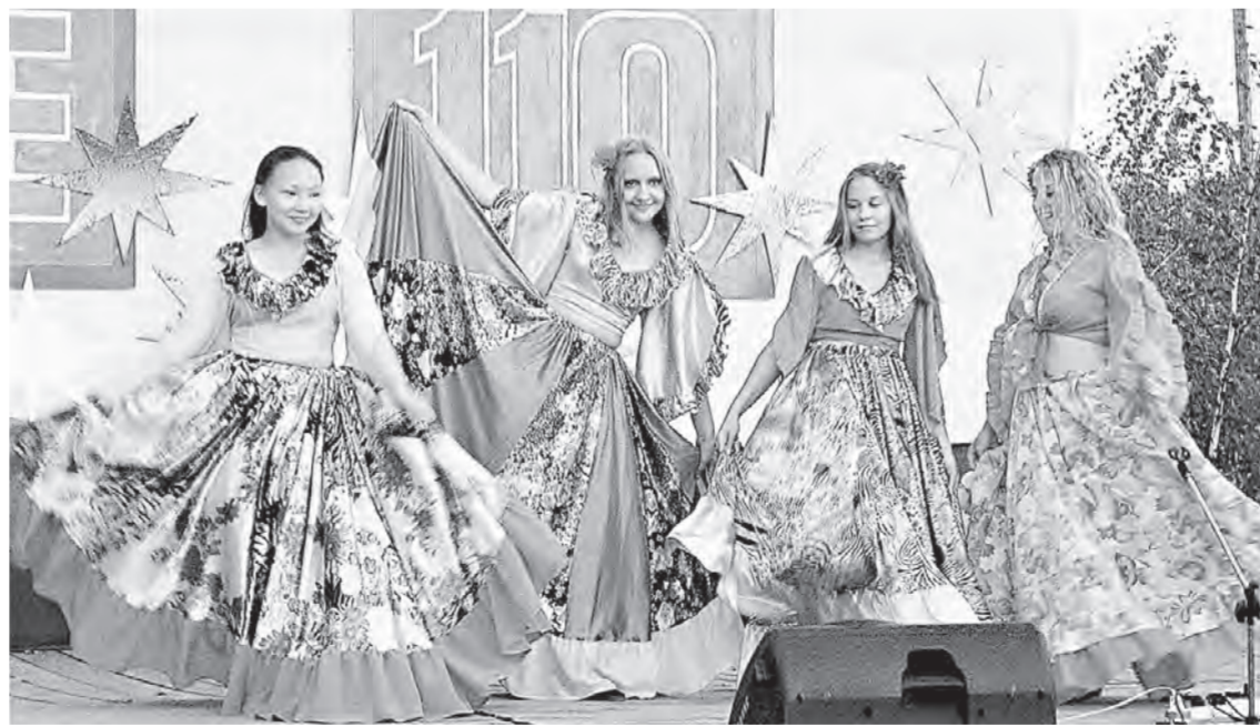
Во время вечернего праздничного концерта.