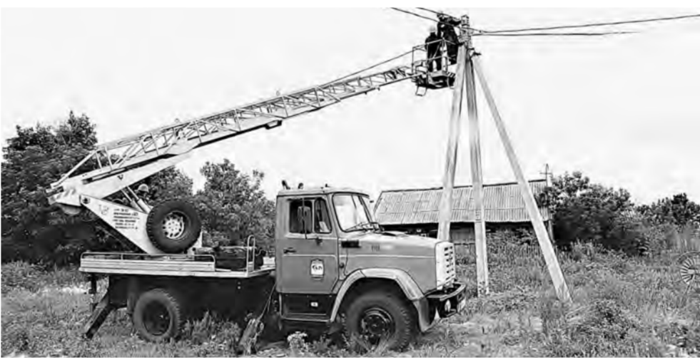
Высоко сидим, далеко глядим.

Другой пример неудавшейся экономии – в Кытмановском районе. Дополнительная проводка обнаружилась у селянина в пос. Октябрьском во время плановой проверки. От самодельной линии работала всего лишь электрическая сушилка. Но все равно гражданину придется заплатить 142 тыс. руб. за 57 тыс. неучтенных киловатт.