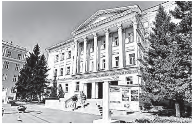
Министр обещал помочь Алтайской академии культуры и искусств.

Краевую столицу Владимир Мединский с семьей посетил в понедельник, 20 июля. Официально он в отпуске, но, что называется, не смог проехать мимо. Пользуясь случаем, посетил Молодежный театр Алтая им. В.С. Золотухина, Алтайскую государственную академию культуры и искусств, строительную площадку Государственного Художественного музея Алтайского края, осмотрел памятник «Его Величеству Крестьянину», краевой театр драмы имени Василия Шукшина и концертный зал «Сибирь».