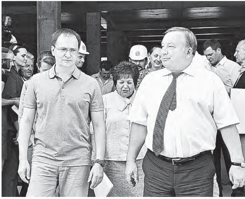
Владимир Мединский и Александр Карлин отметили важность реконструкции Государственного Художественного музея.

Министр культуры отметил, что фойе зала нуждается в ремонте. «Рекомендую вам незамедлительно начать ремонтные работы, поддержку от федерального центра вы получите», — сказал министр. В Молодежном театре Алтай он побывал в общежитии для молодых актеров. Александр Карлин рассказал министру об опыте проведения в регионе Всероссийского молодежного театрального фестиваля имени Валерия Золотухина, который собрал 450 участников и шесть тысяч зрителей. «Все 12 спектаклей фестиваля прошли с аншлагом», — подчеркнул Александр Карлин. Владимир Мединский особо отметил значимость реконструкции Государственного Художественного музея Алтайского края. «Этот объект имеет большую перспективу», — сказал министр. Александр Карлин отметил, что Художественный музей станет самым крупным в Сибири. Со всеми выста-