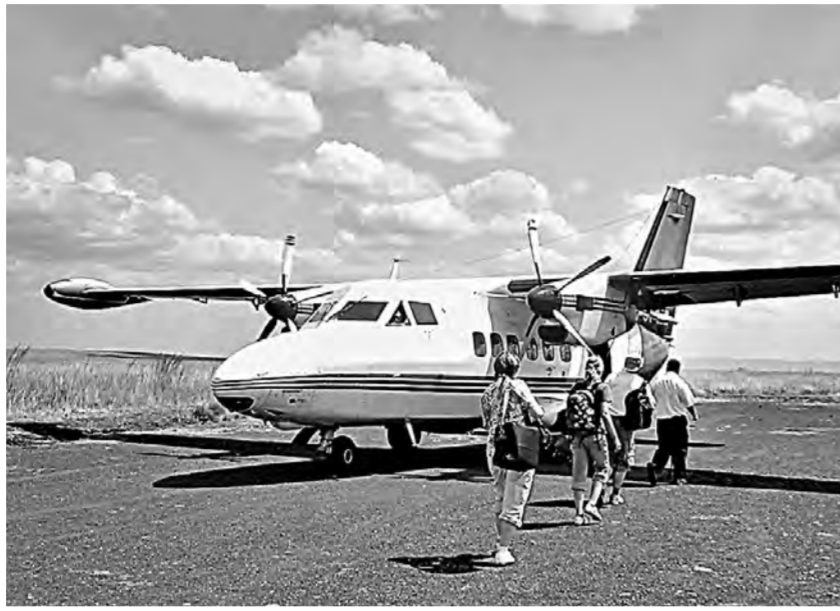
К малой авиации проявляют интерес и негосударственные структуры.

Комментируя ситуацию с распространением опасных вредителей леса, губернатор заявил, что она находится в его личном контроле. Площадь лесов в Алтайском крае, зараженных насекомыми-вредителями, достигла 400 тыс. гектаров.