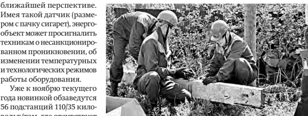
Полежала, опора. Пора постоять на службе людям.

приятие прошло в Алейске. Соревнования между бригадами электромонтеров состояли из шести этапов.