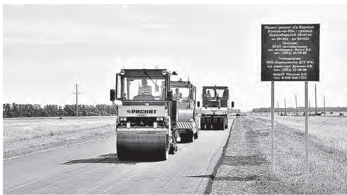
Вот так бы на каждой дороге...

Причем можно это не только понять, но и почувствовать. Два участка асфальтированной трассы на пути к Павловску закрыты, и двигаться приходится по обездвиженной, впрочем, достаточно качественно сделанной дороге. Неудобно, конечно. Трясет, пыль, но дело такое, что стоит и потерпеть. Как обещают дорожники, к октябрю нынешнего года 25 километров автодороги Барнаул — Камень-на-Оби — граница Новосибирской области будут обновлены. На двух участках региональной трассы работы ведутся одновременно — реконструкция 10 километров осуществляется за счет федерального финансирования и ремонт 15 км на средства регионального дорожного фонда. — Согласно поручению президента Российской Федерации, в период с 2013 по 2023 год субъекты должны удвоить объемы строительства и реконструкции автомобильных дорог по сравнению с предыдущим десятилетием. В Алтайском крае за это время необходимо ввести в эксплуатацию более 500 километров дорог, то есть по 55 км в год. На эти цели из федерального бюджета нам ежегодно будет предоставляться субсидия. В 2015 году она составила 1,1 млрд рублей, — объясняет масштаб разворачившихся в крае дорожных работ заместитель началь-