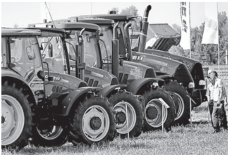
Как не растеряться при таном обилии техники!

– Наше государство в режиме санкций и контрсанкций не только и не столько применяет меры административные, сколько меры экономического стимулирования отрасли сельхозмашиностроения, – сказал губернатор. – Обратите внимание, как гибко работает федеральный центр! Мы тоже стараемся в этом русле следовать, и задача стоит так: чтобы наши сельхозмашиностроители вошли на рынок в режиме санкций-контрсанкций и остались там навсегда по ключевому основанию. Это конкурентоспособность, выражающаяся в оптимальном соотношении цены и качества.