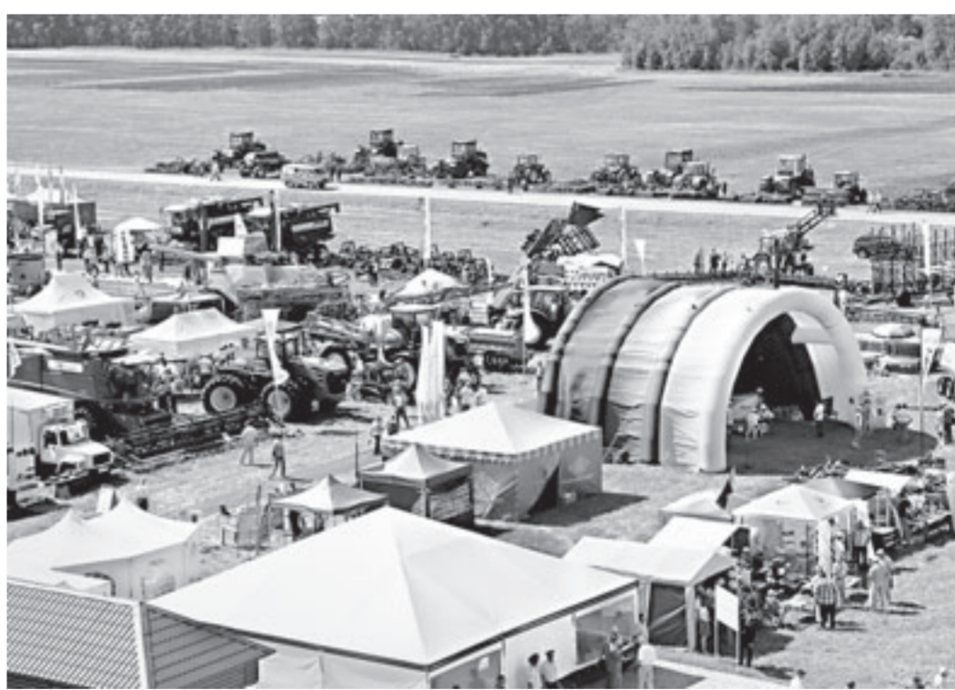
Малый фрагмент выставки с высоты птичьего полёта.

посещают ежегодно. Думаю, что в этом году посетителей будет еще больше. Мы даже не ожидали, что есть такой спрос на нашу технику. Сегодня у нас столько машин различных модификаций, что даже может не хватить денег в текущем году, чтобы выделить средства всем покупателям. Поэтому ежегодно будем увеличивать ассигнования на эти цели.