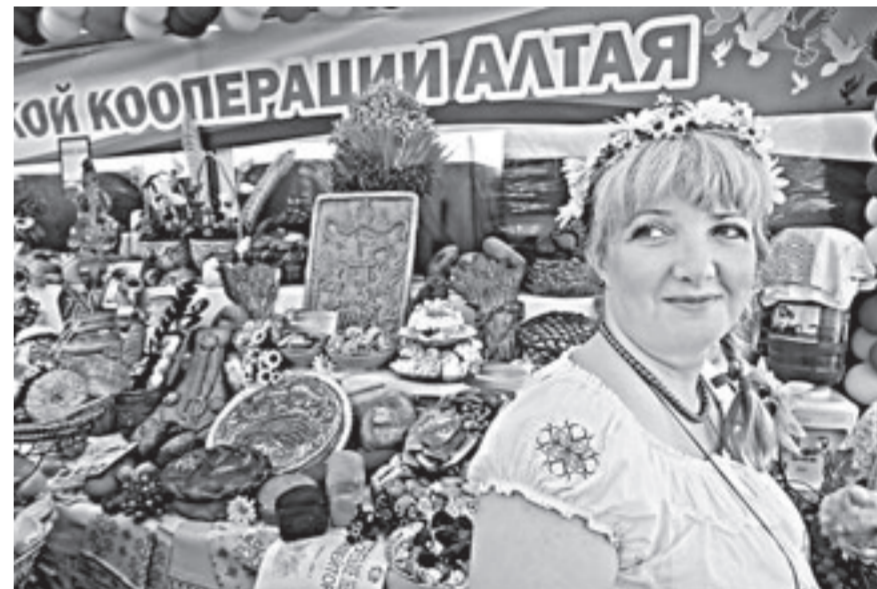
«Праздник Хлеба» в этом году удался.

посещают ежегодно. Думаю, что в этом году посетителей будет еще больше. Мы даже не ожидали, что есть такой спрос на нашу технику. Сегодня у нас столько машин различных модификаций, что даже может не хватить денег в текущем году, чтобы выделить средства всем покупателям. Поэтому ежегодно будем увеличивать ассигнования на эти цели.