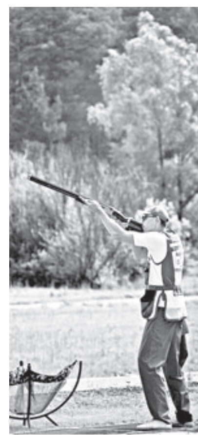
Тарелка – вдребезги.

Евгений ЛИМАНСКИЙ