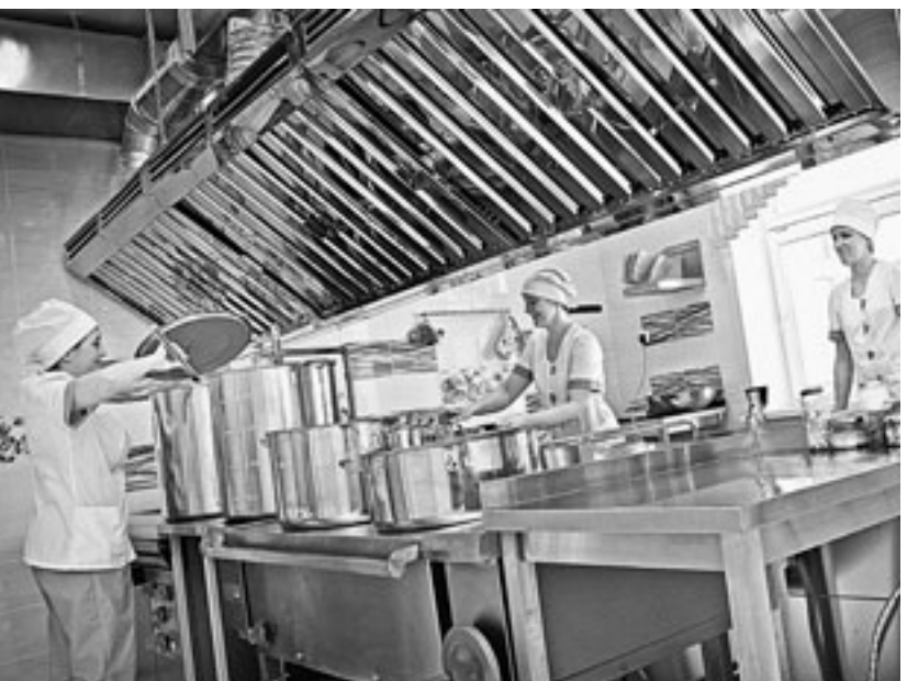
Накормят даже вечно голодных студентов.

По поручению премьер-министра РФ Дмитрия Медведева система социального обеспечения в стране переходит от всеобщей поддержки к адресной. Помощь будет оказываться