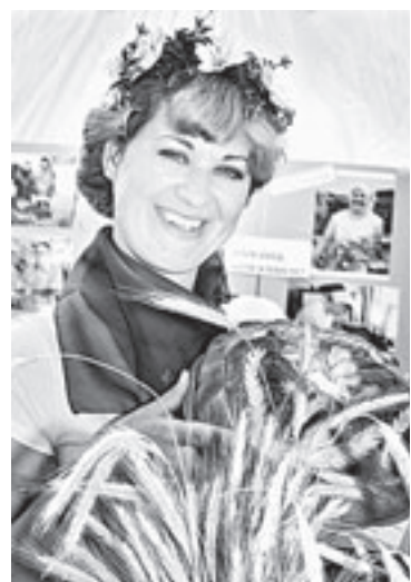
Алтай – хлебный край.

Также свою известную на весь Алтайский край продукцию