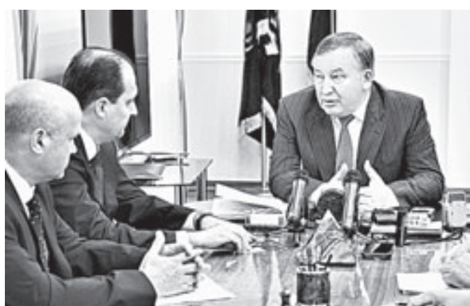
Разговор был конструктивным.

– Инновационные программы, реализуемые промышленными предприятиями, поддерживаются средствами краевого бюджета, – отметил губернатор. – Кроме того, мы работаем на расширение номенклатуры гражданской продукции, прекрасно понимая, что стабильная экономика предприятий позволяет достойно закрывать тему оборонного заказа. Я имею в виду тот же Алтайский шинный комбинат. Сегодня