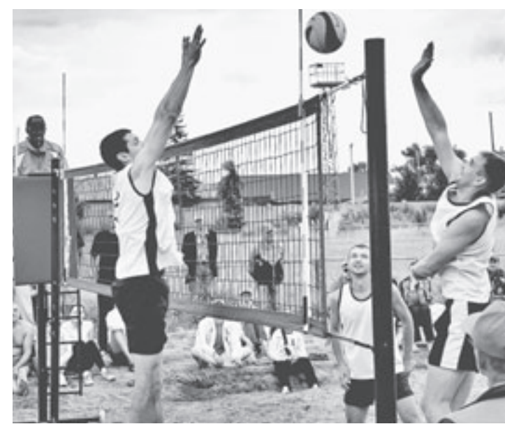
Пляжный волейбол всегда популярен.