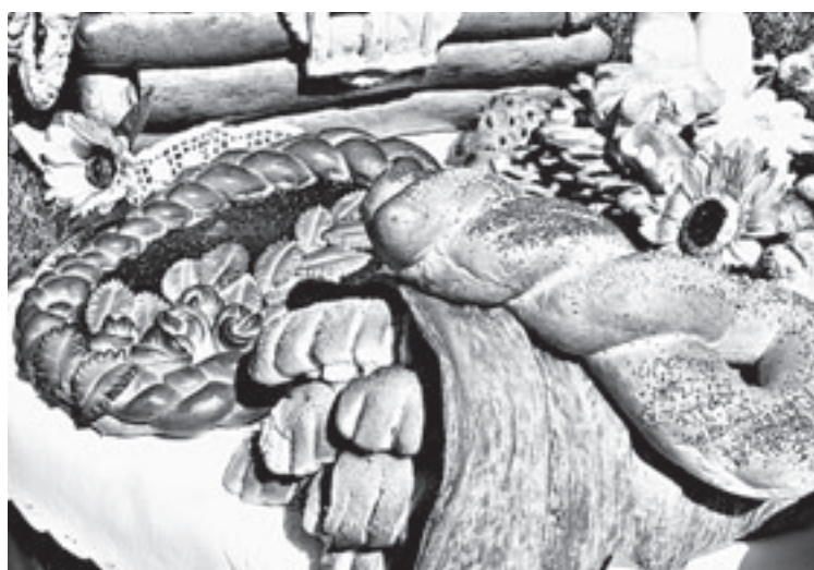
Посетители выставки будут приятно удивлены.

Можно будет приобрести и продегустировать самые вкус-