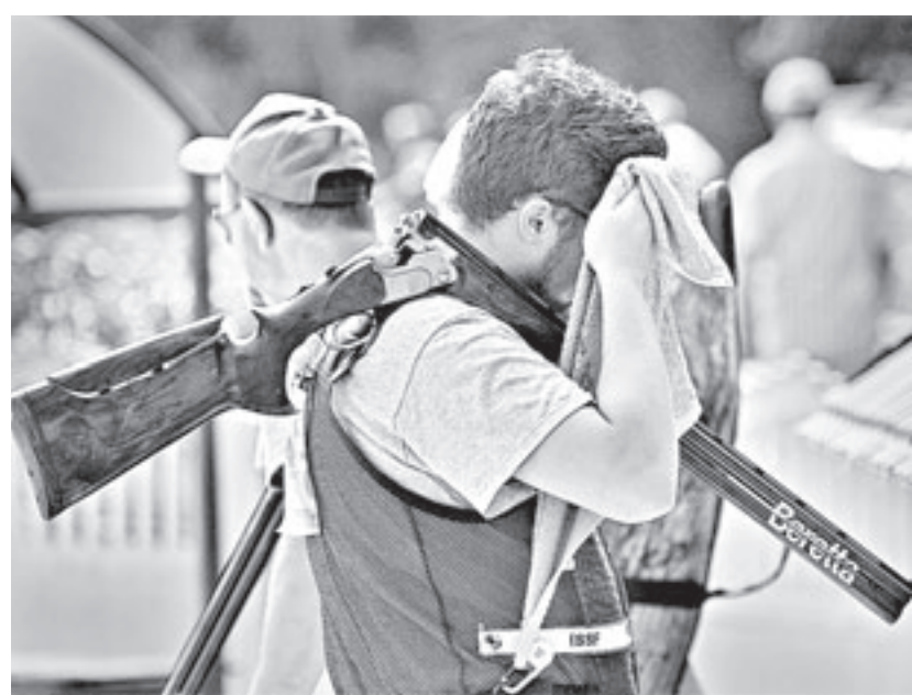
Ух и жарно!