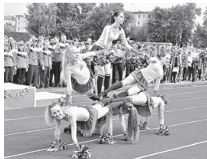
Веселые девчонки – короткие юбчонки.

В мужском волейболе бийчане и рубцовчане также сошлись в очном споре – в борьбе за бронзовые медали. Принципиальный матч затянулся до пятой партии, в которой хозяева сломали-таки сопротивление волейболистов