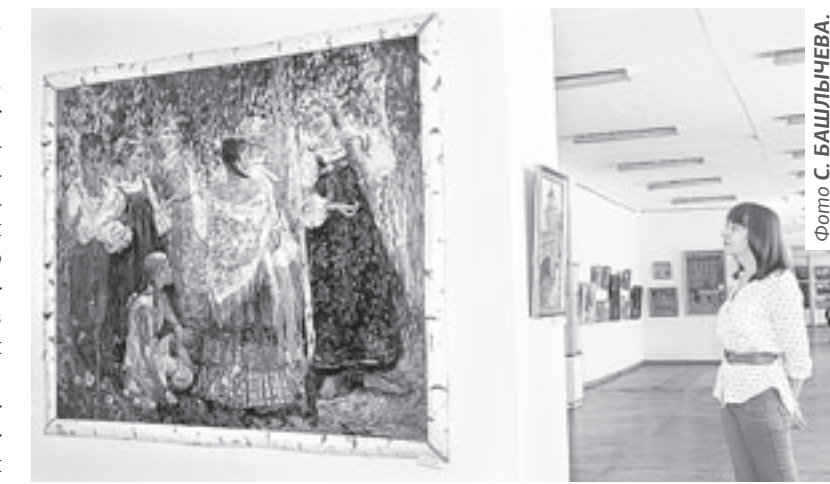
Выставочный зал Союза художников.

Выставка «Плакаты войны. На пути к Великой Победе» (0+).