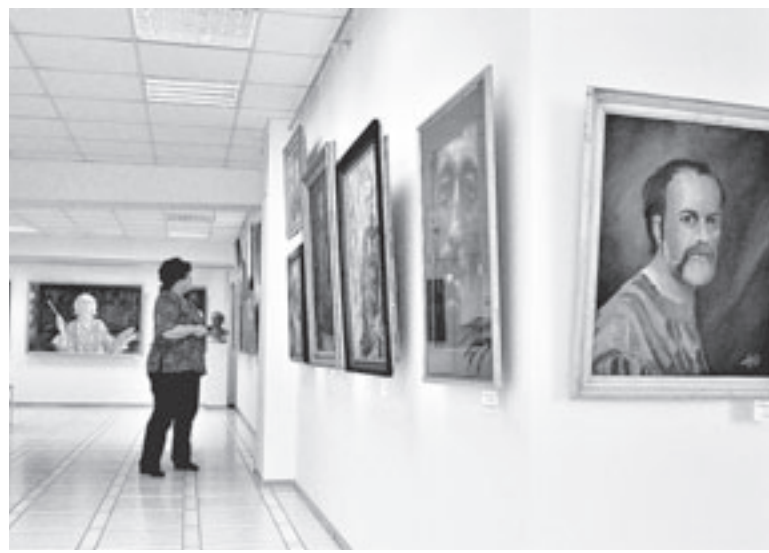
Галерея «Нармин» – 10 лет.

К Году литературы в России: фотовыставка В. Савченко «Алтайские писатели. Фотосинтез творческой личности» (0+).