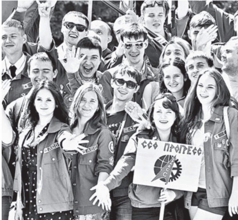
Ребята готовы променять летние каникулы на трудовые будни.

В четверг отряды собрались у кинотеатра «Мир», колонной прошли до площади Советов, где и состоялось торжественное открытие трудового семестра. На церемонии пришли представители краевой и городской администраций, органов местного самоуправления и ветераны мощного молодёжного движения. Всех приветствовал заместитель губернатора края, начальник