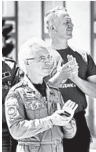
Ветераны СО напутствовали студентов.

Бойцы студенческих отрядов Алтайского края открыли летний трудовой семестр.