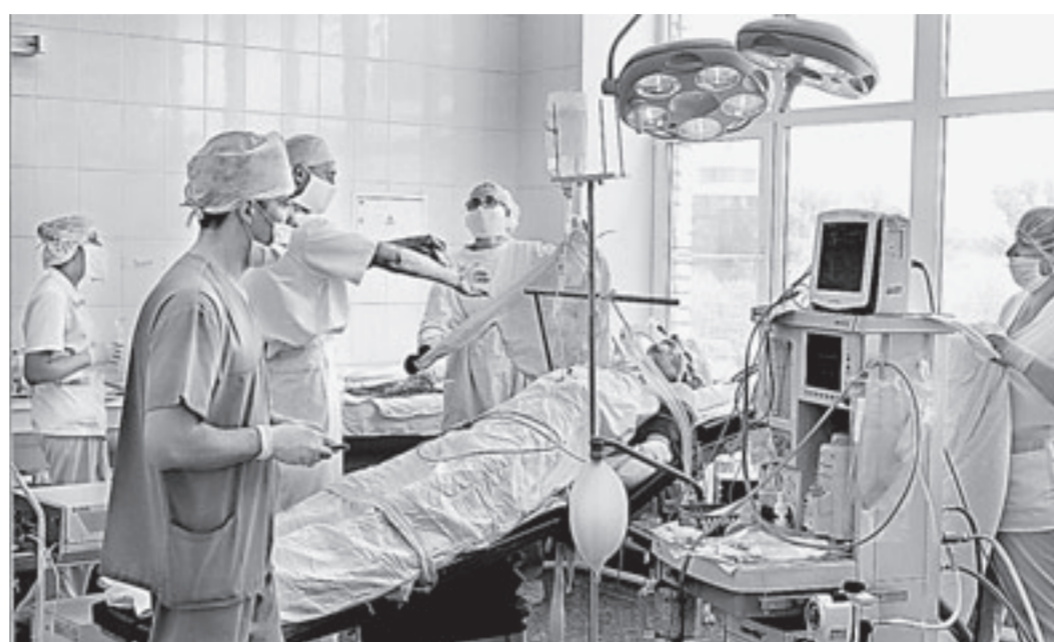
Будни травматологов-ортопедов отделения тяжелой сочетанной травмы.

– В 70-е у травматологов был популярный метод внутривенно-остеосинтеза кости. Но его отринули в пользу новинки – аппарата Илизарова. Им стали