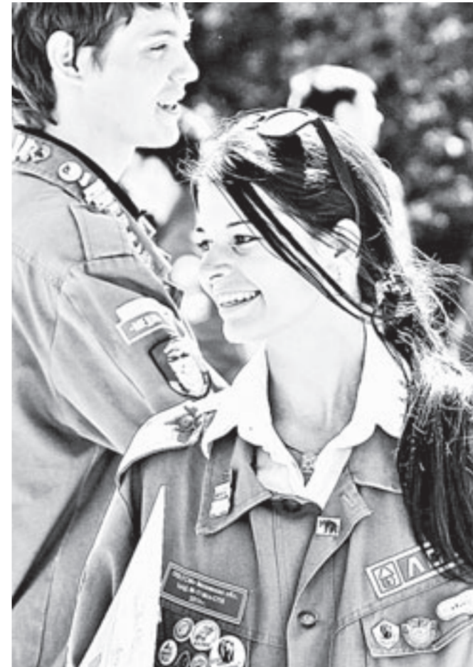
Девушки-бойцы не боятся тяжёлой работы.

отрядов, 12 педагогических, 7 сервисных, 13 отрядов проводников, городской экологический и сводный медицинский. Активисты будут трудиться на крупных строительных объектах региона, в детских оздоровительных лагерях, на сельскохозяйственных предприятиях, в центральных районных больницах. Студентов в разгар туристического сезона отправят на «Бирюзовую Катунь». Опытные бойцы примут