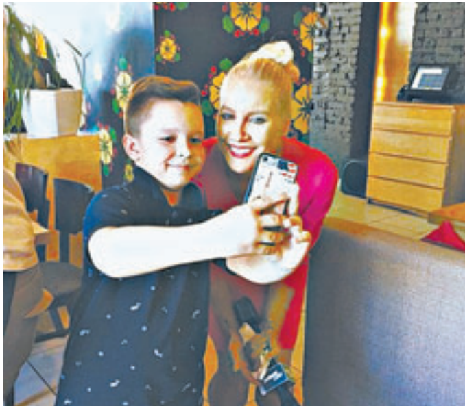
Елена Летучая с удовольствием сфотографировалась с барнаульскими фанатами.

Как пишут поклонники программы, Елена Летучая прибыла в Барнаул утром 1 июня и почти сразу начала ревизию. По словам пользователей, ее виде-