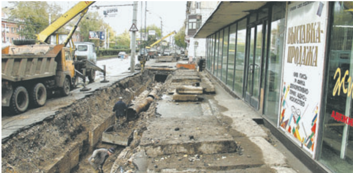
За 2013-2014 годы Барнаульским филиалом СГК на ремонт теплотрасс потрачено 230 млн руб.