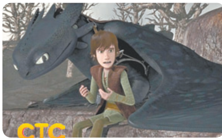
09.10 М.ф. «Драконы. Защитники Олуха» (6+)

5 06.30 Джейми: обед за 15 минут (16+) 07.00 Поздравь своих домашних (0+)