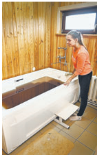
В среднем процедура принятия ванны длится около 15 минут.