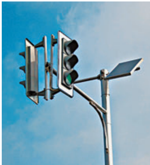
Светофор от солнечной батареи.

В центре Барнаула обычные светофоры меняют на новые, которые работают от солнечных батарей.