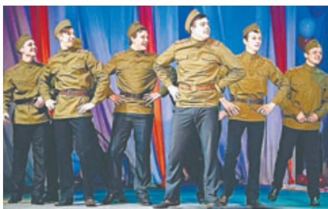
Конкурс агитбригад в самом разгаре.

– Парни и девушки прониклись идеями агитбригад. Каждое совместное творение было неповторимым и даже шокирующим. Живая музыка, душевные песни, сложные поддержки в танцах, необычные декорации демонстрировали слаженность команд.