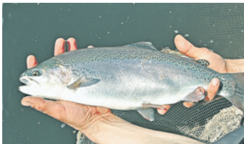
Форель. А что, вполне товарный вид!