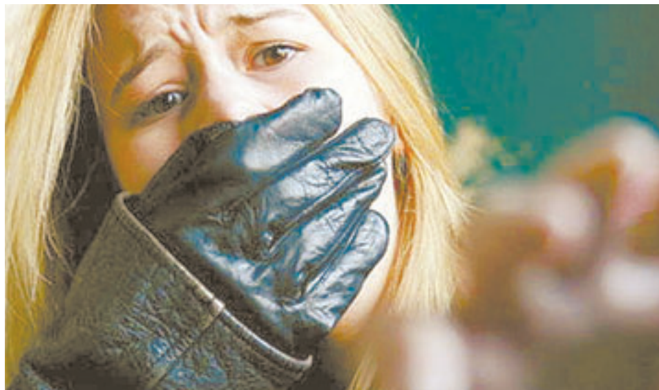
Жертвой убийц стала подруга детства.