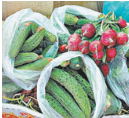
Алтайские огурцы и редиска. К столу!

– Каждый год к 1 июня я уже срываю первый огурец, – говорит пенси-