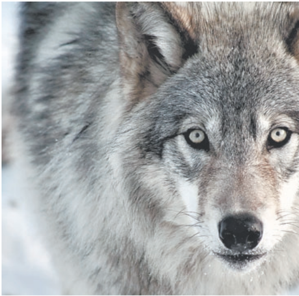
Каждый вид дикой природы бесценен для планеты Земля.

Волк серый – важнейший вид охотничьей фауны России. Животноводству и охотничьему хозяйству этот хищник наносит значительный ущерб. Он выступает распространителем многих заболеваний животных и человека. Поэтому волка интенсивно преследуют. Но для поддер-