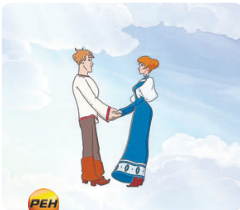
20.15 М.ф. «Иван Царевич и Серый Волк» (0+)

06.30 Джейми: обед за 15 минут (16+) 07.00 Поздравь своих домашних (0+) 07.25 Гороскоп «Будь готов!» (0+) 07.28 Погода в Барнауле (0+) 07.30 Х.ф. «Евдокия» (0+) 09.35 Сериал «Вербное воскресенье» (16+) 18.00 Поздравь своих домашних (0+) 18.25 Гороскоп «Будь готов!» (0+) 18.28 Погода в Барнауле (0+) 18.30 Поздравь своих домашних (0+) 19.00 Х.ф. «Унесенные ветром» (12+) 23.25 Звездная жизнь (16+) 00.00 Поздравь своих домашних (0+) 00.25 Гороскоп «Будь готов!» (0+) 00.28 Погода в Барнауле (0+) 00.30 Х.ф. «Храни меня дождь» (12+)