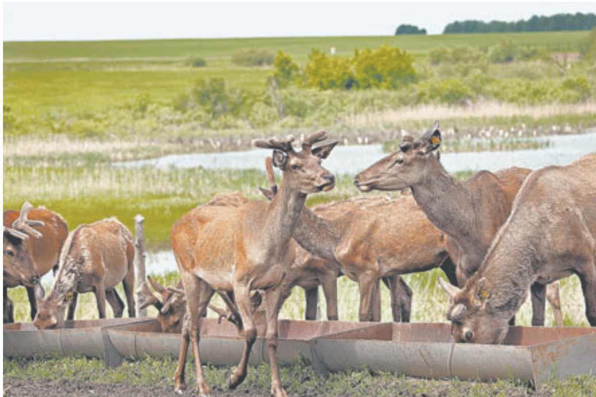
Сейчас в маральнике живут 42 взрослых марала.

Самый большой пант, полученный в маральнике компании «Курорт Белокуриха», весит более 10 килограммов. Наиболее качественные рога у самцов в возрасте 9-10 лет, в среднем маралы живут около 15 лет.