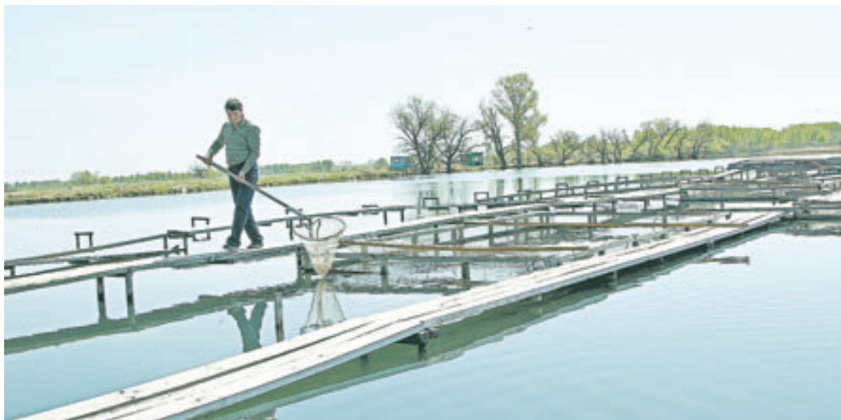
Рыбоводческое хозяйство «СТК» в Советском районе.

В будущем планируется выращивать до 1000 тонн. Эта цифра красноречиво смотрится на фоне совсем давних показателей. Ведь в советский период только лишь на продвинутой Бурлинской системе озер улов достигал 600-700 тонн за год. А в целом на круг (1980 годы) Алтай мог выдавать на-го-