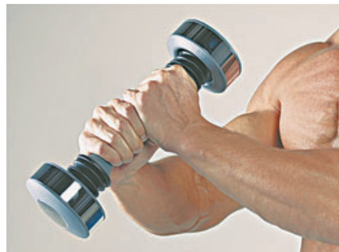
Вот такая «живая» гантель.