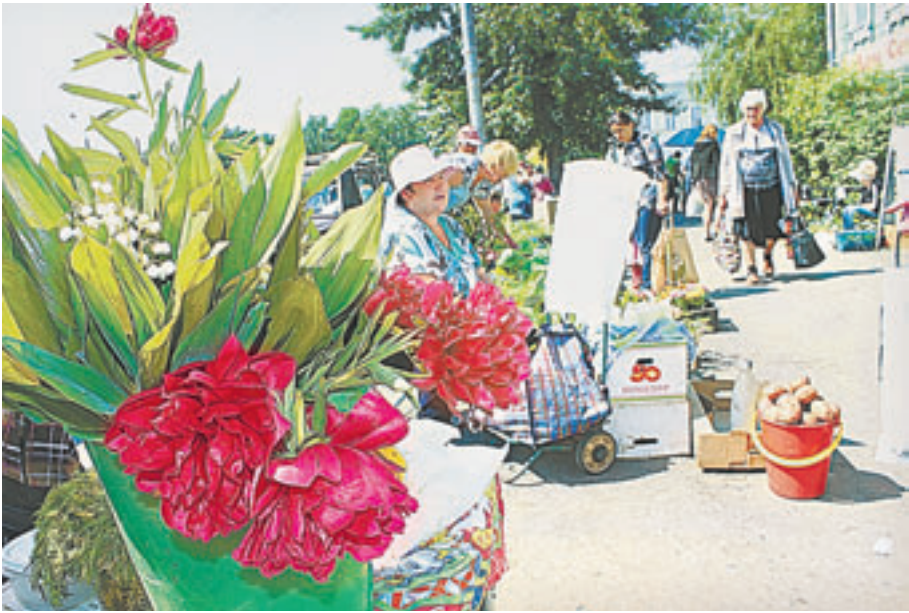
На рынке можно купить все – хоть букет любимой жене, хоть ведро картошки.

На рынках города появились первые домашние огурцы. И это самое хрустящее доказательство того, что лето наступило не только по календарю.