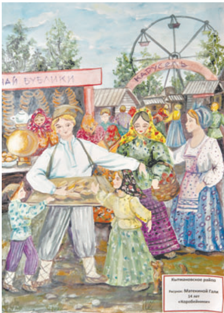
Кооперация с точки зрения детства. Один из рисунков, представленных на конкурс в честь столетия краевой кооперации.

– Давайте на примерах. Как, скажем, реализуется на прак-