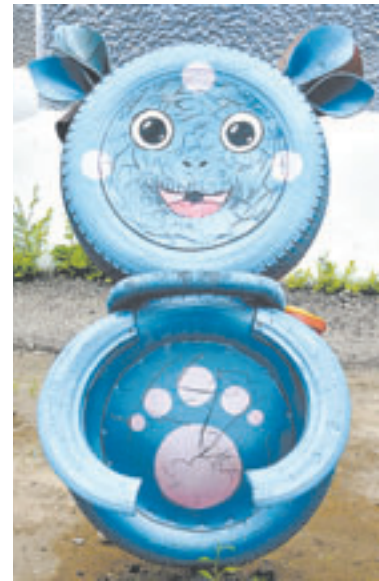
Лунтик – одно из творений родителей у ныне действующего здания детсада «Ласточка».