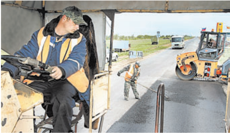
Заделка стыков – наиболее ответственная операция.

Когда вы читаете эти строки, автомобили из Славгорода в Яровое несутся со скоростью 100 км в час по новому асфальту. Семикилометровый участок дороги, капитально не ремонтирующийся больше 20 лет, наконец обрел свой первозданный вид.