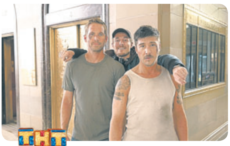
20.00 Х.ф. «13 район. Кирпичные особняки» (16+)

3 06.30 Джейми: обед за 15 минут (16+) 07.00 Наши новости. Специальные репортажи за неделю (16+) 07.25 Гороскоп «Будь готов!» (0+) 07.28 Погода в Барнауле (0+) 07.30 Секреты и советы (16+)