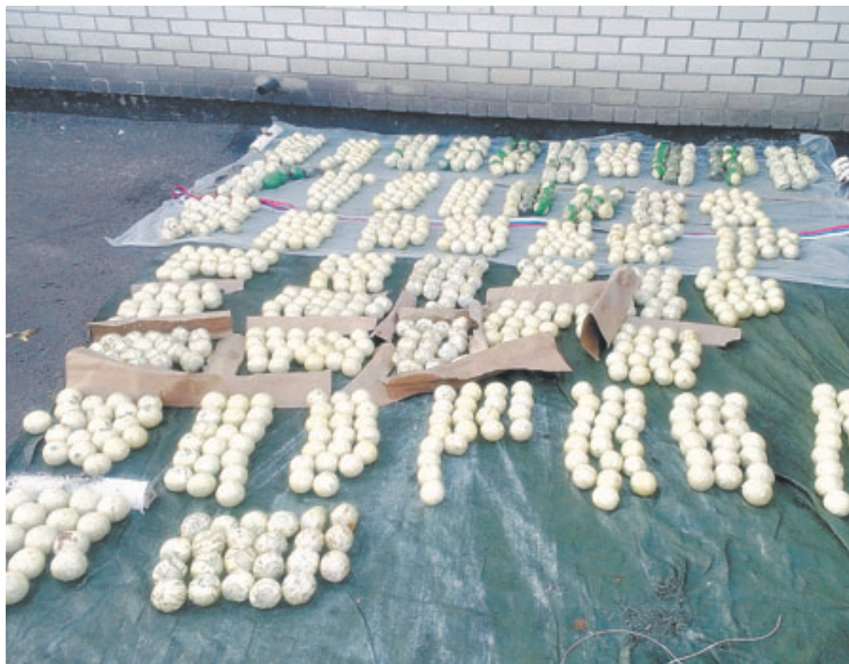
Те самые капсулы, заполненные высококачественным героином.

– Владельцем автомобиля, на котором перевозился товар, являлся гражданин Казахстана, – пояснили в УФСБ. – Машину наркодельцы взяли в аренду, двух водителей наняли. Далее машина пошла в Киргизию, где была произведена загрузка товара. На тот момент на складе находилось более 20 грузовиков. После загрузки колонна выдвинулась в Казахстан, беспрепятственно прошла по территории республики, хотя