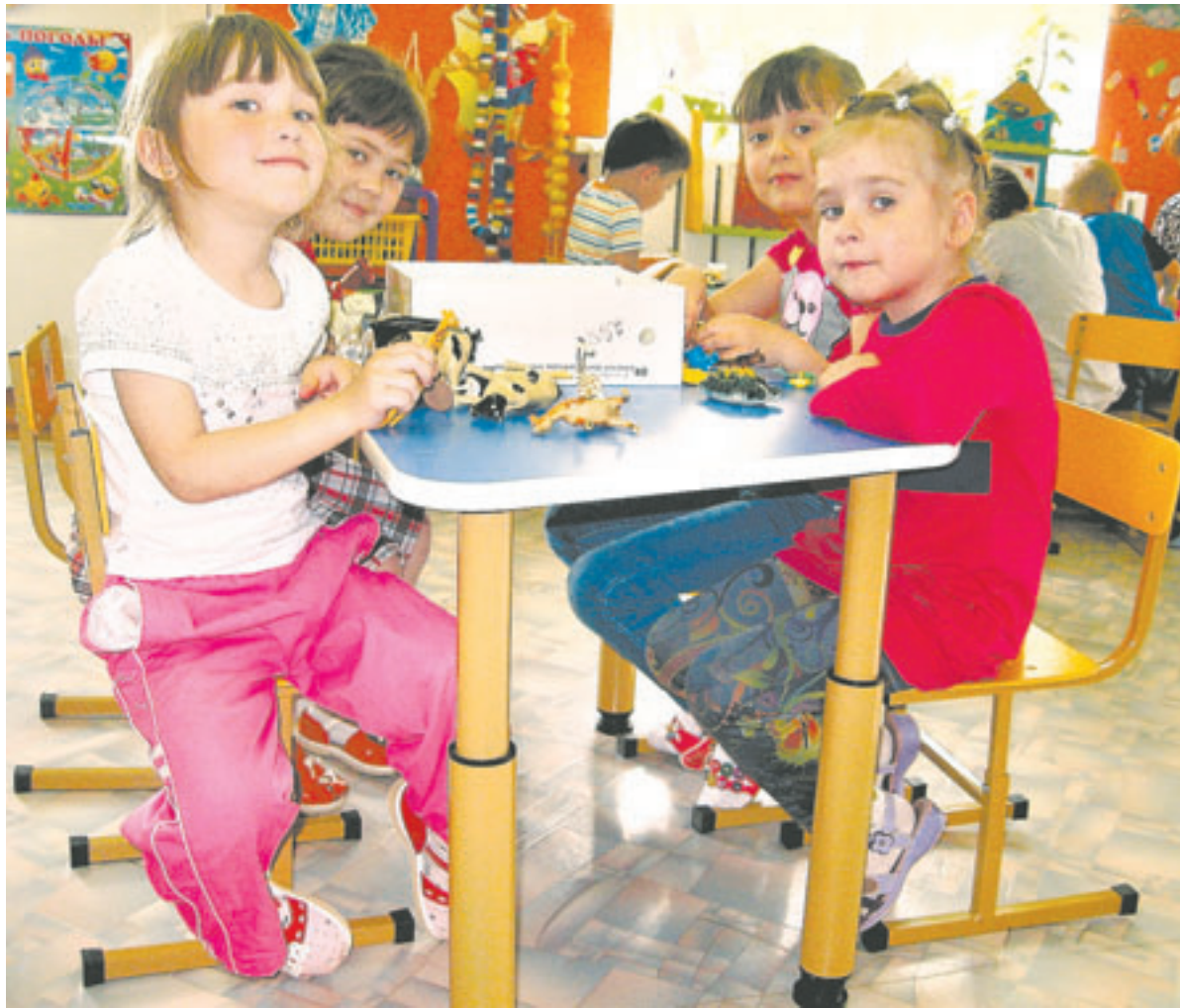
Дети с нетерпением ждут переезда в новое здание дошкольного учреждения.

Осенью в райцентре Угловское ликвидируют очередь на места в детский сад «Ласточка». К открытию готовится новое здание дошкольного учреждения.