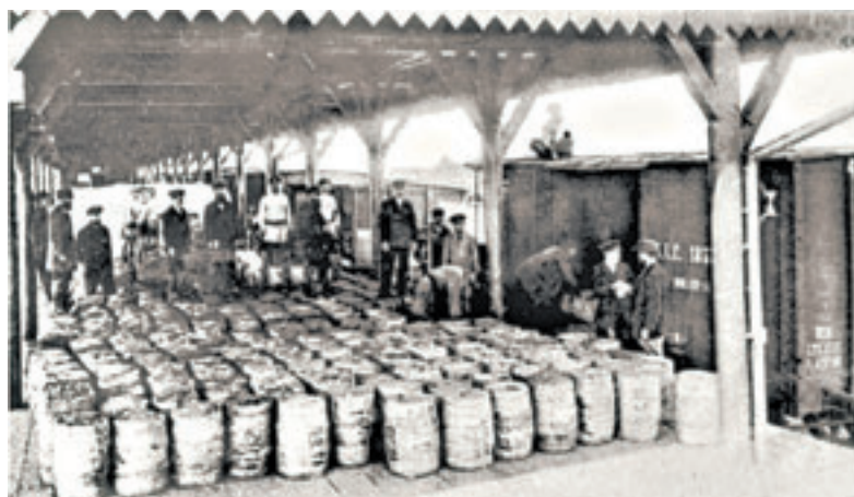
За помощь фронту во время Первой мировой войны кооператоров Алтай поблагодарил император Николай II. Отправка масла по железной дороге.