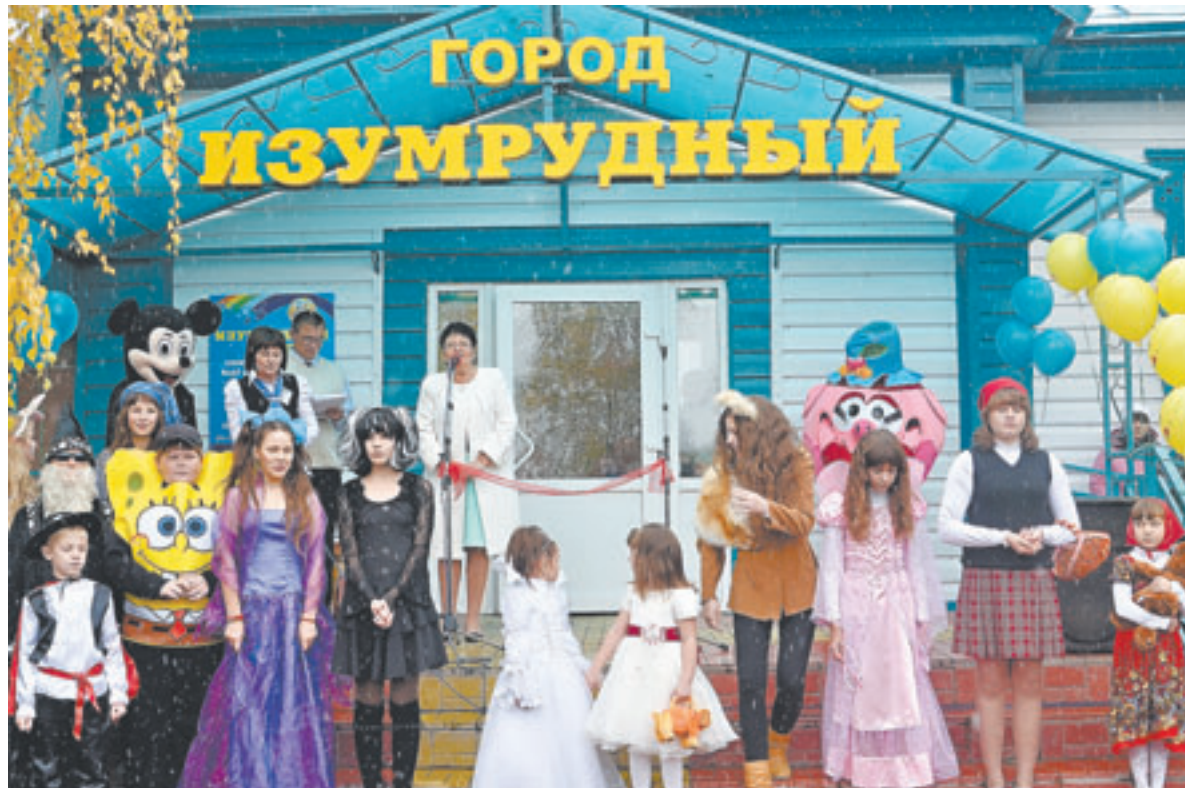
Проект торгового комплекса с детской анимационной зоной «Город Изумрудный» выиграл краевой губернаторский грант и стал примером социальной ответственности потребительской кооперации.