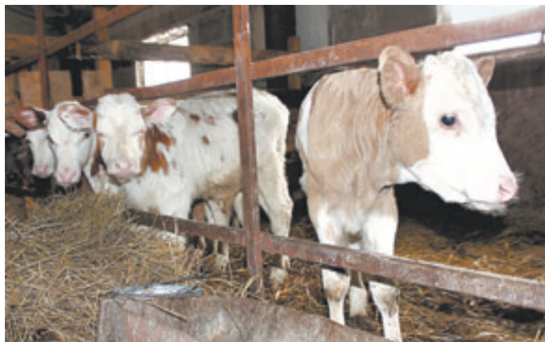
К осени молочное поголовье вырастет до 150 единиц.

ранов и кое-какая техника. Вот с них-то все и пошло-поехало. Сначала в форме ИП, потом в виде ООО новосибирский бизнесмен организовал на алтайской земле и поставил на ноги крепкое сельскохозяйственное предприятие.