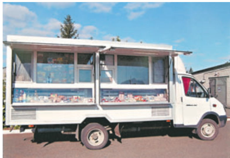
Автомагазин работает в Кулундинском районе. Разрабатывается схема движения таких спецавтомобилей по дорогам края.

ка от реализации лотка хлеба, конечно, не покроет транспортных расходов. Но коли уж мы социально ответственная организация, то и убытки, до 70 миллионов рублей, компенсируем сами. По-другому нельзя. Кооперация создавалась как социальная структура, и мы – продолжатели этой миссии.