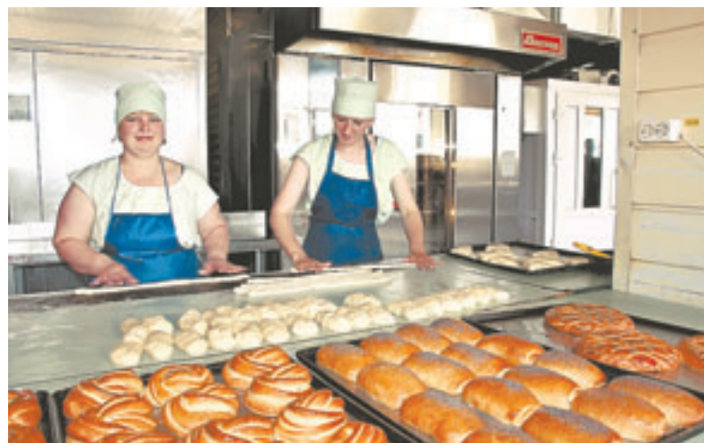
Потребкооперация: формат меняется – принципы неизменные.

– Точка существует, но мы же работаем для людей. Почти 300 торговых предприятий в малых селах сегодня убыточны, выруч-