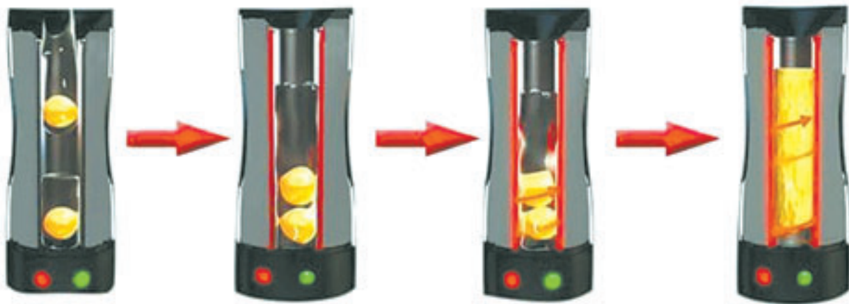
С такой печкой и сковородка не нужна!

В магазинах бытовой электроники стали продавать печки, которые позволяют приготовить очень оригинальную яичницу.