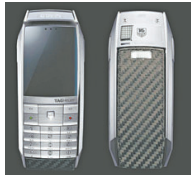
Так выглядит элитный телефон марки Tag Heur.

ка часов и телефонов. Стоимость самой дешевой модели телефона Tag Heur начинается от 90 000 рублей.