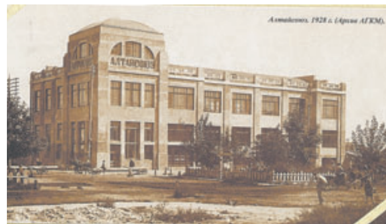
Историческое здание в краевой столице на пр. Ленина, 8 в начале XX века принадлежало Алтайскому крайпотребсоюзу.

тае, человек, создавший привычный всей России имидж региона – кормилица страны.