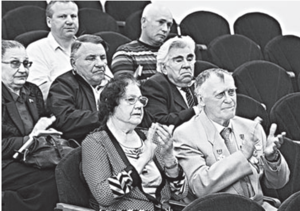
Встреча добрых друзей.

Это уже вторая поездка фронтвочки на парад Победы. Организацию нынешнего, юбилейного, она назвала безупречной. Ей понравилось все. Забота, которой окружили ветеранов офицеры – кураторы делегаций из регионов, с момента их заселения в дом отдыха Министрства обороны близ Мытищ. Кроме парада, где, как и 70 лет назад, были плечом к плечу защитники Родины из Краснодар, Омска, Иркутска, Осетии, и культуры