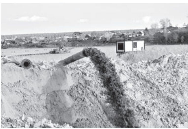
Так убирают грязную илину со дна водохранилища.

Подходит прораб «Бийскмелиоводстрой» Илья Кривобоков, он объясняет, что иловые отложения со дна разрабатываются плавучим земснарядом и по трубопроводу вместе с водой подаются в карты намыва, которые расположены выше водохранилища, на незастроенной территории. Вода, осветленная в картах, через водосбросные колодцы и трубу сбросного коллектора возвращается в реку Касмалу и далее в водохранилище.