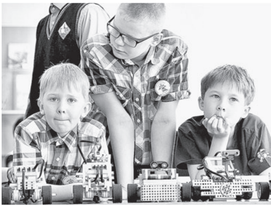
К поединку готовы!

— Дети заинтересовались, так что мне пришлось освоить роботов! — смеется она. — Но ученики меня уже давно обогнали — соображают моментально! У