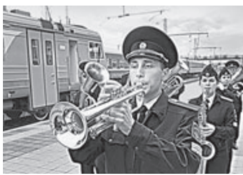
Танк провожают элентрички.