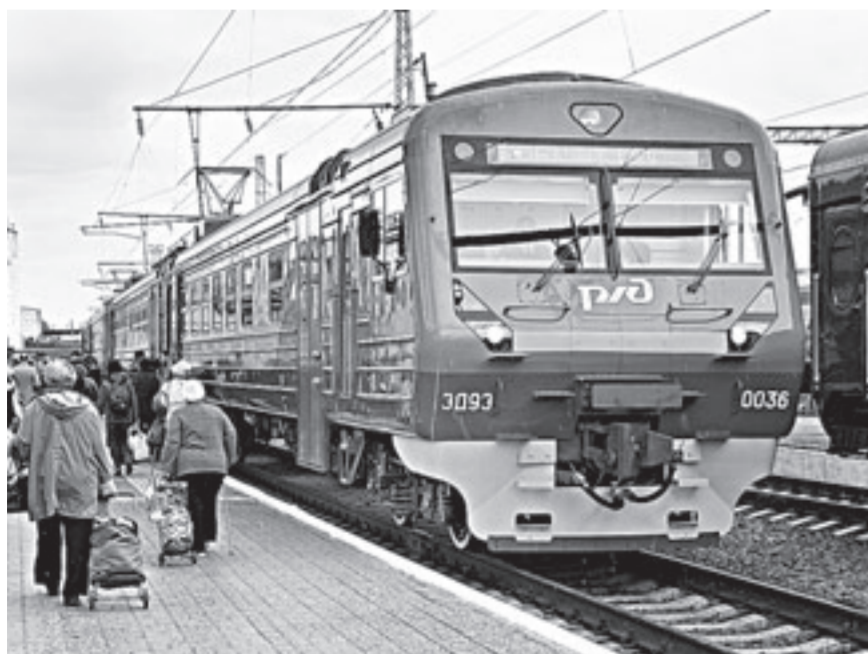
Новый электропоезд будет курсировать по маршруту Барнаул–Черепаново.

Вчера, 22 мая, от железнодорожного вокзала Барнаула отправился в свой первый рейс новейший российский электропоезд ЭД9Э. Он будет ходить по маршруту Барнаул – Черепаново и, нет сомнений, пользоваться большой популярностью у пассажиров. Мало того, что подвижной состав электрички новый, он еще и оборудован по последнему слову техники.