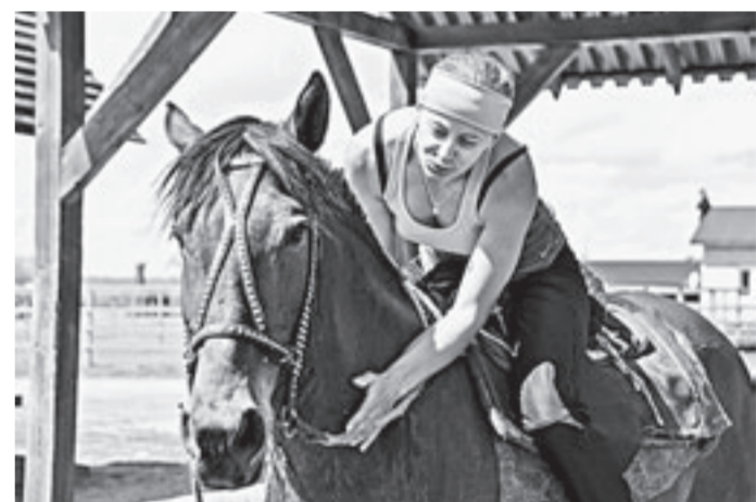
Ольга Вилухина проводит свое свободное время на ипподроме «Сибирского подворья».

Российская биатлонистка Ольга Вилухина отдыхает в Белокурихе.