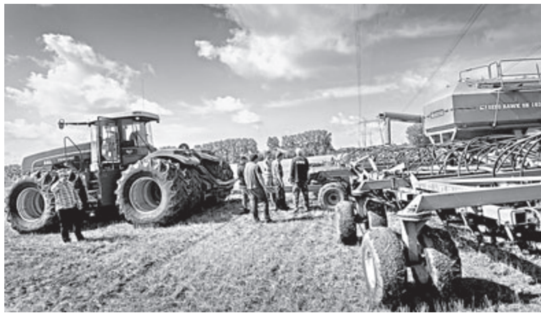
Танку технику хозяйство пока закупает в других странах.

По словам представителей хозяйства, чтобы технология проявила в действии, необходимо работать с двумя десятками разных культур.