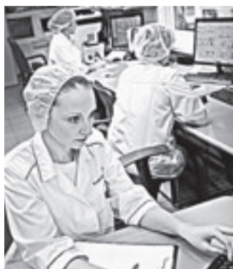
Каждый этап производства – под строгим контролем.

Рубцовский молочный завод увеличил объемы выпуска продукции. Теперь здесь будут производить знаменитый сыр «Ламбер» на 40% больше – до 70 тонн в сутки. Ведь спрос на «Ламбер» значительно превышает предложение!