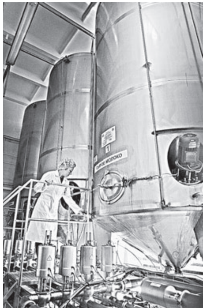
В модернизацию завода вложено около 300 млн. рублей.

– Мы даем внятный посыл аграриям, что молочное животноводство в регионе необходимо, – сказал глава края. – Эта отрасль перспективная, молоко есть куда реализовать по достойной цене. Рубцовский молоч-