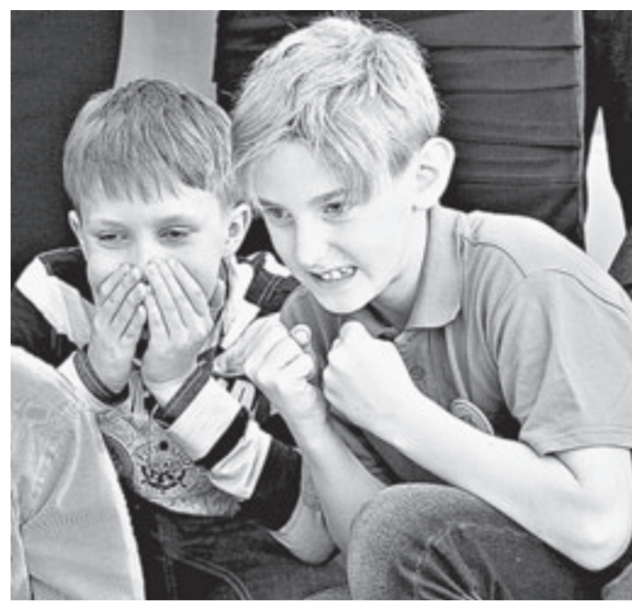
Робототехники, они же больешики.