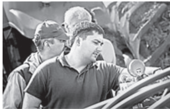
Машины находятся под постоянным контролем представителей сервисных служб.