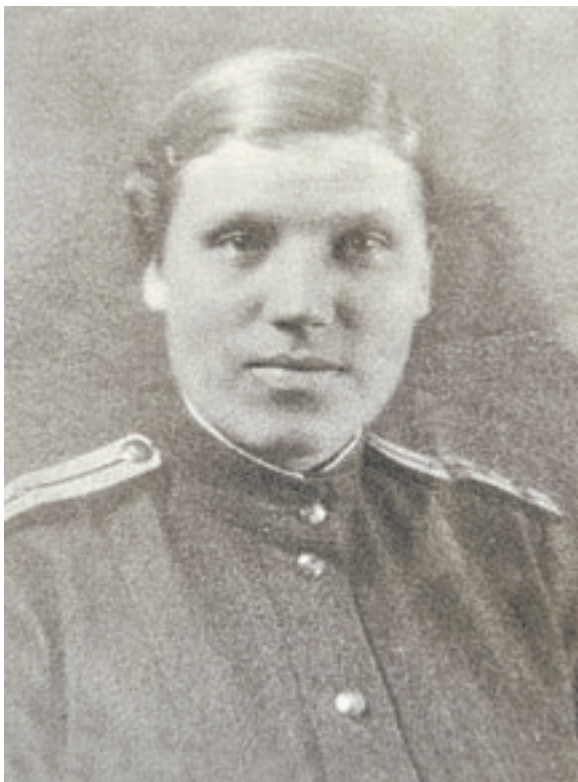
Военврач, дошедший до Берлина.