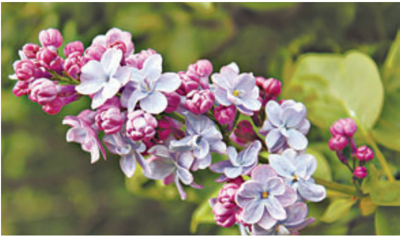
Цветет сирень – влюбиться не лень!