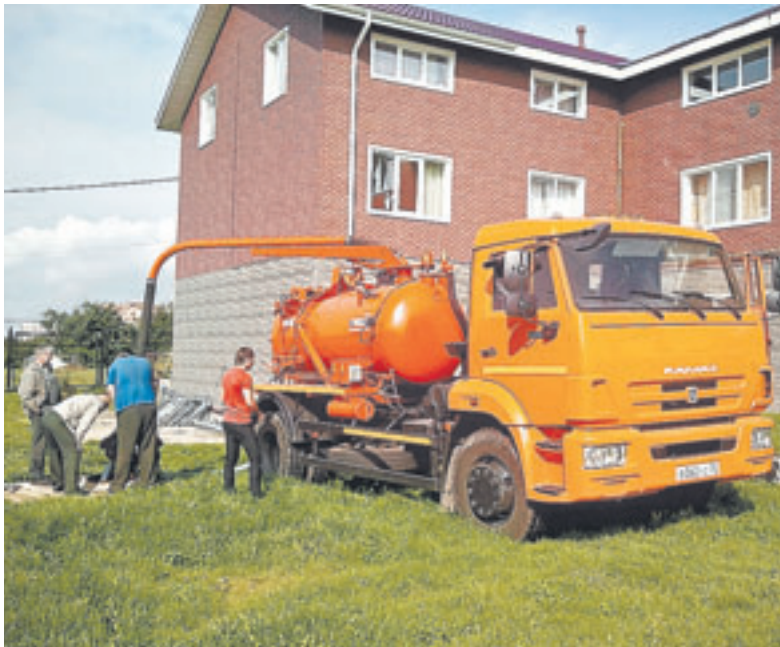
Проблема утилизации жидких бытовых отходов волнует многих.