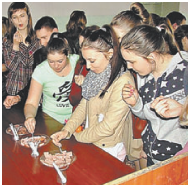
Дегустация колбасных изделий.

Перед сессией студенты биолого-технологического факультета организовали вкусный праздник. «Надо ведь набираться сил перед сдачей зачётов и экзаменов», – шутят ребята. Они купили колбасу, сосиски, красиво нарезали и украсили стол в одной из аудиторий. Однако перед дегустацией гостям мероприятия необходимо было ответить на вопросы, связанные с мясными деликатесами. Также ребята посмотрели презентацию студентов четвёртого курса направления подготовки «Технология