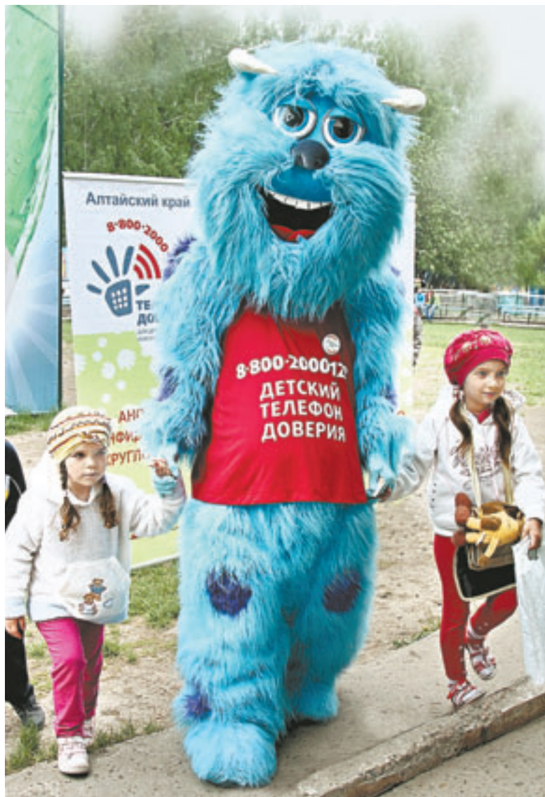
17 мая 2015 года, парк «Лесная сказка», акция «Телефон доверия».