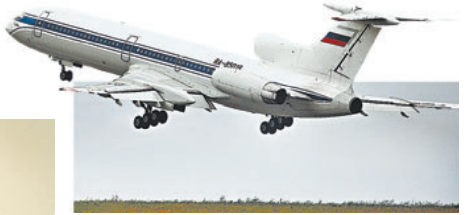
Барнаульский аэропорт обслуживает почти все типы самолетов.

– У нас свой цех, который обеспечивает пассажиров бортовым питанием. Но последнее время авиакомпании стараются сокра-