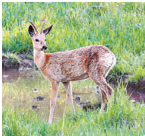
Косуля на водопое.

Немало вызволенных из беды животных на счету госинспекторов, егерей, экологов. Классикой стали факты спасения лебедей-кликунов, которые занесены в Красную книгу.