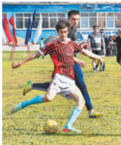
Во время турнира по мини-футболу.