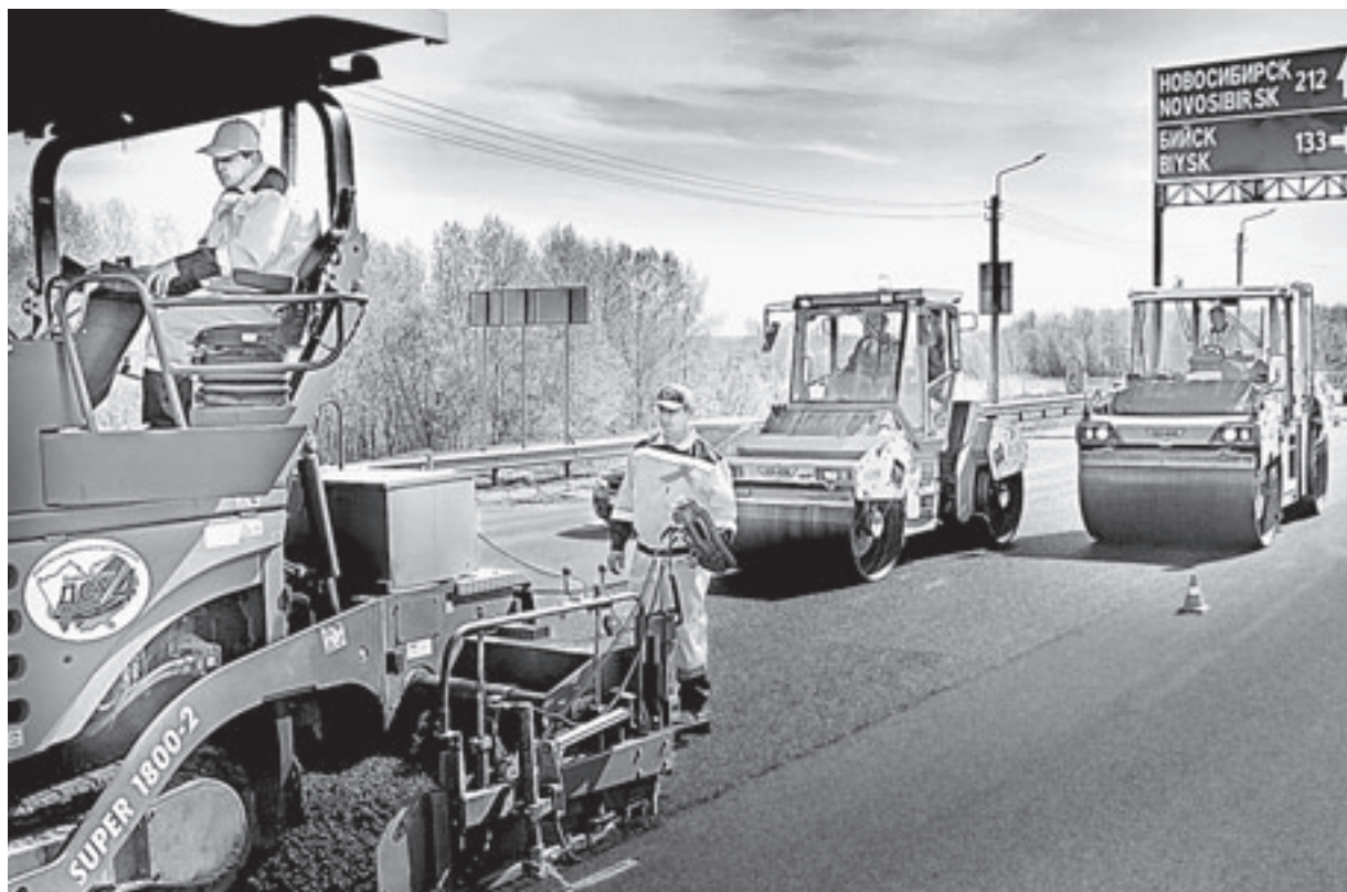
Полным ходом идёт ремонт главных дорог на въезде в Барнаул.

Ремонт участков дорог на въезде в Барнаул по старому и новому мостам начался в конце апреля. Работы ведутся на мостовом переходе