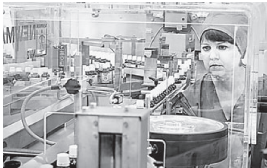
Бийск заслуженно называется наукоградом.

Высокотехнологичные и наукоемкие отрасли формируют примерно около двадцати процентов валового регионального продукта Алтайского края.