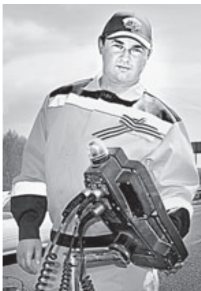
Следить за качеством помогает современная техника.

Медленно, но верно. Пожалуй, именно так можно охарактеризовать работу дорожных строителей, которые с первыми теплыми днями приступили к ремонту покрытия магистральных путей нашего края.