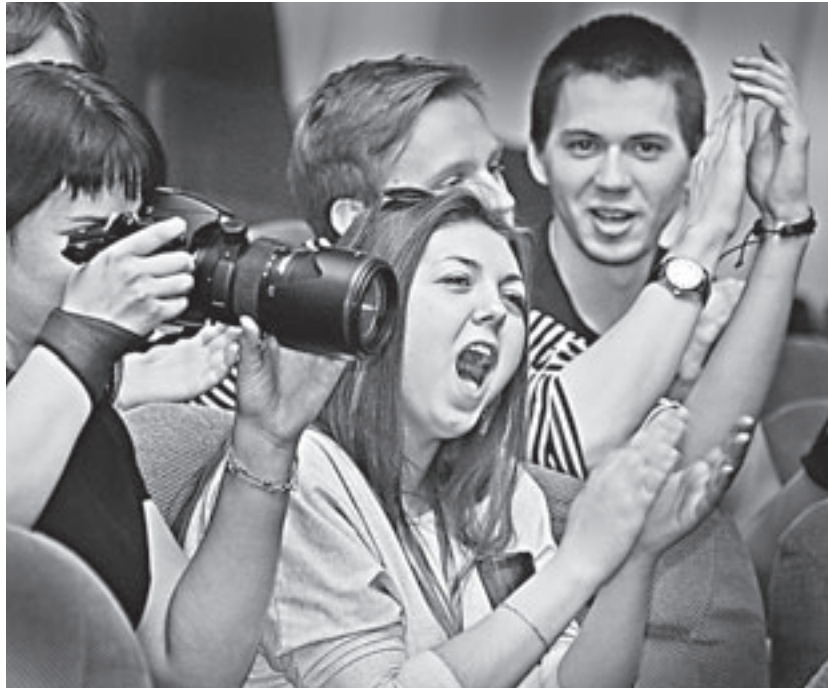
Равнодушных в зале не было.