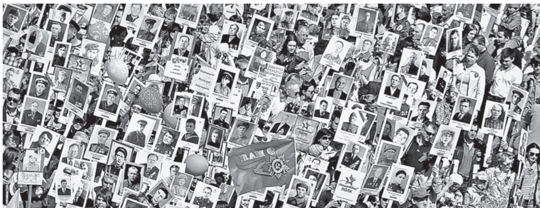
Участники акции «Бессмертный полк» шли непрерывным потоком.