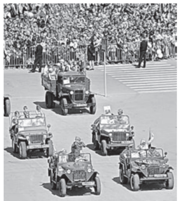
На площади – техника военных лет.