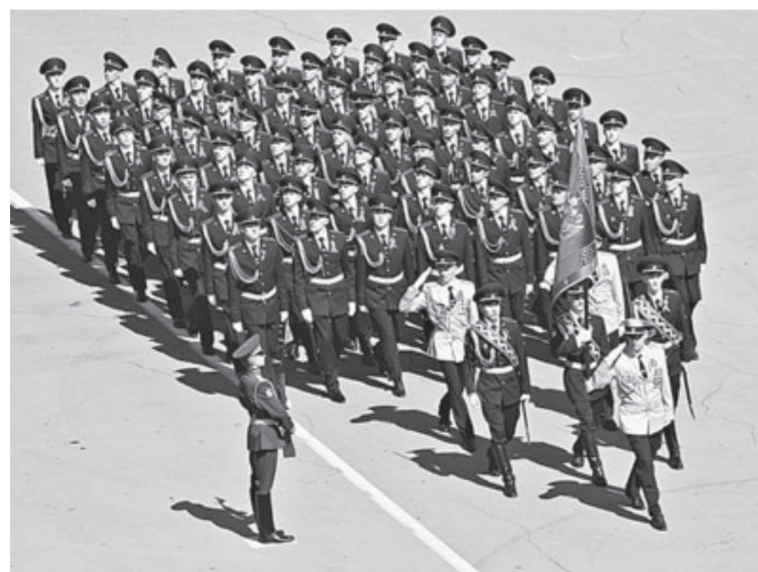
Во время построения войск Барнаульского гарнизона.

Свое поздравление в виде «Майского вальса Победы» преподнесли горожанам студенты и педагоги Алтайского государственного университета, талантливые исполнители из музыкаль-