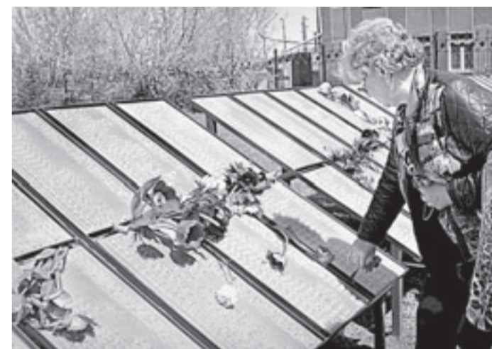
Плиты с именами фронтовиков стали настоящим подарком для всех жителей Кытмановского района к празднику Великой Победы.