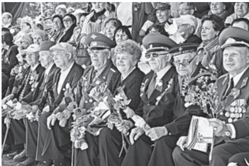
Ветераны принимают цветы и поздравления.