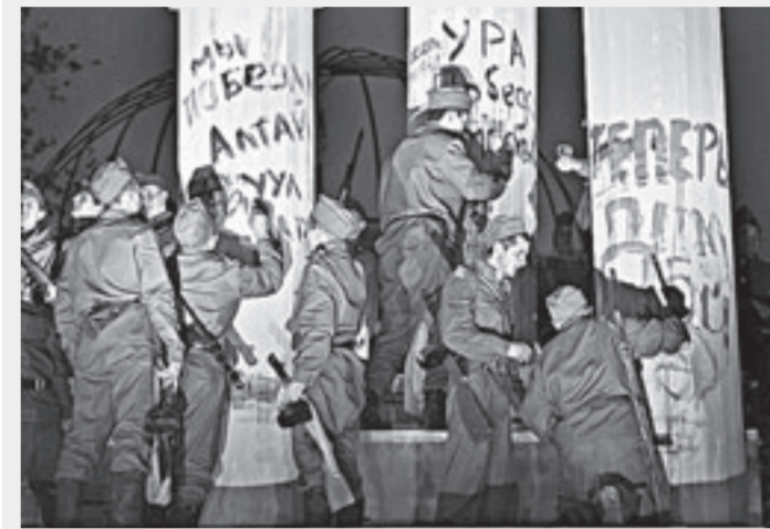
Холм на площади Сахарова превратился в Рейхстаг.

Поясним, реконструкция – это театрализованное представление, максимально приближенное к условиям реальных событий. Так, холм на площади Сахарова оформили под здание Государственного собрания Германии (Рейхстаг). Навверху были немцы. Специально для реконструкции были сшиты немецкая форма образца 1945 года, немецкие флаги. Для советских солдат форму тоже шили специально, а также брали реквизит (каска, деревянные винтовки) в музей города. Всего в импровизированном бою приняло участие около 400 человек. Большая часть – это студенты Барнаульского юридического института, остальные – школьники, учителя и даже родители. Репетиции начались за полгода до представления.