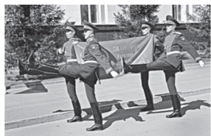
Начало церемонии поднятия копии Знамени Победы.