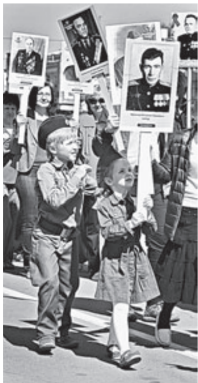
«Бессмертный полк» объединяет поколения.