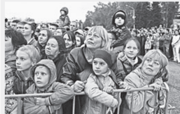
Штурм Рейхстага впечатляет.

Посмотреть на легендарный штурм Рейхстага пришло 7 тысяч горожан, в их числе – ветераны Великой Отечественной войны, их посадили на специальные скамейки. Среди зрителей был и губернатор края Александр Карлин.