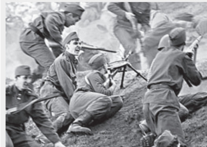
Бой получился правдоподобным.

Мало кто знает, но холм на площади Сахарова (он расположен за стеной и на нем часто проходят праздничные выступления) был возведен в Барнауле в военные 40-е годы. Так на площади замаскировали большие резервуары для хранения воды на случай, если бы город подвергся налетам вражеской авиации.