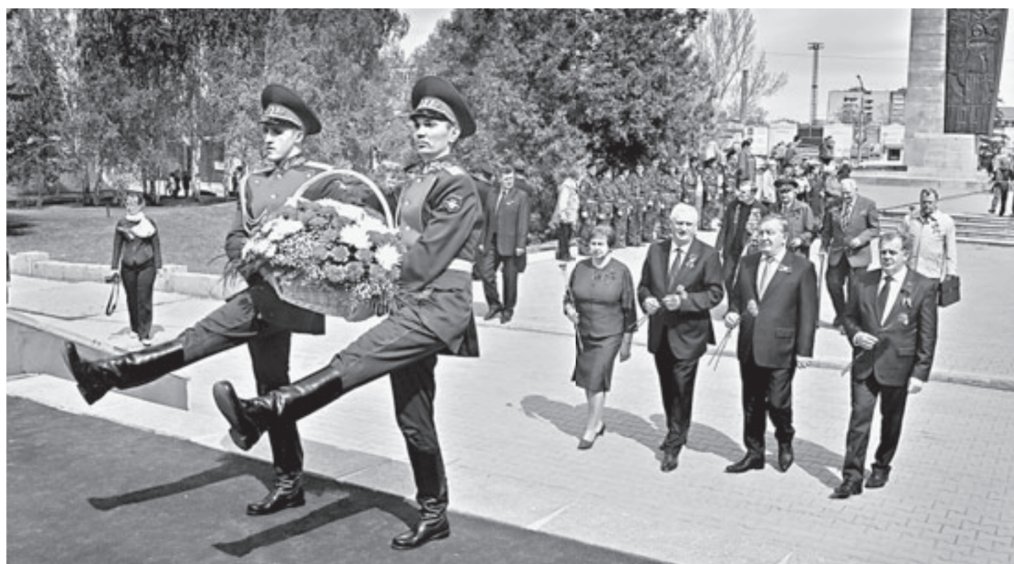
Торжественная церемония возложения цветов.