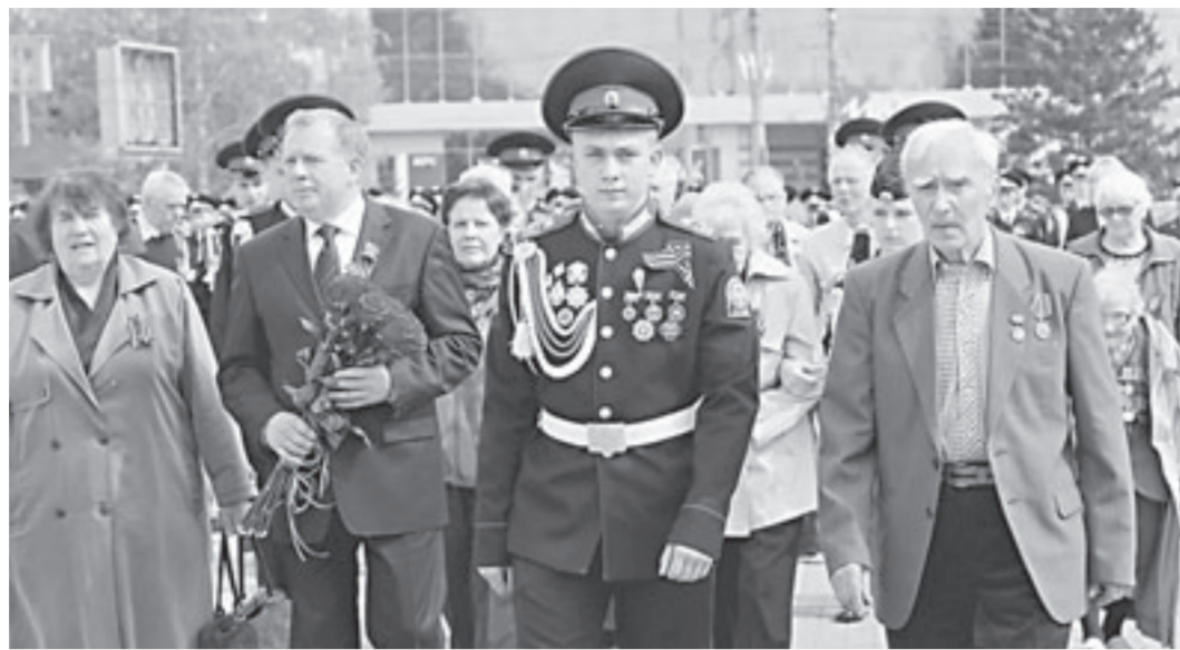
Возложение цветов к мемориалу Славы.