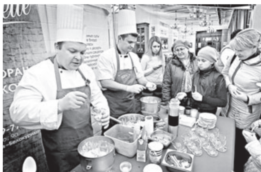
Повара ресторана «Мишель» приготовили мороженое на жидком азоте для участников форума VISIT ALTAI.