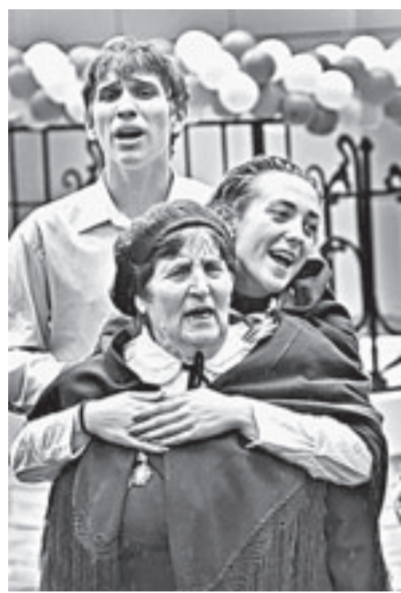
Студенты АлтГАНИ провели для пациентов госпиталя концерт.