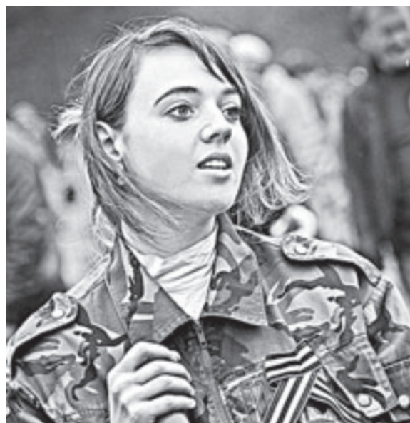
Школьники из Бобровки запоминают этот день.

– Считаю, что лучшей памяти, чем посадка деревьев, о людях, которые отдали жизнь за то, чтобы было мирное небо, быть не может. Сегодня в мероприятии участвует депутатский корпус КЗС, несмотря на партийную принадлежность, четвёртая