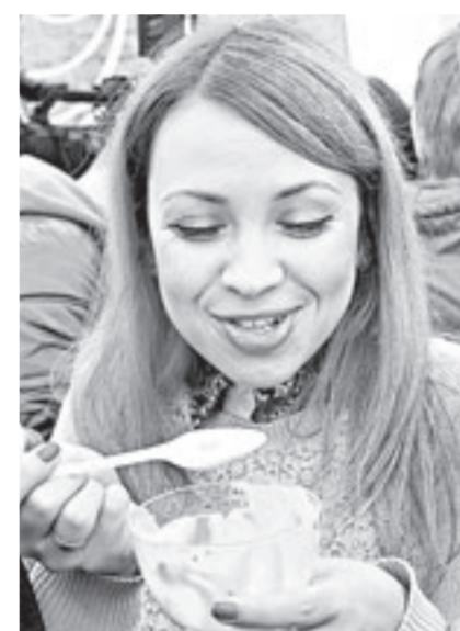
Это очень вкусно!