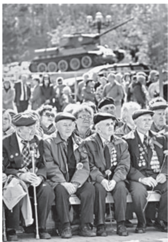
Они сражались за Родину.