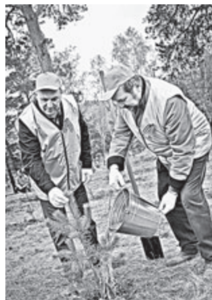
Депутаты – за работой.

часть депутатов краевого Законодательного Собрания лично принимает участие в посадке деревьев.