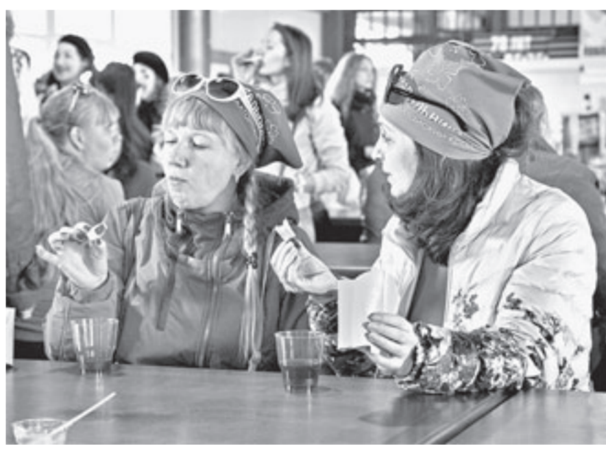
Ну очень вкусно!

говядина герефордской породы из Целинного района. На фестивале действительно было очень вкусно. Край готов предоставить своим гостям самые изысканные блюда с алтайской изюминкой.