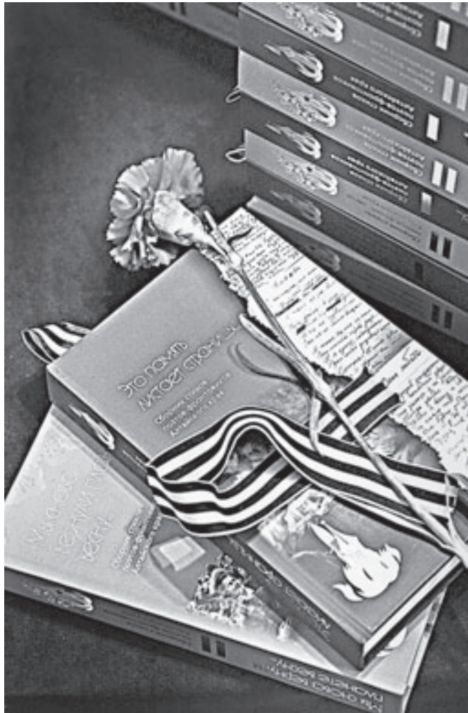
Книги займут достойное место в библиотеках края.