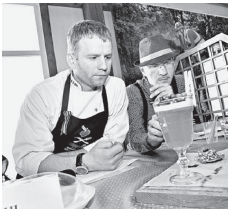
Жюри конкурса дегустирует блюда.