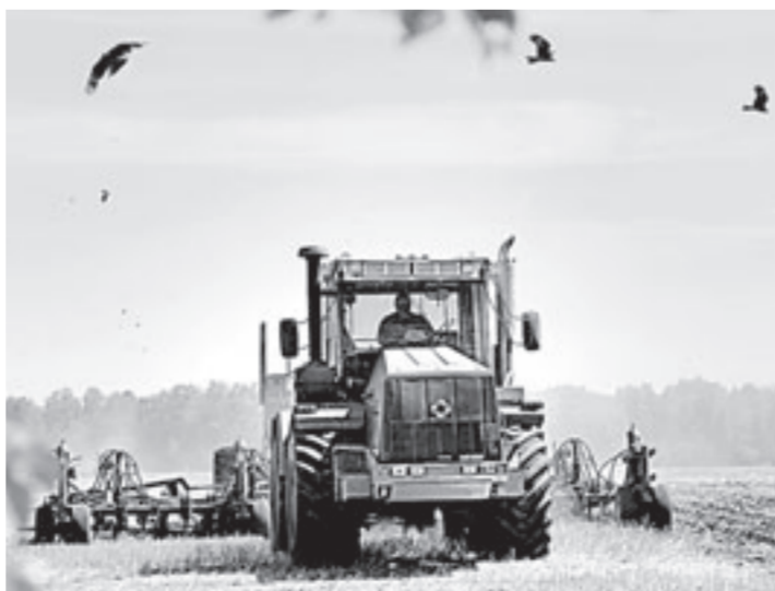
Посевные комплексы вышли в поля.