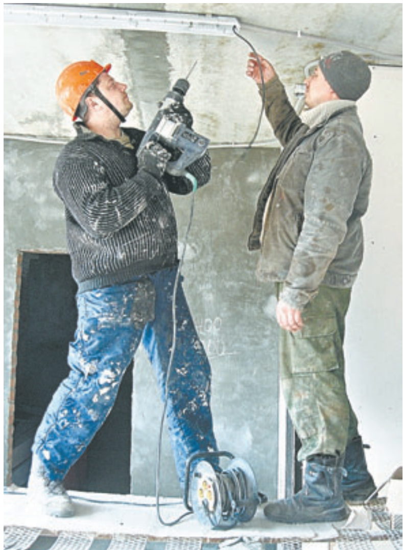
На сегодняшний день рабочие проводят монтаж перегородок, налаживают внутренние инженерные коммуникации.