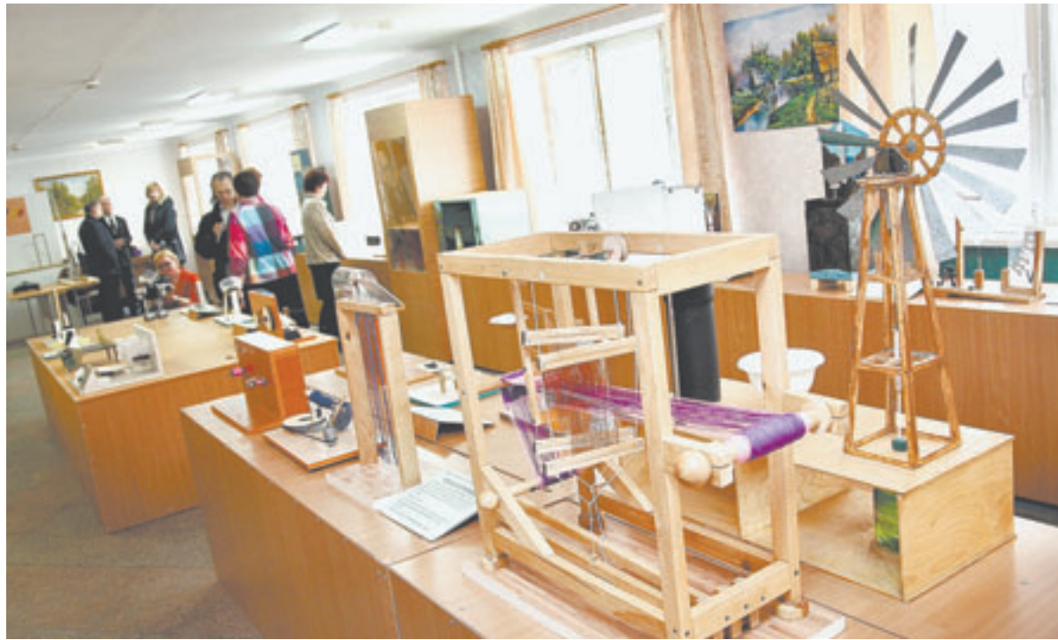
Всего в экспозиции 60 моделей различных устройств.

на этом месте создает образовательное пространство, которое способно мотивировать и детей, и взрослых на самостоятельное добывание знаний, – говорит он.