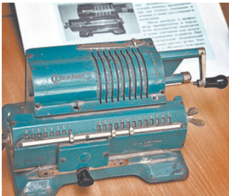
Арифмометр. Машинка, предназначенная для умножения, деления, сложения и вычитания. Этот калькулятор образца 1969 года весит килограмма два.

на этом месте создает образовательное пространство, которое способно мотивировать и детей, и взрослых на самостоятельное добывание знаний, – говорит он.