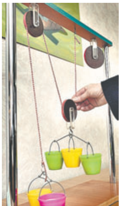
Тот самый подвижный блок, при котором два ведра оказываются тяжелее трех.

– Преподаватели и руководство АлтГПУ хотят создать учебно-музейный комплекс – это учебный класс, музей, лаборатория по истории техники и мастерская. Музей