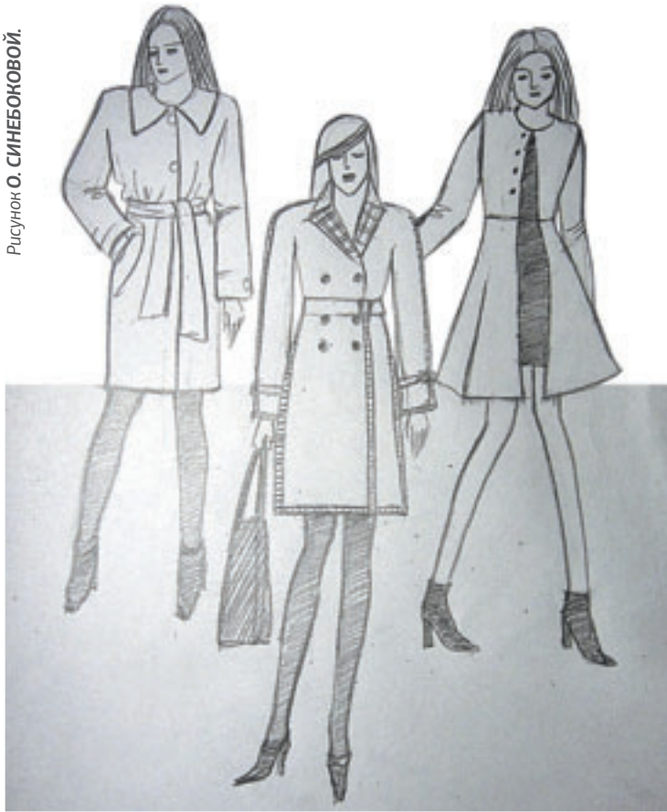
Рисунок О. СИНЕБОВОЙ.