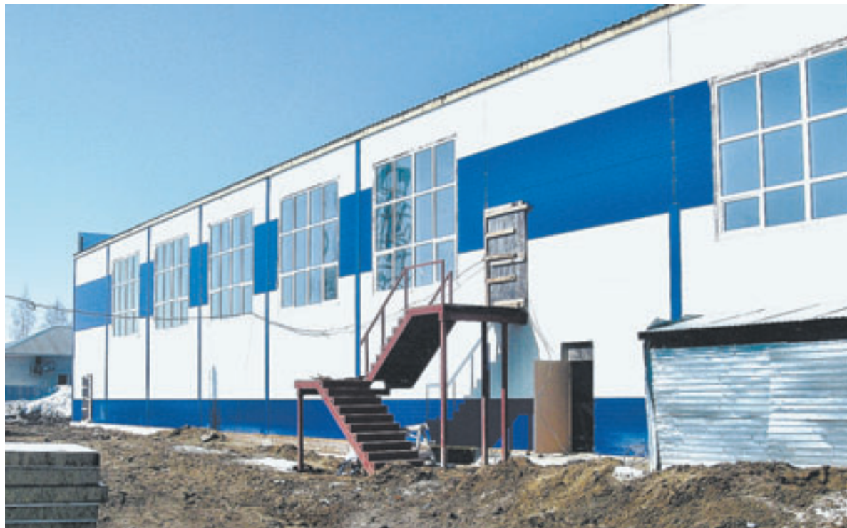
До открытия спортивно-оздоровительного комплекса предстоит благоустроить территорию вокруг самого здания.

— Это один из спортивных объектов, который строится в регионе по губернаторской программе «80x80». За основу взят типовой проект комплекса в Поспелихе. Здесь будет отличный игровой зал для волейбола, баскетбола,