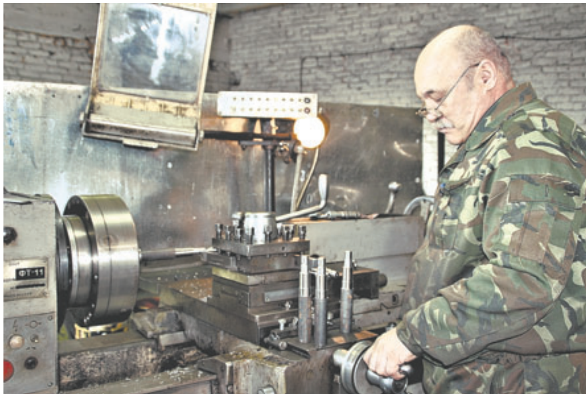
Надежные кадры для надежного оборудования.

Поначалу собственники – трое инициативных молодых людей не делали ставку на грабли. Но потом поняли, что это перспективная ниша. Алтайские предприятия сельхозмашиностроения не уделяют должного внимания этому сельхозорудию. Крестьяне в основном пользовались дорогими