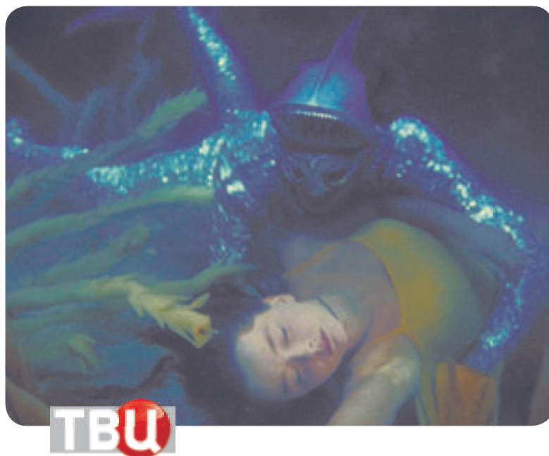
08.30 Х.ф. «ЧЕЛОВЕК-АМФИБИЯ» (12+)

06.30, 06.00 Экономь с Джейми (16+) 07.00 Наши новости. Специальные репортажи за неделю (16+) 07.25, 18.55, 00.25 Гороскоп «Будь готов!» (0+) 07.28, 18.58, 00.28 Погода в Барнауле (0+) 07.30 Секреты и советы (16+) 08.00, 05.55 6 кадров (16+) 08.15 Х.ф. «Безотцовщина» (12+)