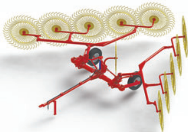
В прошлом году «Харвест» продал более 400 таких граблей-ворошилок.