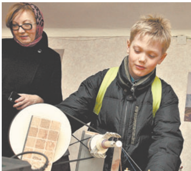
И дети, и взрослые найдут на что посмотреть.

В отличие от других музеев тут экспонаты не только можно трогать руками, но и нужно!