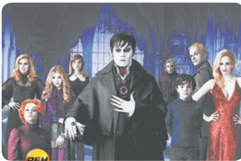
09.30 Х.ф. «Мрачные тени» (16+)

06.30, 06.00 Экономь с Джейми (16+) 07.00, 00.00 Поздравь своих домашних (0+) 07.25, 18.25, 00.25 Гороскоп «Будь готов!» (0+) 07.28, 18.28, 00.28 Погода в Барнауле (0+) 07.30 Секреты и советы (16+) 08.00 Домашняя кухня (16+) 09.30, 22.40 Звездная жизнь (16+) 10.15 Х.ф. «Белая ворона» (16+) 13.55 Х.ф. «Попытка Веры» (16+) 18.00 Спасатель Алтая (0+) 18.30 Вуз-ТВ (16+)