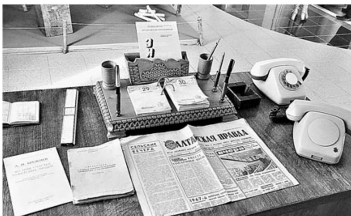
Музей. Стол директора советской эпохи.

На курсах повышения квалификации проходит переподготовку не только алтайские дорожники