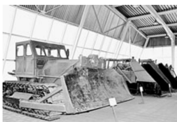
Техника XX века, а работать сможет и в XXI веке.

– специалисты среднего и высшего звена, но и их коллеги из других регионов Сибири.