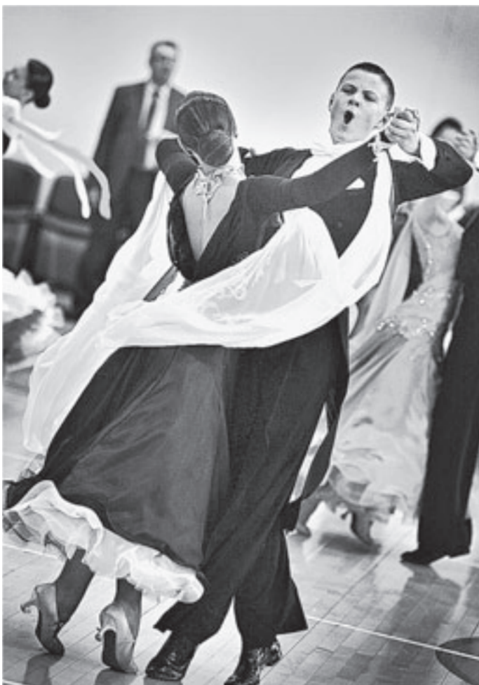
В вихре танца.

В Барнауле впервые состоялось первенство Сибири по танцевальному спорту среди детей. Оно прошло в рамках VIII Всероссийского турнира «Кубок Алтайского края».