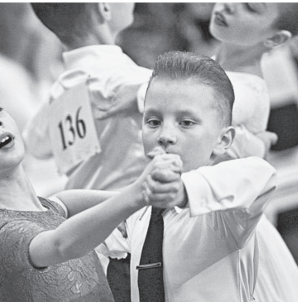
На паркете соревновалось около трехсот пар.

Одними из самых маленьких участников соревнований стали восьмилетние