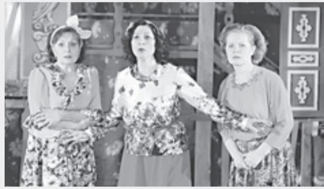
«Прибайкальская кадрили». Театр мюзикомедии.

19 апреля. 17.30 – «Собачье сердце» (12+). 22 апреля. 18.30 – «Два ангела, четыре человека» (16+).