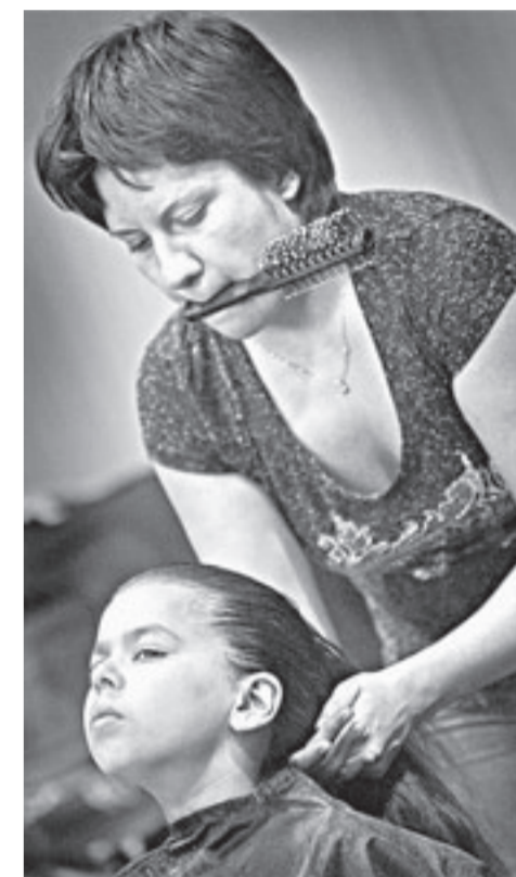
Красота добавляет уверенности.

Торжественным вручением дипломов и памятных наград не заканчивается феерверк танца, завтра снова тренировки, новые программы, азарт, неудачи и победы.