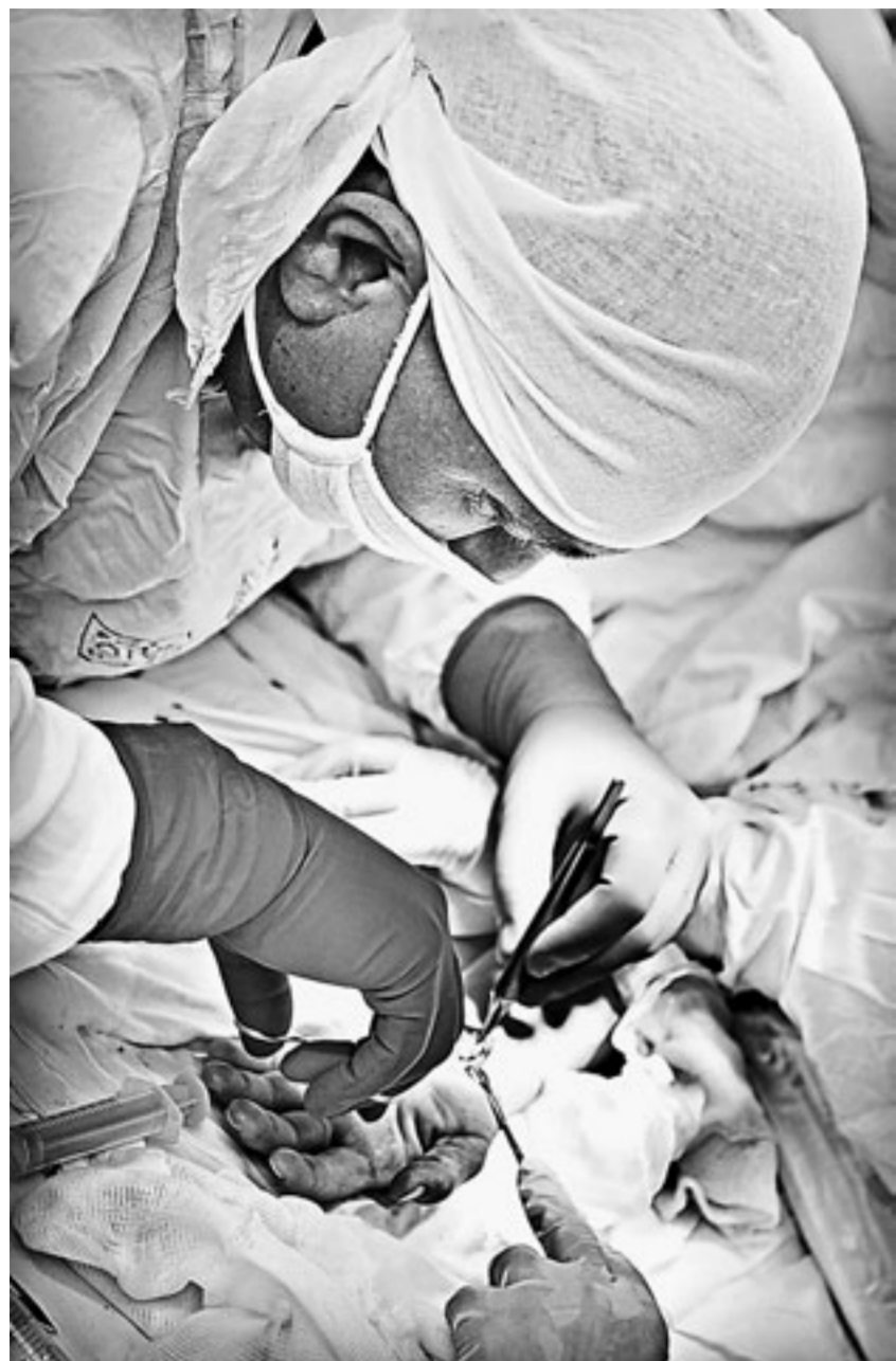
Работа хирурга – нан работа ювелира.