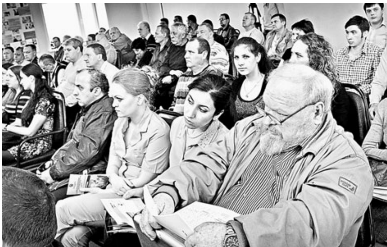
Конференция – повод для разговора о проблемах и успехах.