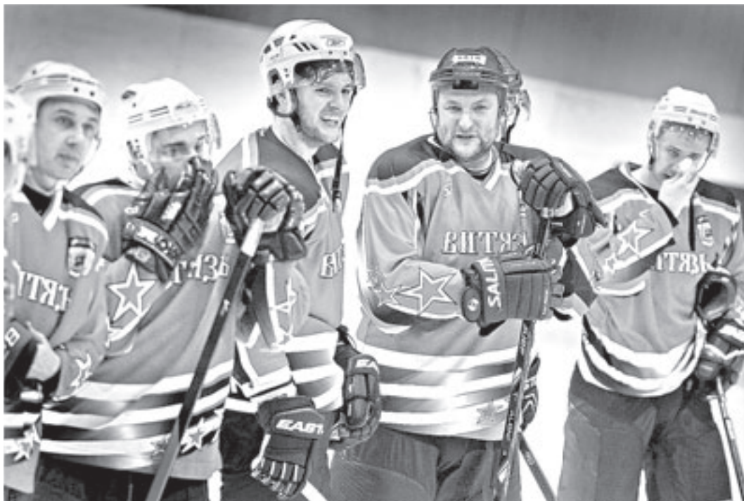
«Витязь» собрал команду-мечту.