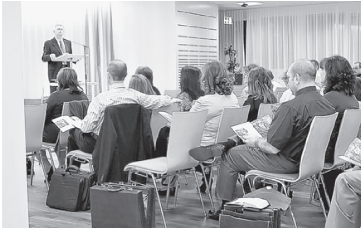
Способов воздействия на людей у сектантов очень много.

Помещением своего молебельного дома последователи вероучения не ограничиваются. Периодически организуют собрания в одном из крупнейших в Барнауле Дворце моторщиков. Там же открыто проповедуют свои взгляды, не смущаясь высокой арендной платы. Кроме того, «свидетели» раздают брошюры на улицах города, а какого они бывают содержания, показало