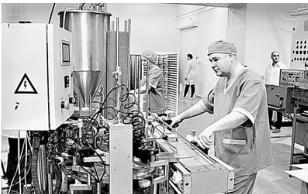
Современное производство – достоинство масло-сырзавода.

50 тонн перерабатываемого молока и выпуск 10