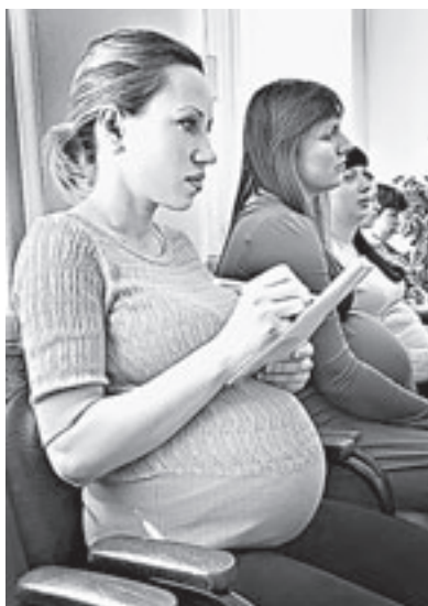
Все внимательно выслушать, а самое главное – записать.