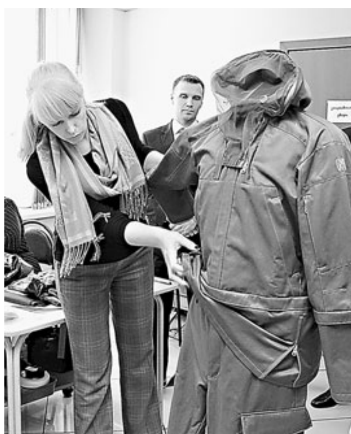
Новая модель – костюм для рыбалки и охоты.

Во-вторых, ориентируемся на наших конкурентов, в том числе зарубежных. Если у них активно продается модель, то мы должны сделать подобную, добавив лучше от себя. Допустим, у влагозащитной одежды проклеить изнутри швы специальной термотентой, которая не пропускает воду.