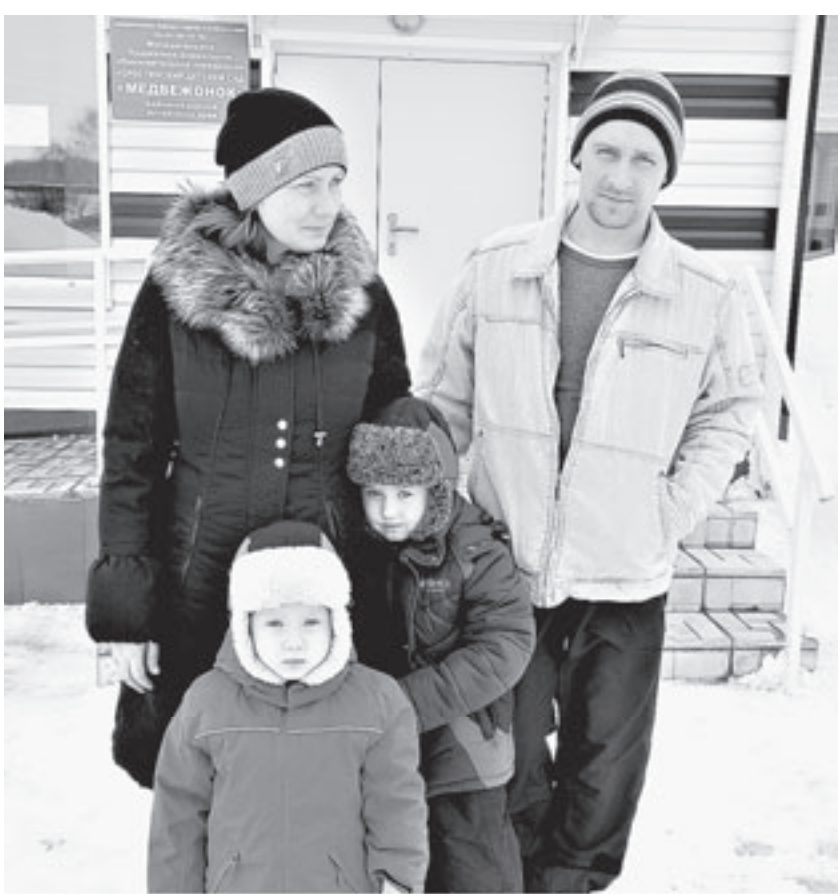
Они выбрали отличное место для жизни и работы.