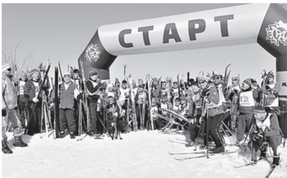
Первый алтайский лыжный марафон собрал 169 участников.

Специально на марафон приехали участники из Кемерово, Новосибирской области и даже Москвы. К старту (село