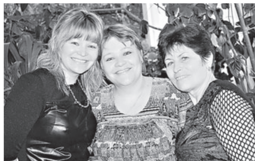
Передовые доярки довольны отдыхом и лечением.

Трудолюбивые доярки Алтайского края могут почувствовать себя настоящими королевами.