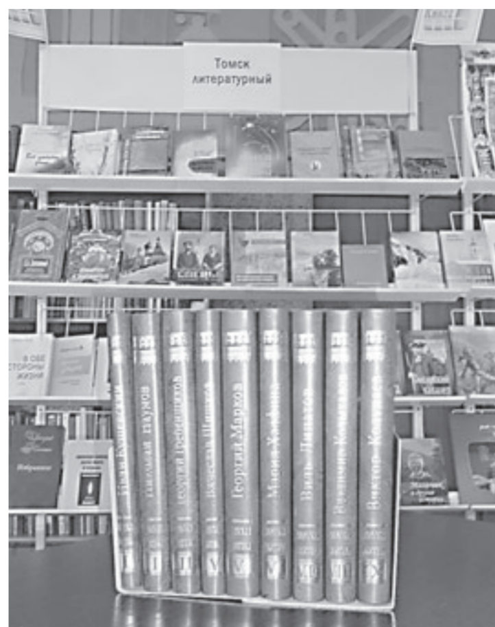
Дорогой подарок - девяти томный «Томская классика».