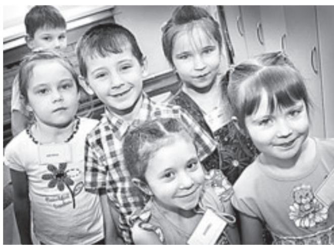
Барнаульский детский сад № 264 стал первым в конкурсе «Детский сад Алтай-2015».

Корреспонденты «АП» побывали на, пожалуй, самом важном конкурсном испытании – открытых занятиях. По условиям конкурса в незнакомой группе педагоги должны