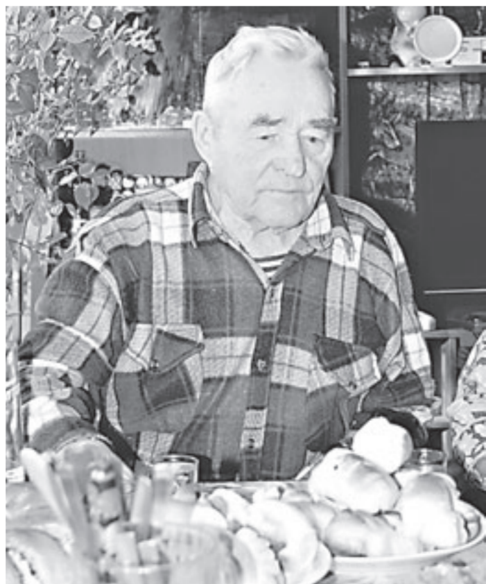
За праздничным столом. Есть что вспомнить...