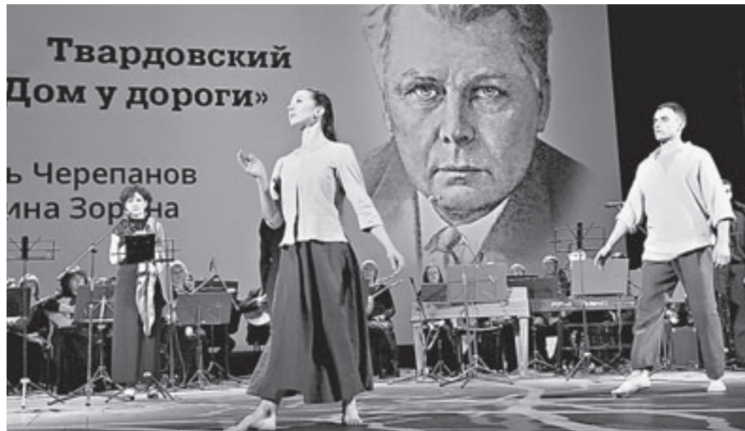
Звучали замечательные стихи А.Твардовского.

– Глубоко символично, – сказал он, – что в юбилейный год 70-летия Великой Победы первой в этой серии вышла в свет книга, посвященная солдату Победы – Алексею Скурлатову, нашему легендарному Алеше. Идет подготовка книги про Михаила Калашникова и Германа Титова. Все эти издания пронизаны глубокой идеей родства создателей и патриотов разных поколений, но объединенных горячей любовью к своей малой родине и всему Отечеству. И в этом случае представи-