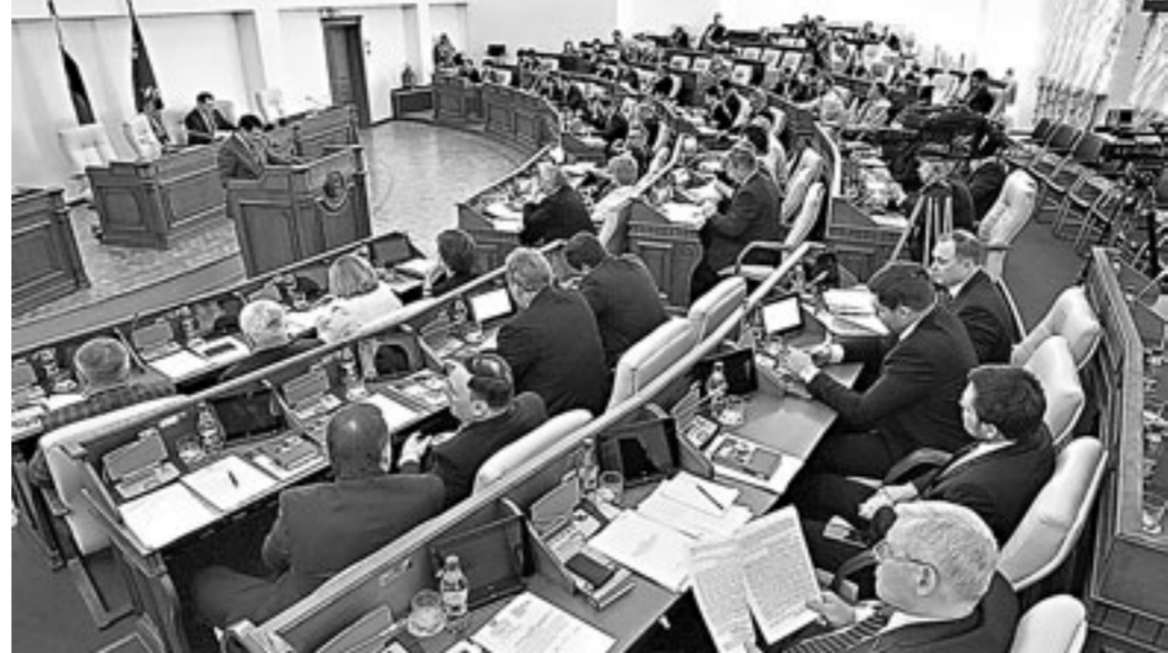
В этот день депутаты рассмотрели порядка 25 законопроектов и постановлений.