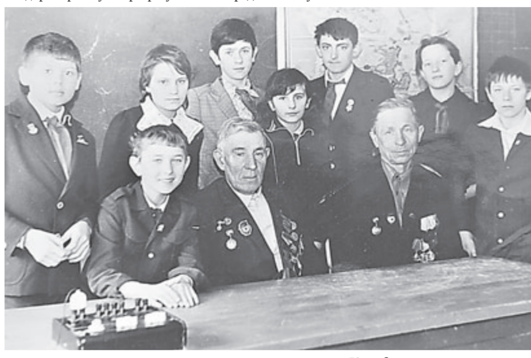
70-е годы – встреча со школьниками.