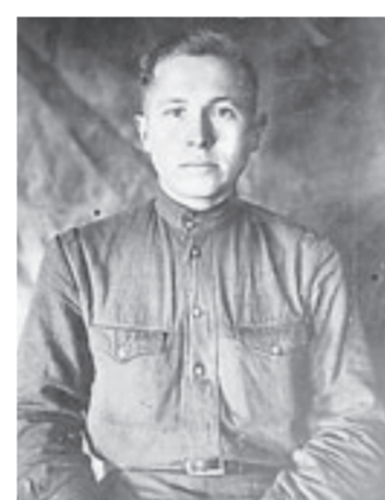
Фото 1946 года.

кабель и к утру обеспечить надежную связь с правым берегом. «Как это сделать – придумайте сами», – отрезал командир. Лед совсем тоненький, только-только установился, пространство вокруг простреливается румынскими стрелками. Сместившиеся