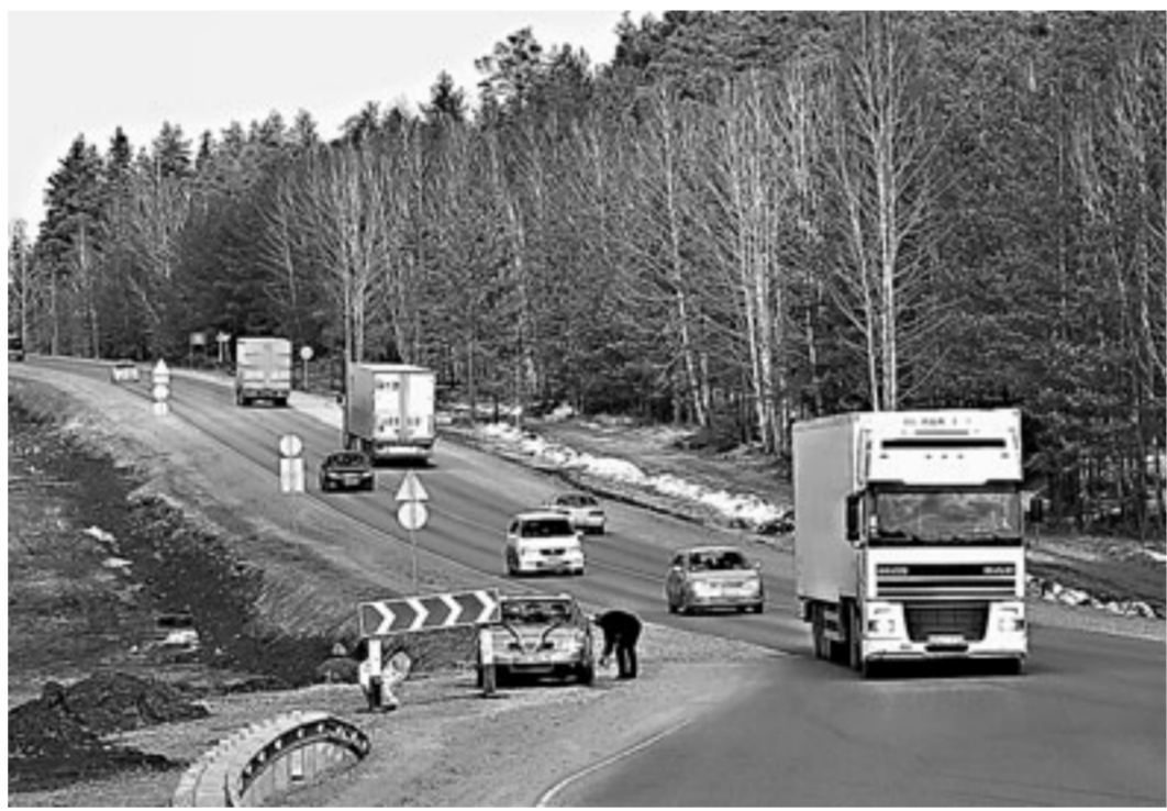
Реконструкция дорог – одна из важнейших забот краевых властей.

На этой неделе Александр Карлин обратился к председателю правительства страны Дмитрию Медведеву с просьбой о том, чтобы Министерство промышленности и торговли помогло региону в работе с торговыми сетями по реализации продукции молочного животноводства. Как известно, предприятия региона активно работают по импортозамещению продовольственной продукции. В прошлом году в Алтайском