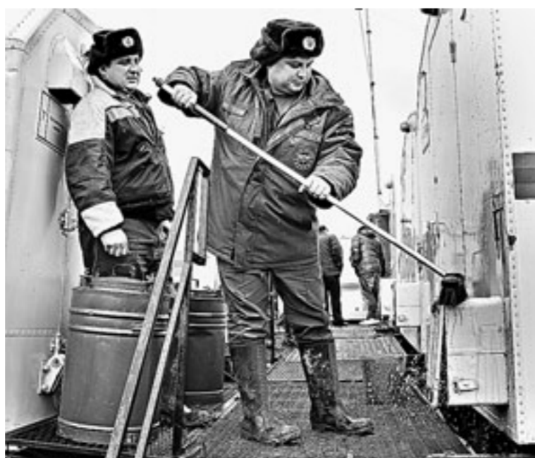
Пока одни приводят технику в порядок, другие устанавливают генераторы для света и тепла.