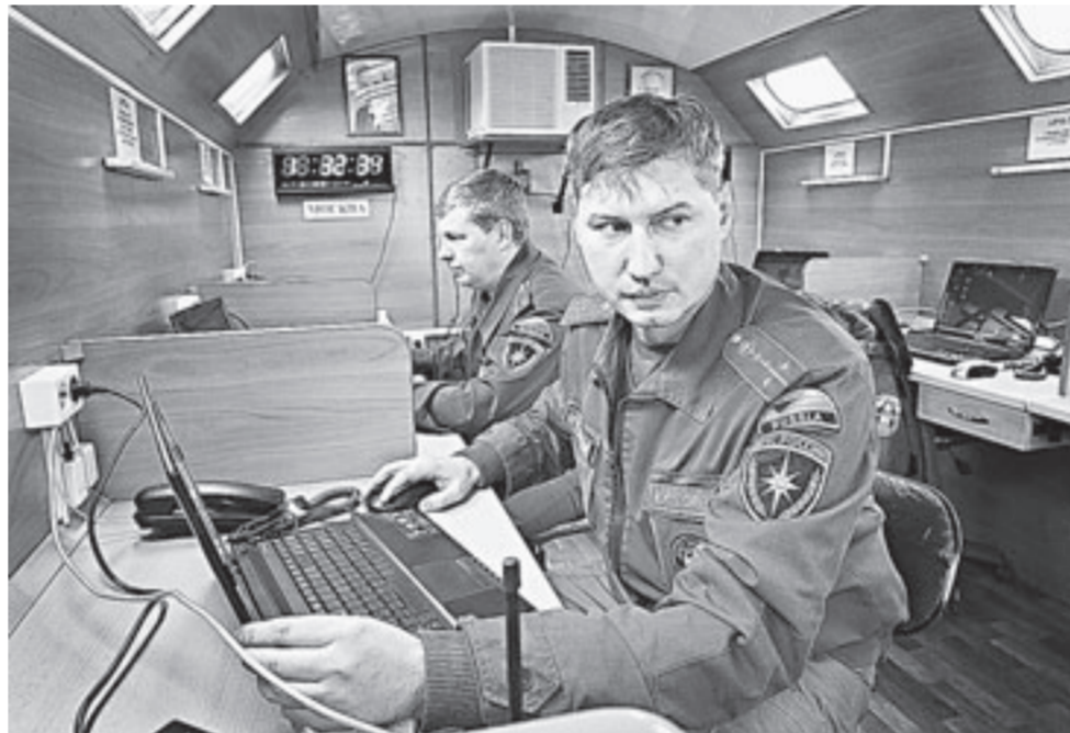
Специалисты компьютерного центра готовы к работе в режиме ЧС.