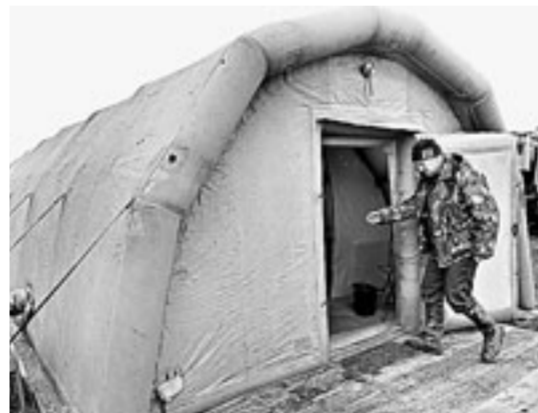
В таких палатках пострадавшие могут согреться.