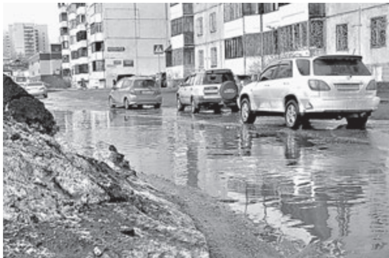
Так выглядели вчера многие улицы Барнаула.

Сначала «поплыли» дома в частном секторе Центрального района. В поселке Кирова и старой части города из-за образовавшихся огромных луж улицы стали непроходимыми и даже непроходимыми. Всю ночь на 25 марта на улицах Мамонтова и Правый берег пруда работали шесть помп, но они пока остаются малопроходимыми. Вчера до пяти часов утра аварийная бригада работала на Болотном проезде. Ночью вода подступила к домам жителей улицы Семипалатинской. По сообщению пресс-центра городской администрации, в ближайшее время подрядная организация приступит к пропарке труб и откачке воды на этой улице. «Территория микрорайона Кирова, улица Правый берег пруда, несколько улиц села Лебяжьего, поселка Бельмесово традиционно находятся в зоне подтопления грунтовыми и тальными водами. 10 аварийных бригад ведут работу в круглосуточном режиме», — заявили в горадминистрации. Наводнение на улицах и во