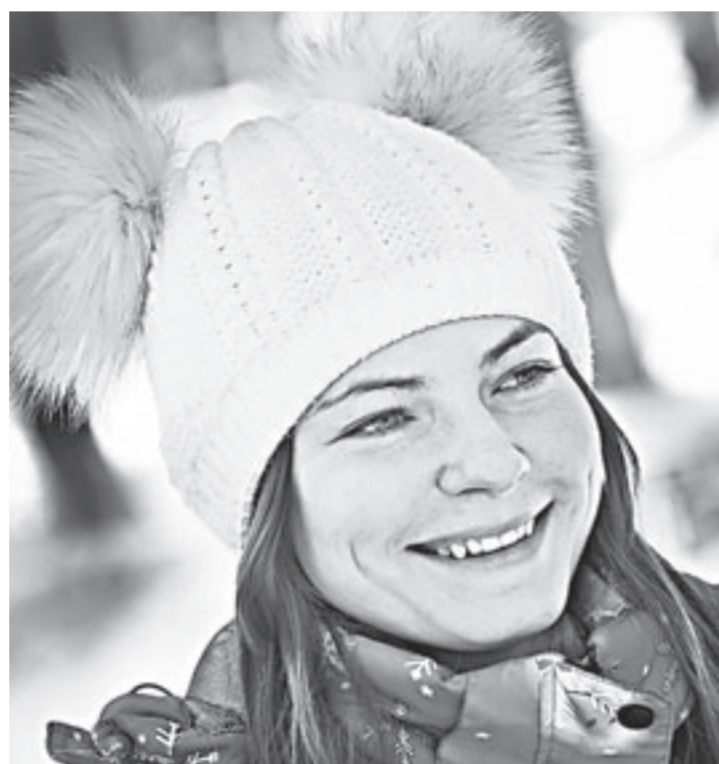
«Трассу здоровья» в этот день озарило море улыбок.

Лыжников было настолько много, что ведущий праздника и дело объявлял, что кто-то потерял. Некоторых родители только учили стоять на лыжах, кто-то прокатился с ветерком по лыжне вместе с собакой, а кто-то почти голышом. Многие лыжники проходили несколько кругов подряд,