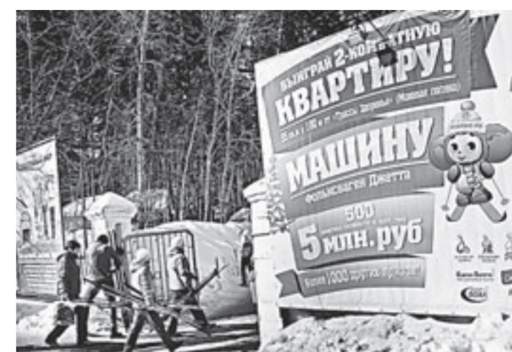
Кульминацией сезона стал розыгрыш главных призов – это квартиры и машины.

Людей, конечно, привлекло не только желание прокатиться по последнему мартовскому снегу, но и последний шанс поучаствовать в акции «За квартирой на лыжах», сбросив свои чеки на пятом километре