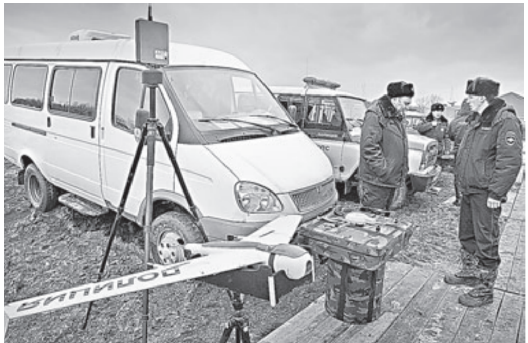
Беспилотники будут делать облеты подтопленных территорий.