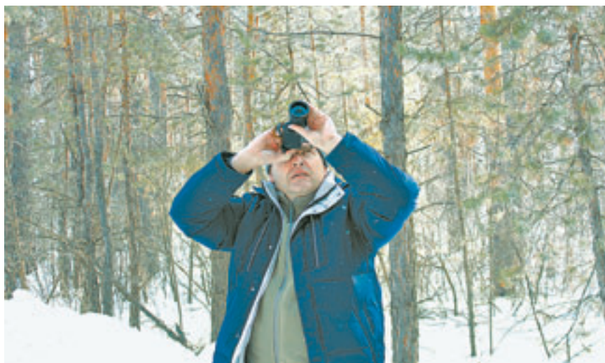
Куда поселить редкого жителя?

По мнению арендатора лесных участков, уникальность Завьяловско-