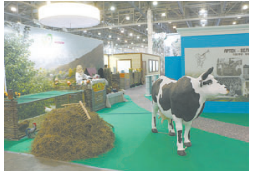
Для посетителей стенда создали атмосферу алтайского села.