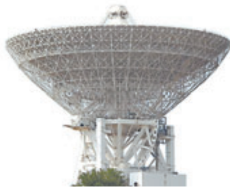
Радиолокационная космическая слежения – единственный действующий из восьми разграбленных украинцами.

ванием. Американцы об этом даже не догадывались. Когда Украина бросилась делиться с ними военными секретами, разработанными советскими учёными, и распахнула все двери, специалисты НАТО испытали в Балаклаве настоящий шок. Они не ожидали увидеть такой уровень технической оснащённости. Как распорядилась Украина доставшимся ей уни-