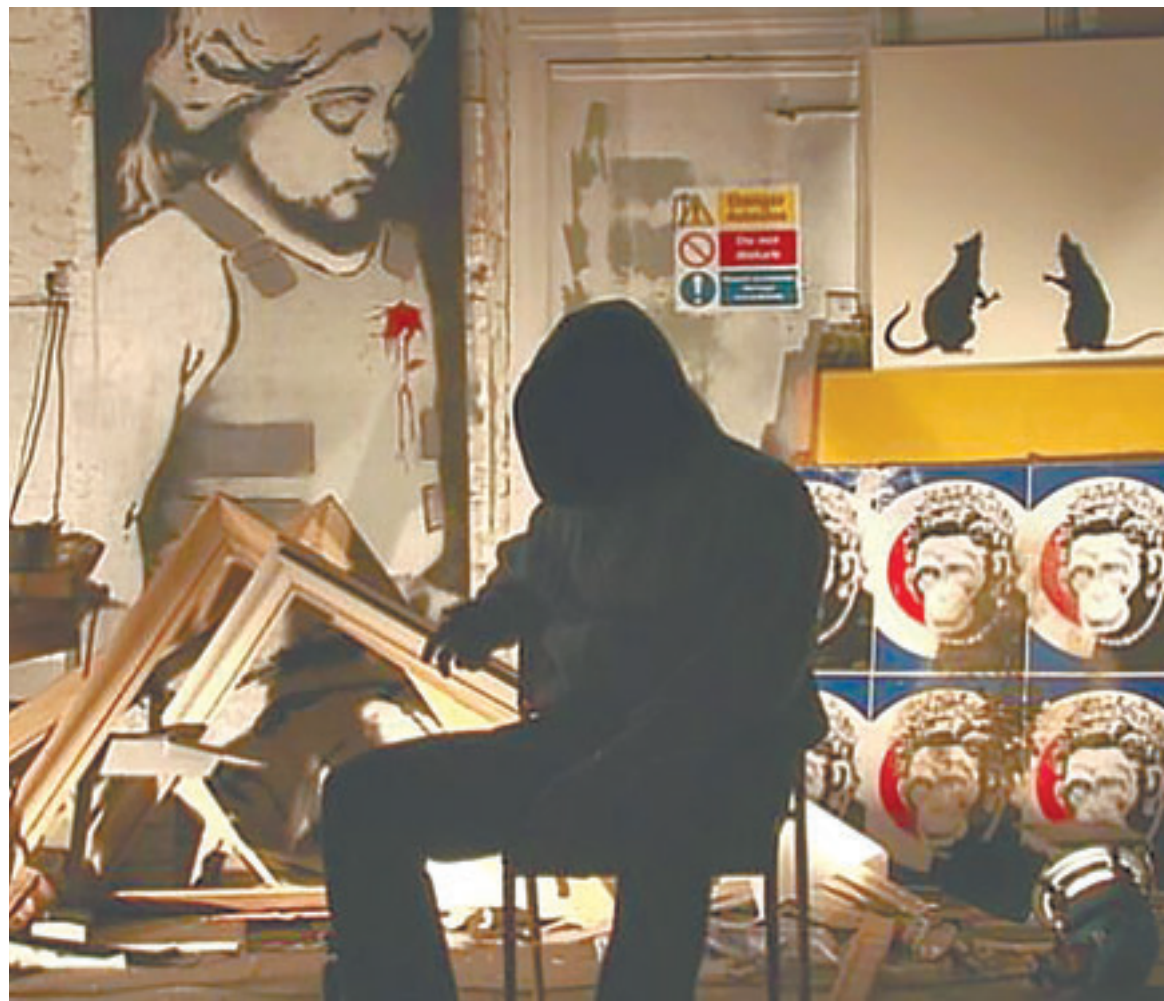
В своём фильме Бэнкси сохраняет инкогнито.

История чрезвычайно запутанная: это фильм Бэнкси о человеке, который хотел снять фильм о Бэнкси. Человека этого зовут Терри (или Тьерри) Гетта, он француз, давно живущий в Лос-Анджелесе, семьянин, многодетный отец. И настоящий маньяк видеокамеры. Зачем снимать фильм о Бэнкси, понятно: самый известный в мире андеграундный уличный художник, активист и мастер остроумного лаконичного граффити на социальные и политические темы уже много лет сохраняет инкогнито, и даже его настоящее имя известно лишь друзьям и спод-