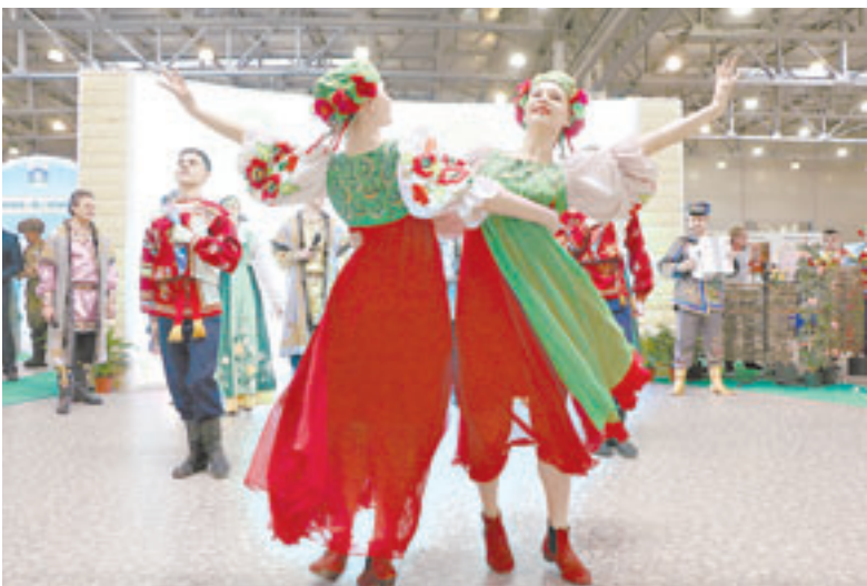
Развлекали гостей лучшие коллективы края.