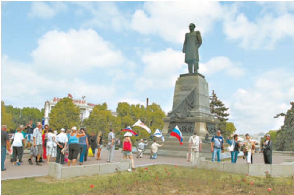
На площади им. адмирала Нахимова – главной в Севастополе – до референдума развевались российские флаги.

В окрестностях самой Евпатории на трех подобных площадках почти та же картина: из восьми телескопов действующих остаются один-два. Здесь обносился Национальный космический центр Украины. В нем арендует оборудование единственный оставшийся представитель российского НПО имени Лавочкина, ученый-баллистик, которому удалось кое-что