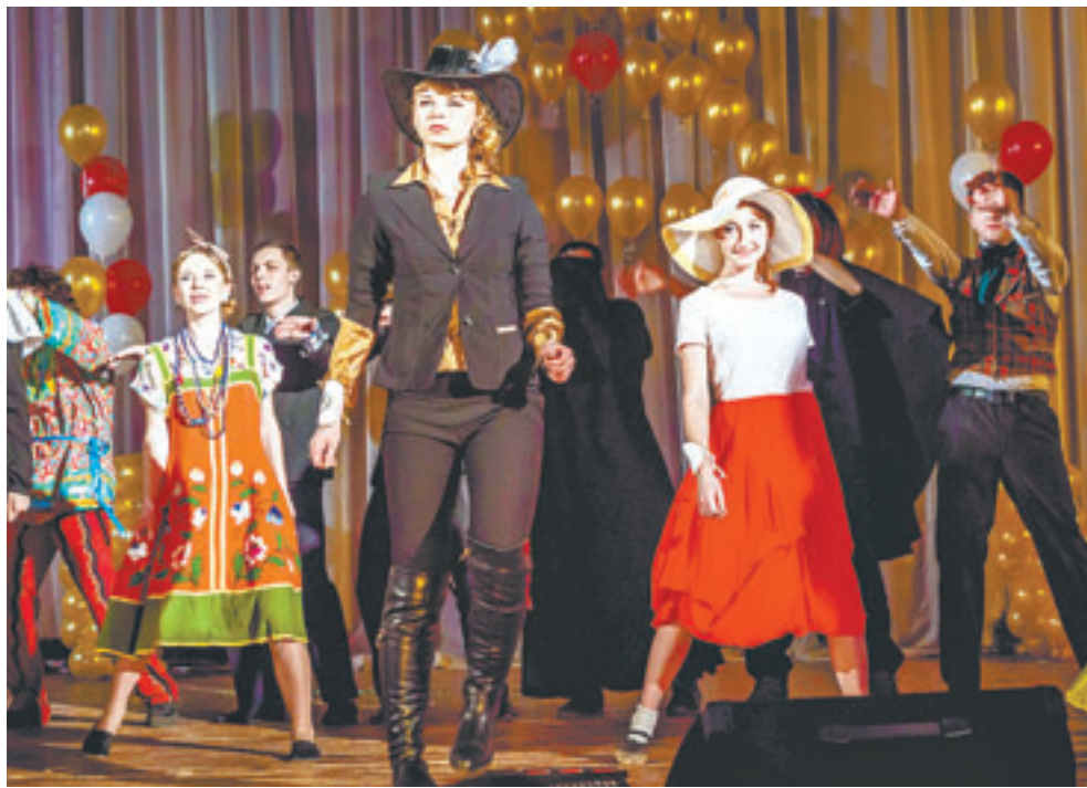
На главной сцене Алтайского государственного педагогического университета – самые креативные и яркие студенты.

В первом же испытании участники произвели фурор. Они перевоплощались в сказочных персонажей. Интересно, что образы меняли, выходя из обычного холодильника, который занял центральную часть сцены и служил проводником