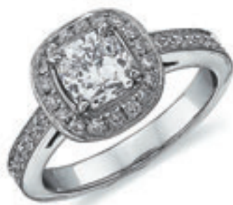
Этот «Кушон» – мечта любой девушки.

Барнаульский завод «Кристалл», дочернее предприятие компании «Алмазы России – Саха», освоил новую для себя технологию огранки бриллиантов формы «Кушон».