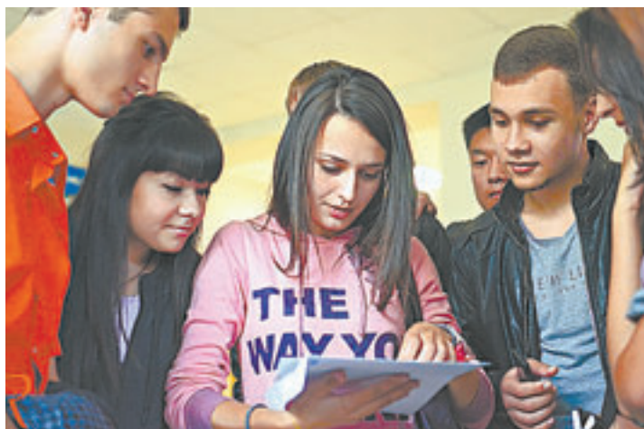
Квесты привлекают молодежь.

Сразу скажем, квест – не аналог программы «Умницы и умники». Кроме ребусов здесь большое значение имеют еще антураж, легенда, костюмы. Чаще всего схема такая: команда (от 2 до 10 человек) организаторы запирают в стилизованной комнате. Игроки получают легенду: они могут быть врачами, шпионами, гангстерами и т.д. Выйти наружу участники квеста могут, только если раз-