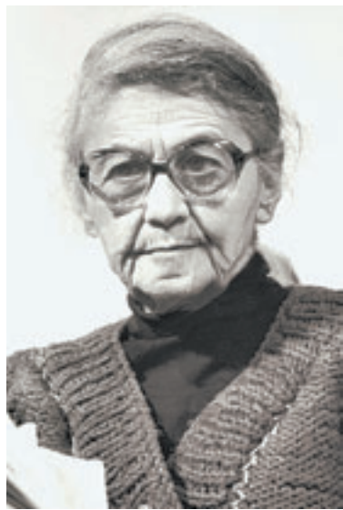
Анна Ларина – Бухарина.

Летом 1930 года 42-летний редактор «Правды» вырвался в отпуск, уехав на дачу в Гурзуфе. А по соседству, в правительственном доме отдыха в Мухалатке, отдыхала вместе со своим отцом 16-летняя Анна Ларина.