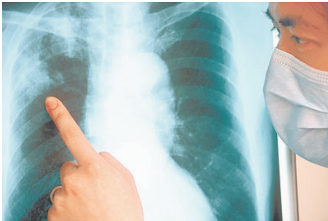
Раннее выявление туберкулеза и своевременное лечение позволяют полностью от него излечиться.

– Это тоже неверное мнение. Палочка Коха проникает в организм человека через слизистую, но это отнюдь не значит, что заражение может произойти только при тесном контакте, например, если есть с больным из одной посуды и пользоваться одними предметами гигиены. Возможен вариант заражения