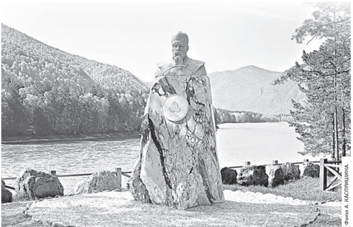
Памятник Николаю Рериху на «Бирюзовой Катуни» неизменно привлекает внимание туристов.