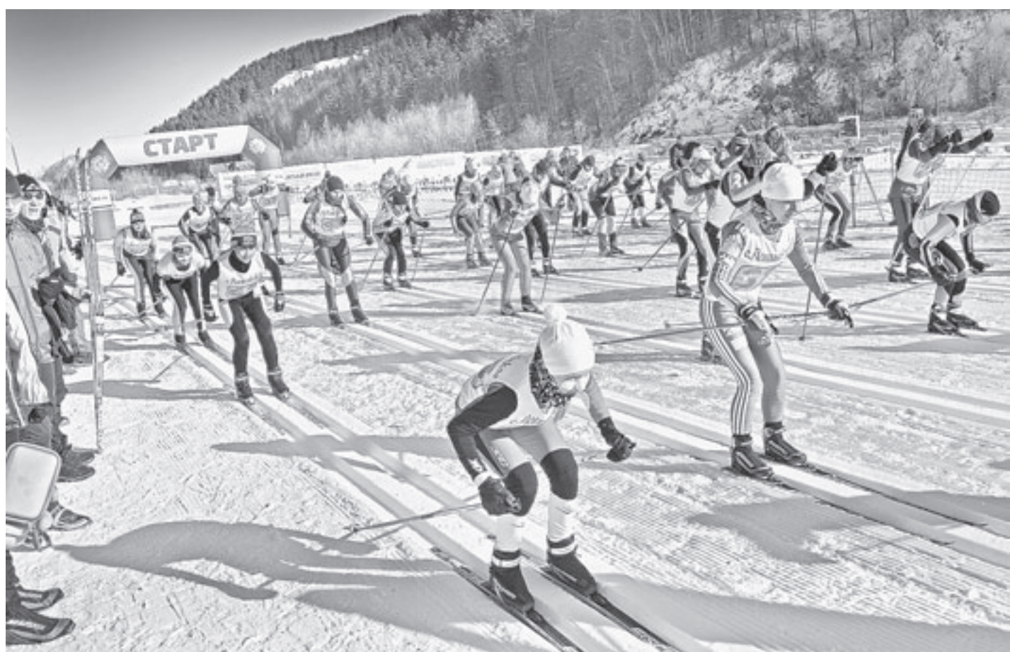
Дан старт. Лыжня идеальная, как и погода.