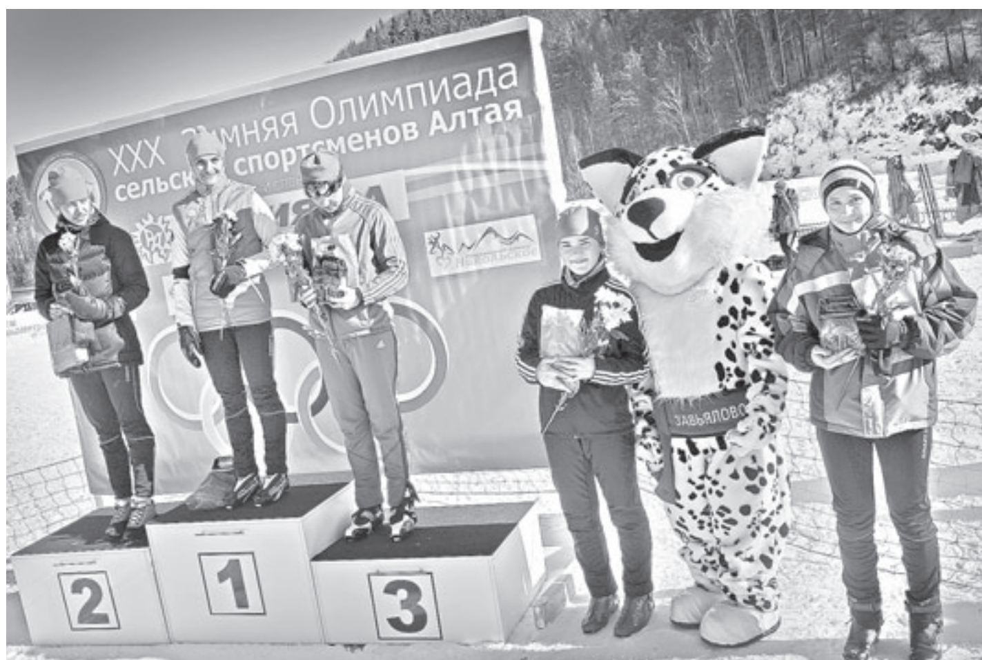
Впервые в истории сельских олимпиад провели «цветочную церемонию».