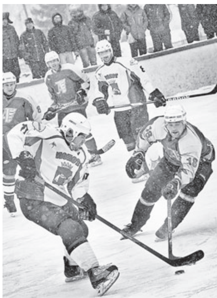
«Молот» в финале был неудержим.