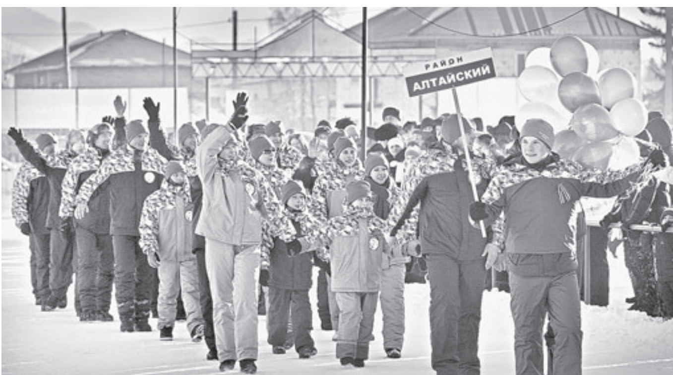
Хозяева подготовились к олимпиаде на славу.

XXX зимняя сельская олимпиада, в которой участвовали более семисот спортсменов со всех уголков края, завершилась в селе Павловском. Завершилась триумфально для Павловского района, завоевавшего главный трофей соревнований. Большинство участников, с кем удалось пообщаться, отметили, что это была лучшая олимпиада за всю историю ее проведения.