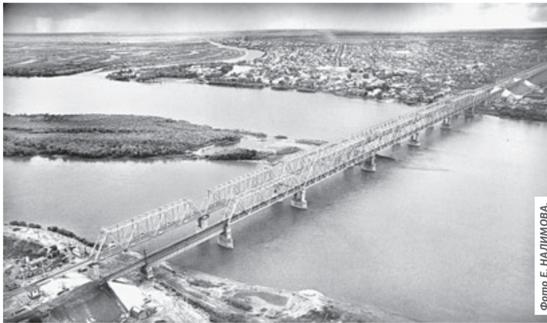
Город Камень-на-Оби и Каменский район, возмозно, скоро станут одним целым.

– Основным мотивом, который поставил вопрос ребром, стали наблюдаемые на протяжении ряда лет неудовлетворительные экономические показатели обеих территорий, у Каменского района – среди муниципальных районов, у