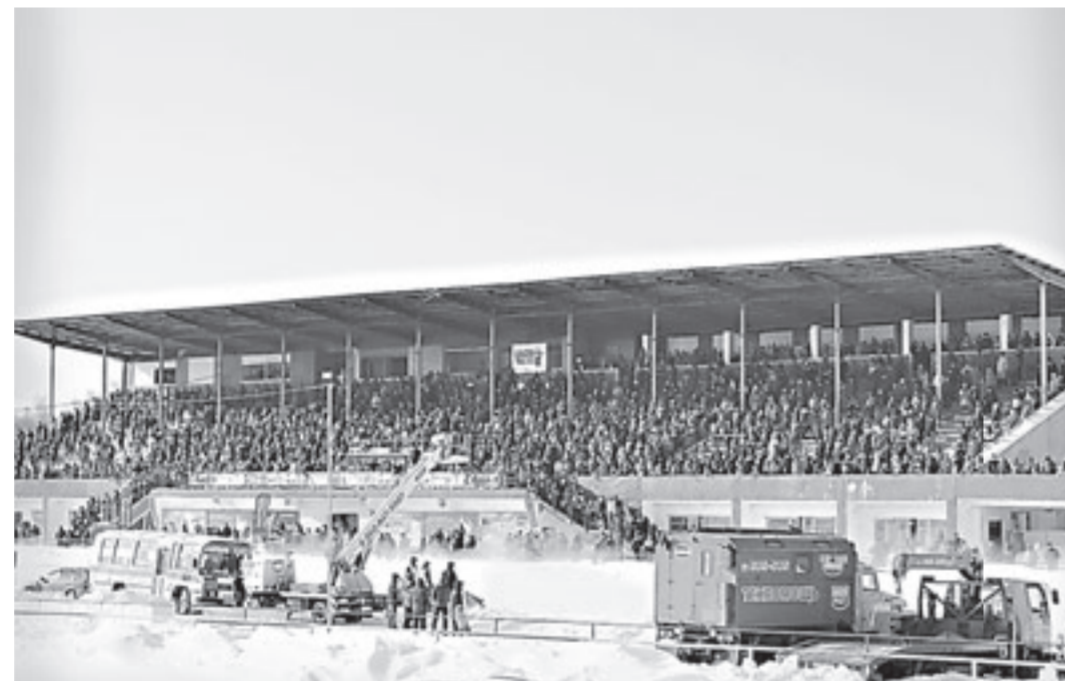
Барнаульцы явно соскучились по такому зрелищу – на трибунах яблоку негде было упасть.

22 февраля в Барнауле состоялся 5 этап Кубка Урала, Сибири и Республики Казахстан по зимним трекovým гонкам, организаторами которого выступили Алтайская федерация автомобильного спорта (АФАС), Барнаульский пивоваренный завод и Краевое управление по физической культуре и спорту.