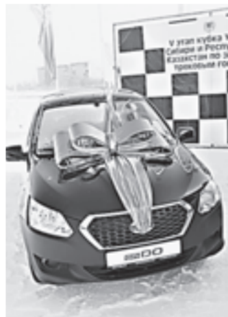
Главный приз уехал в Курган.

вроде катка – по такому развее что ездить со скоростью 60 километров, да и то осторожно. Но гонщики на нешипованной резине по прямой развивали скорость за сто километров, а на виражах боками пропихивали высоченные снежные бугры.