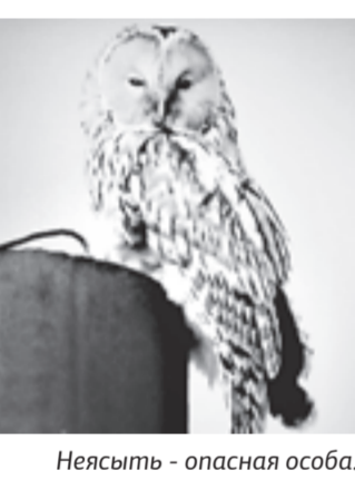
Неясыть - опасная особа.

Длиннохвостая неясыть, представительница семейства сов, обитающая в алтайских лесах, неожиданно попала в кадр местных работников лесного хозяйства.