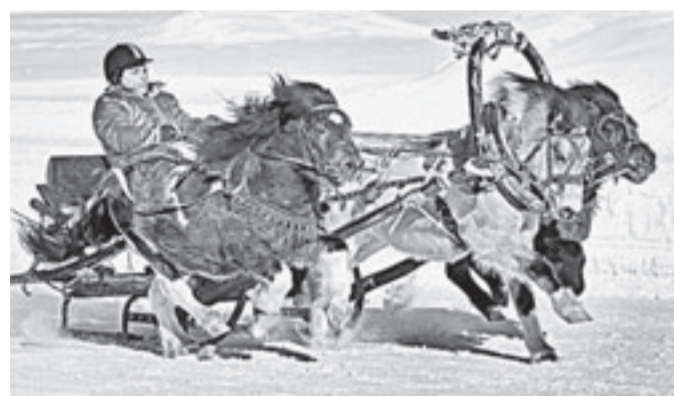
Ни один праздник в «Сибирском подворье» не обходится без конных бегов.

Гости проводов зимы в Новотырышкино съели 25 тысяч блинов, две тонны каши, выпили 450 литров медуухи, попробовали уникальные ульмени, сделали несколько миллионов замечательных фотографий.