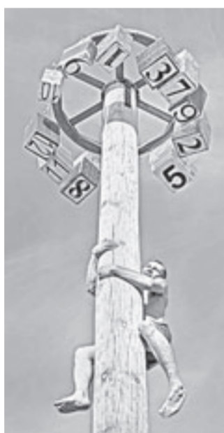
Приз в студии!

А вдоль дороги чучела стоят. Стоило ли преодолевать столько километров? Во-первых, в мастерстве и таланти-