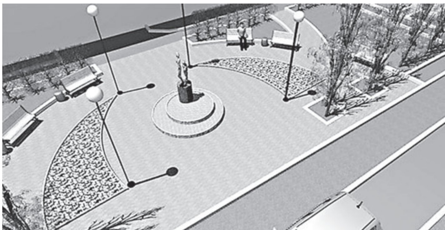
Монумент мемориального сквера «Непокорённые» в Рубцовске.

Александр Карлин заметил, что «в 2014 году в крае были проведены все запланиро-