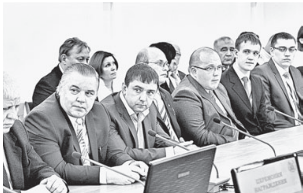
Инноваторы ждут своих наград.