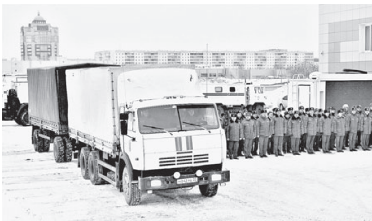
«Гуманитарка» готова отправиться в путь.