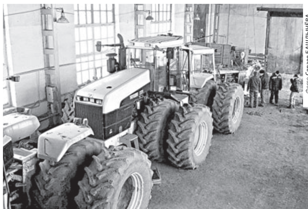
В хозяйствах края полным ходом идет ремонт сельхозтехники.

Наша специализация активно сотрудничает с профильными федеральными министерствами. Прорабатываются детали программ, которая будет направлена на снижение на-