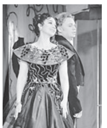
Театр музкомедии. «Марица».

6 февраля. 18.30 – «Сон в летнюю ночь» (12+). 7 февраля. 17.30 – «Я пришел дать вам волю» (12+). 8 февраля. 17.30 – «Чума на оба ваши дома!» (12+). 11 февраля. 18.30 – «Дорогие мои бандитки» (16+).