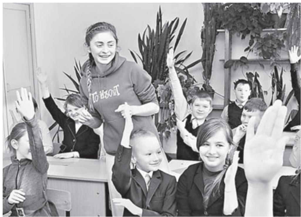
Младшеклассники отвечают на вопросы бойцов «Снежного десанта».

за то, что помогли подняться своим настроением и, конечно, вниманием.