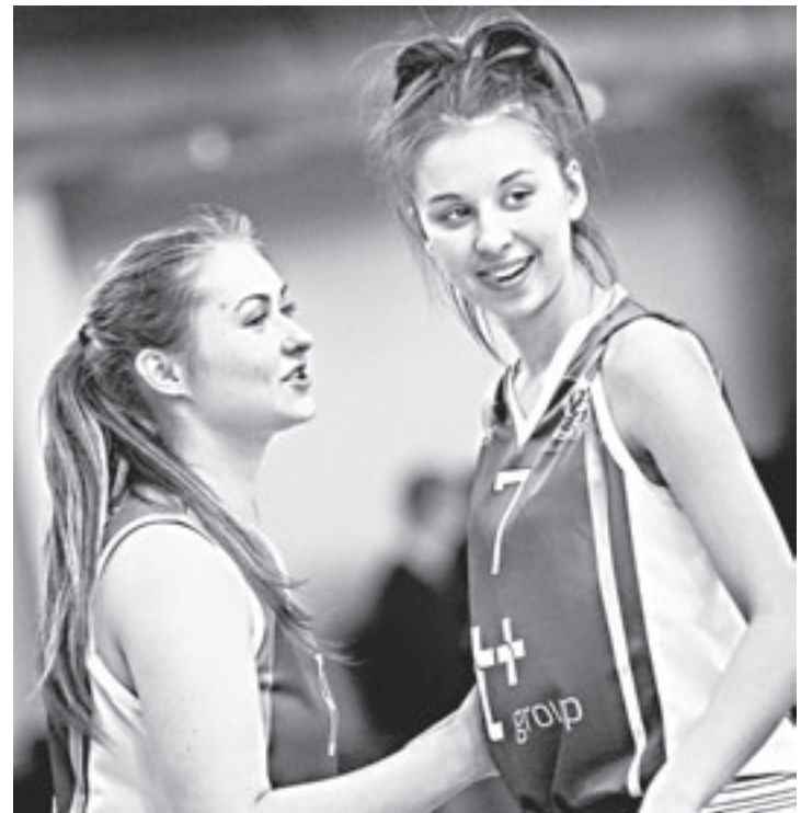
Девочки из Мирненской средней школы - финалистки турнира.

Со 2 по 4 февраля путевку в финал Урало-Сибирской конференции оспаривали восемь юношеских и восемь девичьих команд из Барнаула, Рубцовска, Бийска, Камня-на-Оби, Романовского, Бурлинского,