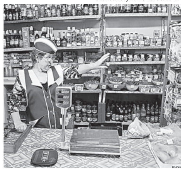
На повестке дня сегодня – цены на продукты.

На семинаре-совещании в правительстве страны также шел разговор и о лекарственном обеспечении населения. Губернатор края потребовал осуществлять строгий контроль за положением дел в аптечной сети, обеспечением учреждений здравоохранения лекарственными средствами. «Мы должны следить за тем, чтобы весь набор необходимых лекарственных средств и препаратов находился в больницах и клиниках Алтайского края», – подчеркнул Александр Карлин. По его словам, в крае специалисты еще раз должны изучить возможности