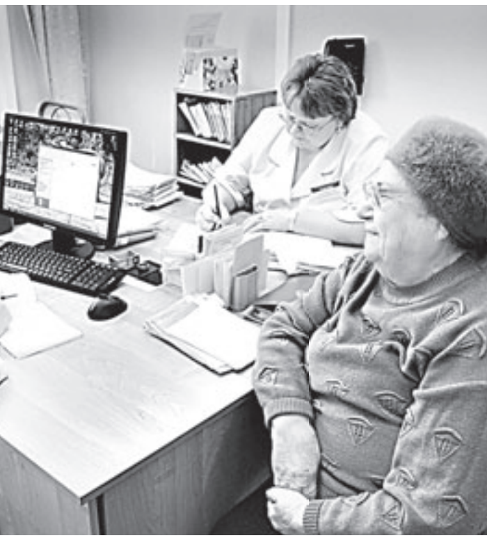
В «Надежде» онкологические заболевания выявляют на самых ранних стадиях.

Впервые обратившись граждане сдают анализ, по которому определяется индивидуальная степень риска развития онкопатологии. Она может составлять от 10 до 100 процентов. При показателях от 80 процентов и выше проводятся более углубленные исследования, по результатам которых и принимается решение об индивидуальной