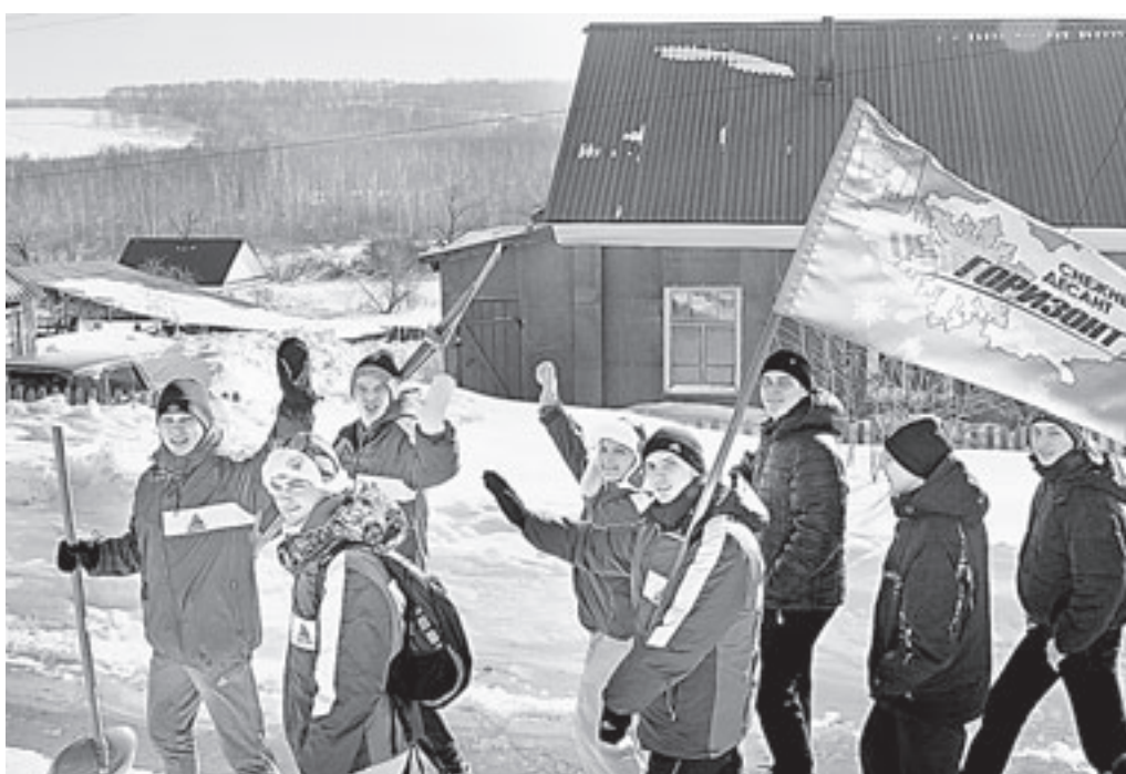
В Ельцовке студенты оказали шефскую помощь местным жителям.

автобусе в Ельцовку, что в двадцати километрах от райцентра. В селе проживает порядка восьмисот человек. Здесь добротная