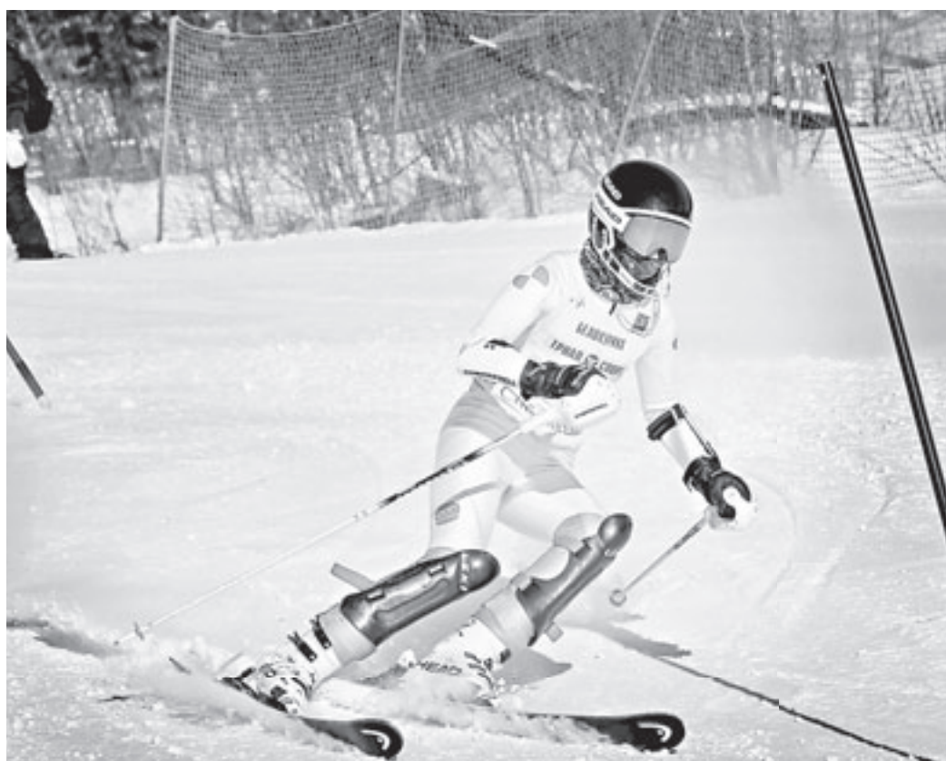
Борьбу за Кубок губернатора вели сто спортсменов со всей страны.