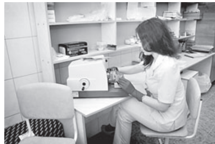
В «Надежде» онкологические заболевания выявляют на самых ранних стадиях.

каказаниями каждого пациента. И хотя ежегодно в Алтайском крае регистрируется более 10 тысяч новых онкопациентов, в целом ситуация меняется в лучшую сторону. В регионе на 2 процента снизилась выявляемость рака на поздних стадиях и увеличилась выявляемость болезни на первой и второй стадиях, когда она еще поддается успешному лечению. Стабилизировались и показатели по смертности от этой патологии. Например, меньше стало умирать граждан трудоспособного возраста. Стабильно продолжает расти и пятилетняя выживаемость, среди онкобольных. В настоящее время она достигает 60 процентов (три года назад было всего 40 %). И в этом немалая заслуга специалистов «Надежды». А пациенты благодарны им за спасенные и продленные жизни.