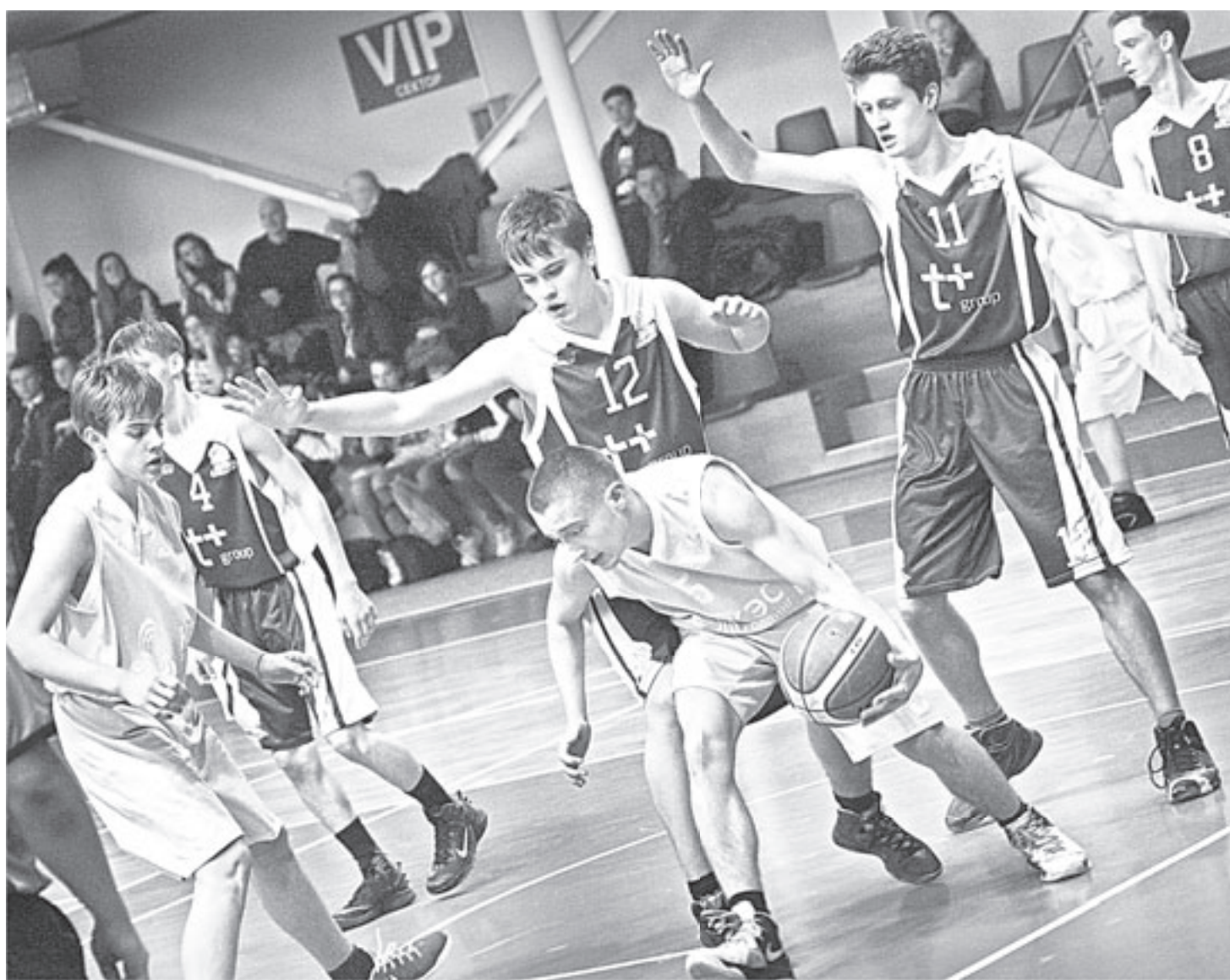
Все игры получились на загляденье!

Открытием турнира стали юноши из Романово, которые