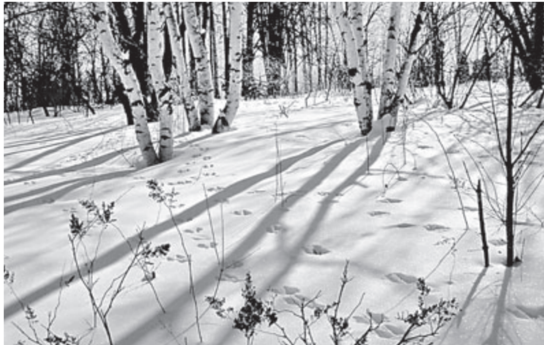
Чьи следы на снегу? Их сегодня считают, чтобы знать, кто населит природу края.

А теперь мы в заказнике «Мамонтовский». Спросим про озеро Гусиное? В начале 90-х годов, пока не была открыта