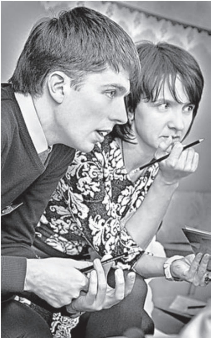
Конкурсное жюри замечает и находки, и недочеты.

На этой неделе в Барнауле состоялся краевой конкурс «Педагогический дебют-2015», в котором участвовали учителя со стажем работы в школе не более трех лет. Корреспонденты «АП» побывали на открытых уроках молодых педагогов и выяснили, в чем смысл этого соревнования, а затем поздравили победительницу.