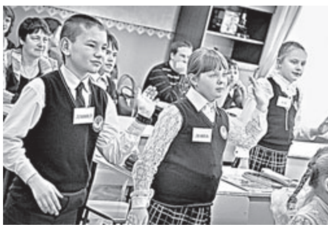
Небольшая разминка на уроке – чтобы учиться с новыми силами.

не только задавали каверзные вопросы, но и давали ценные методические рекомендации.