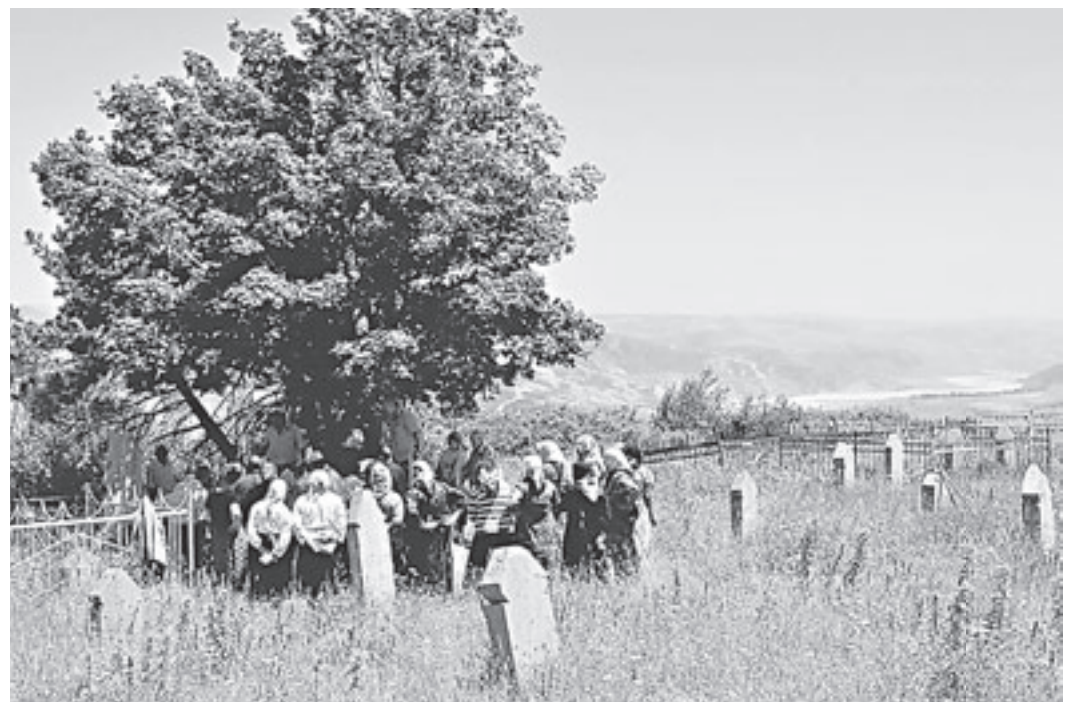
Чтобы наладить контакт с духами, на кладбище нужно провести обряд.

людей в Михайловском, Волчихинском районах и Рубцовске. Перед поездкой в обязательном порядке обкуривали салон травами, отчего некоторые пассажиры впадали в транс. Пересекая границу, останавливались на кладбищах, где проводили ритуальные обряды и произносили заклинания на казахском языке. Никто толком не понимал, что означают молитвы, но все повторяли за «гуру». Некоторые записывали на телефон.