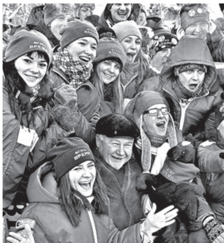
Акция «Снежный десант» открыта!

Вчера, 30 января, бойцы «Снежного десанта» отправились из Барнаула в 19 районов края с важной миссией – оказать помощь ветеранам и труженикам тыла.