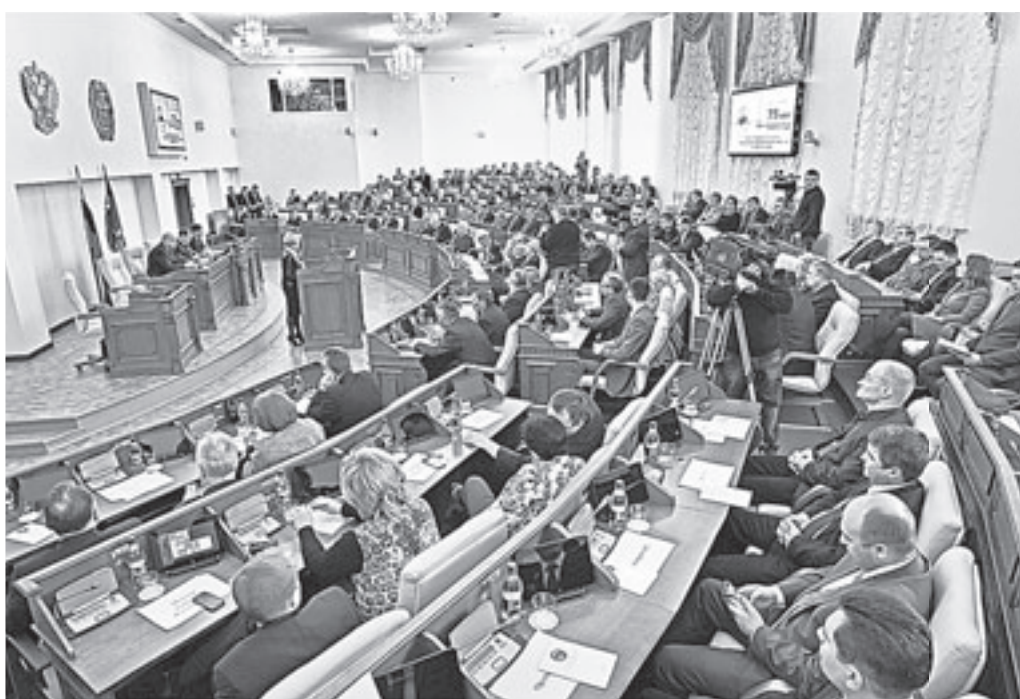
В зале заседаний собрались депутаты нынешнего и прошлых созывов, представители края в Федеральном собрании, ветераны аппарата, почетные жители региона.

– Трудно переоценить роль высшего законодательного органа государственной власти в развитии региона.