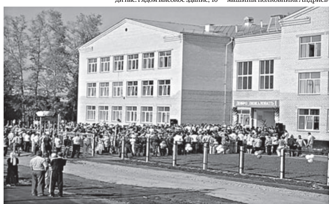
Открытие школы имени Героя России Дмитрия Ерофеева.