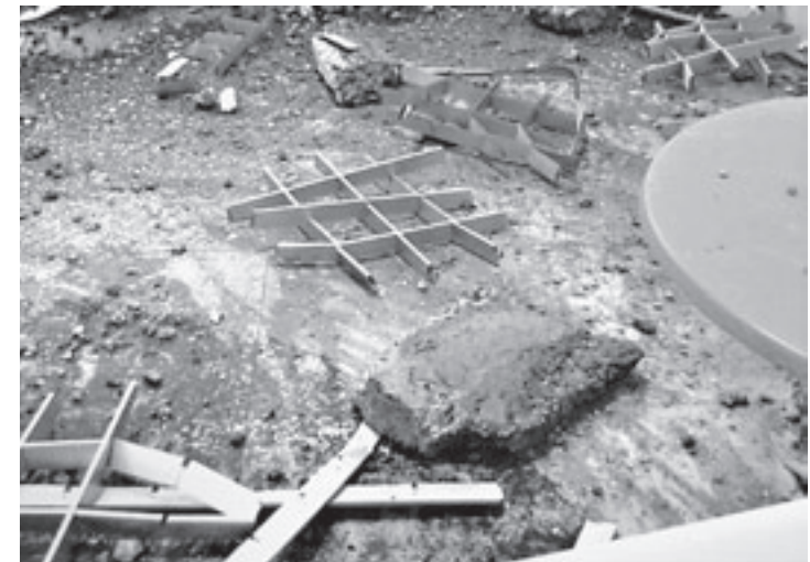
Этот кусок бетона мог упасть и на голову посетителям кафе.

В Рубцовске в среду в торгово-развлекательном центре «Радуга» частично обвалился потолок, по счастливой случайности никто не пострадал.