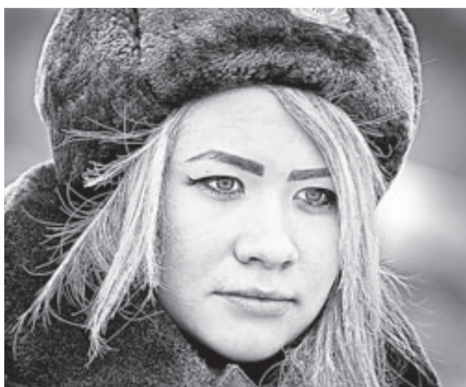
Для молодых ветераны – живая память и лучшие учителя.

его еще можно спасти. Нет рефлекса – все. У меня, кроме маминной маленькой фотокарточки, которую дали из архива, нет ничего, что бы напоминало о родном доме. Мы потеряли свою родину. Я