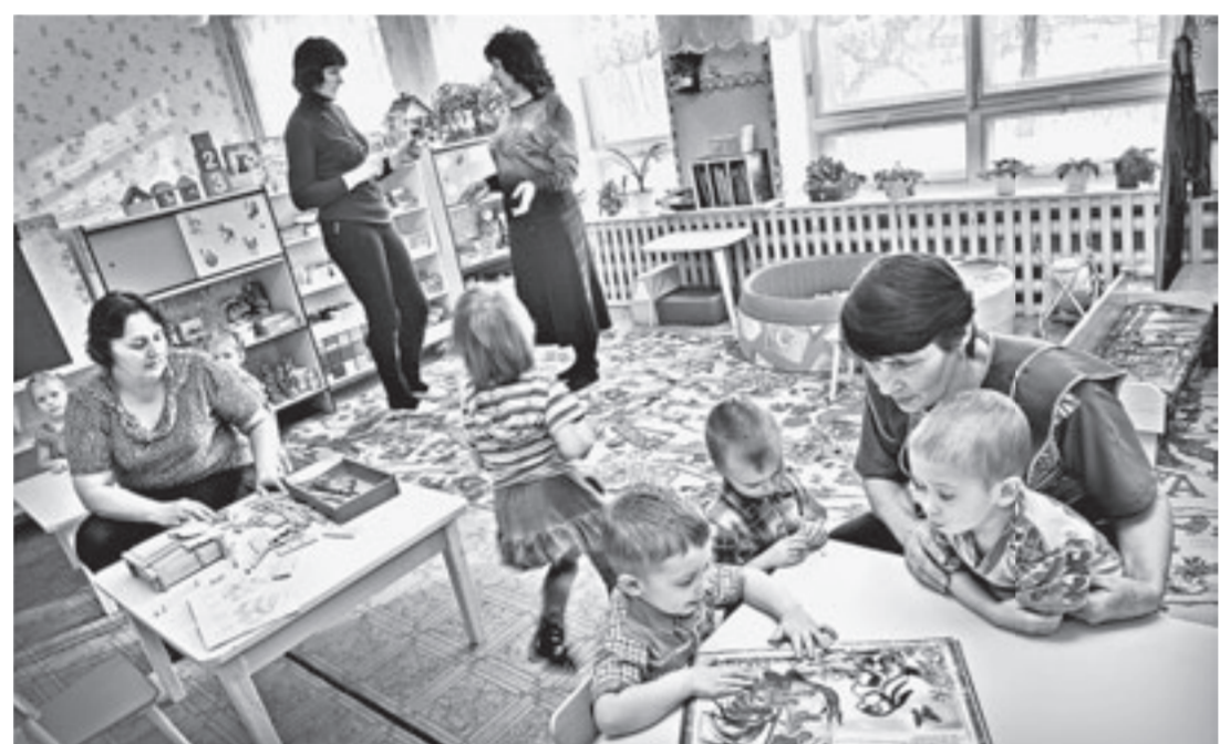
В детском саду – тепло и уютно.

абсолютно не страшен. Запас угля есть, да и уже очень он хороший в этом году. Температуру в детском саду держим на отметке 23-25 градусов.