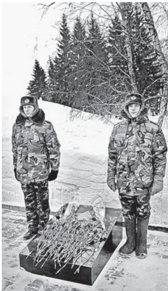
В почетном карауле стояли ученики барнаульской школы № 37.

Вчера, 27 января, в Барнауле в память о 71-й годовщине снятия блокады Ленинграда к мемориалу на площади Победы были возложены цветы.