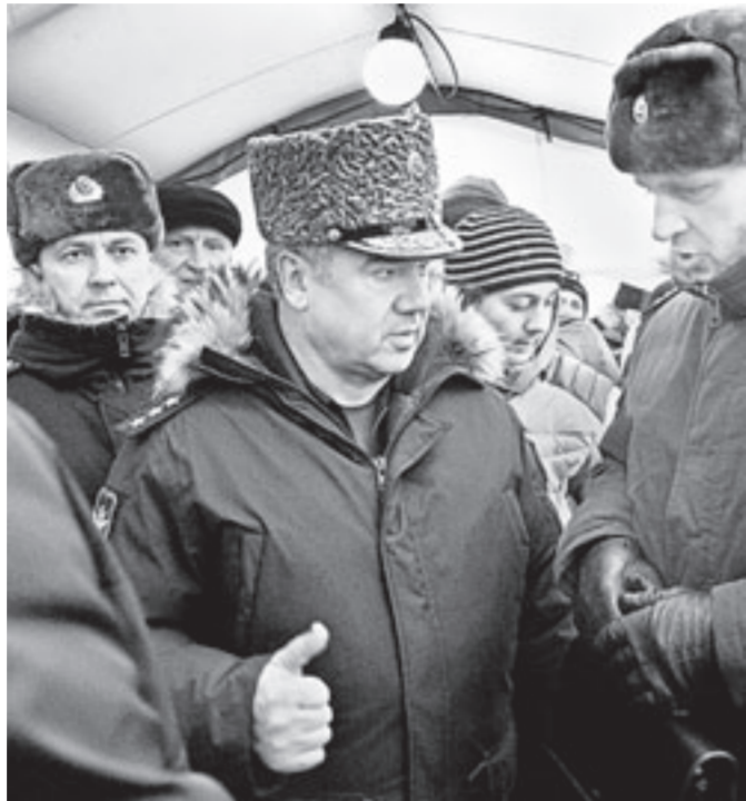
Главком ВВС Виктор Бондарев начал военную карьеру на Алтае.

Главком ВВС пригласил выпускников поступать в лётные училища и их филиалы в Воронеже, Сызрани, Краснодаре и Челябинске. По его словам, сейчас у военнослужащих достойный социальный пакет, хорошее материальное обеспечение и денежное довольствие. Скоро на вооружение авиачастей поступят самолёты пятого поколения – перспективный авиационный комплекс дальней авиации и другие авиановинки. А для первоначальной подготовки курсантов аэроклубов и лётных училищ – Як-152, который может взлетать и приземляться с грунтовых аэродромов. Ребята встретили эти слова