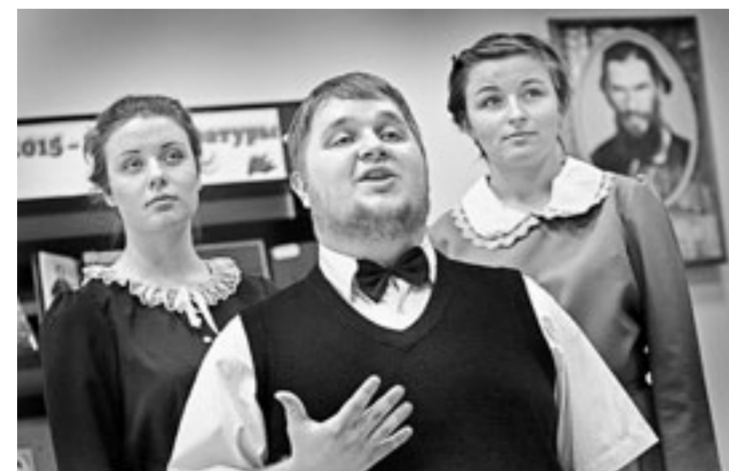
Бессмертно пушкинское слово...

это будет объединять, делать крепкими наши семьи, крепить наше Отечество.