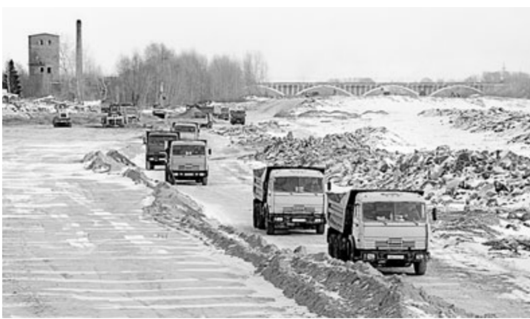
Грунт возят круглосуточно.

ни на одном объекте. Прошлым летом по территории Алтайского края прокатился поток, которого никто никогда здесь не видел. И невозможно применить к здешней ситуации опыт Крымска, пострадавшего от селей, или Приамурья. У Би сложней характер, требующий специальных технологий. Мощная насыпь из песчаных и суглинистых грунтов, крепление верхнего откоса дамбы каменной наброской, укладка геотекстиля, устройство упорной призмы из дренажного банкета, послонное уплотнение «пирога» обеспечат высокую надежность сооружения и его защиту от размыва. Мы работаем по самым высоким требованиям, предъявляемым к гидрозасщитным сооружениям. Это было профессиональное решение, к