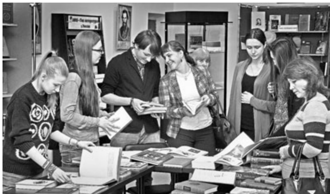
«Золотой век» русской литературы вовсе не был скучным.

и Драйзера, и Мопассана. Но воспринимали мы это тогда как чужую картинку, чужую жизнь. Зато Толстой и Пушкин писали про наших предков. Мне думается, что Год литературы должен вернуть из забытия именно отечественных писателей. Книжная выставка, которую я здесь увидела, заставила меня сожалеть: жизнь уже к закату спешит, а сколько еще нечитаного! И одного года, конечно, не хватит... Поэтому давайте делать то, что мы давно не делали в семьях: начиная с первого года жизни читать вечерами отечественную литературу своим детям вслух. И