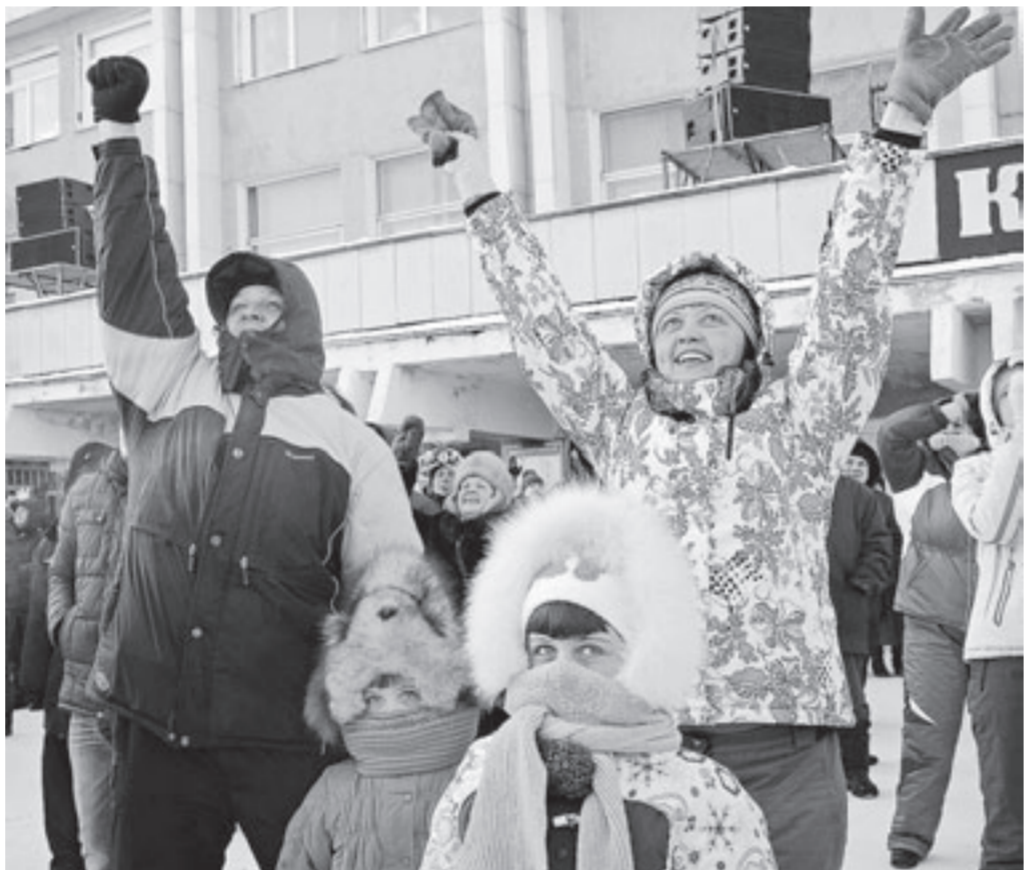
Смотреть авиашоу ходили семьями.