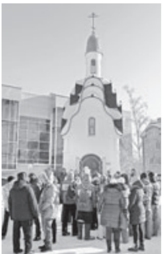
Традиционный молебен у часовни Святой Татианы.

– Не стоит полагаться на удачу, выбирать лёгкие билеты. В первую очередь вы должны получать знания в учебных заведениях, фор-