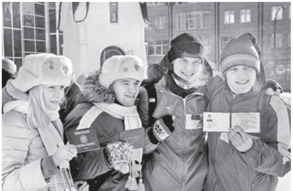
Студенты принесли на праздник зачётки, чтобы окропить их святой водой.

– Сессия в разгаре, а сил всё меньше, поэтому решила прийти и зарядиться положительной энергией. Думаю, что после тройного