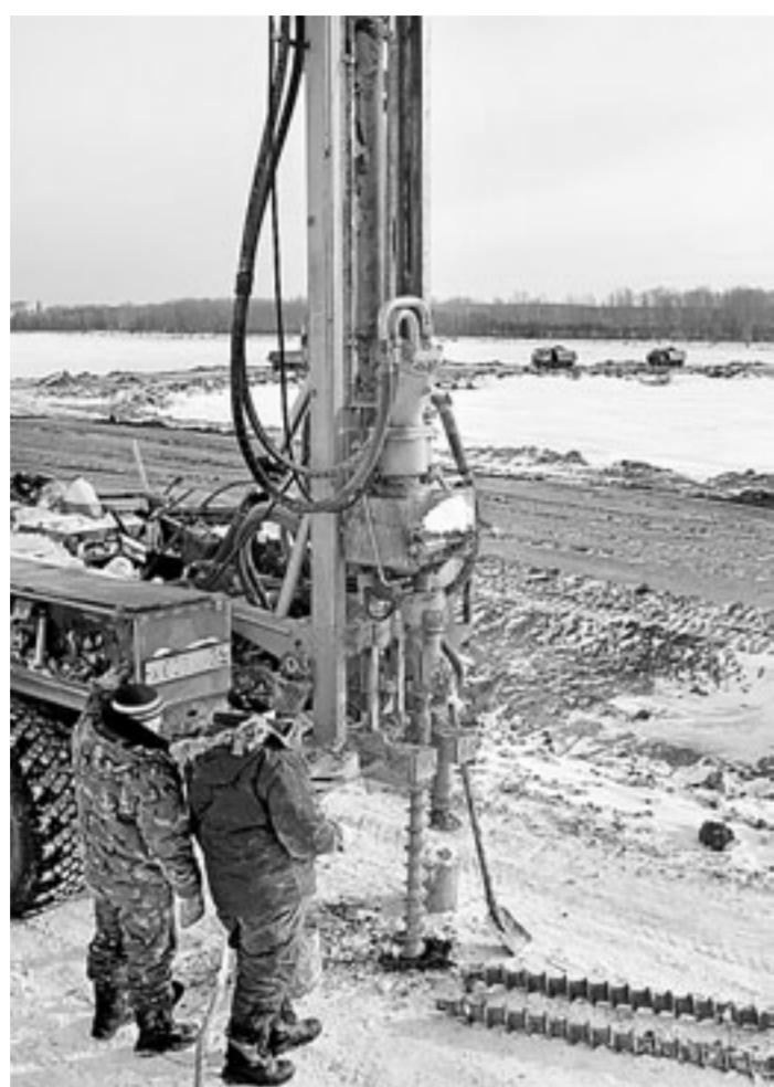
На строительстве дамбы работает тяжелая техника.