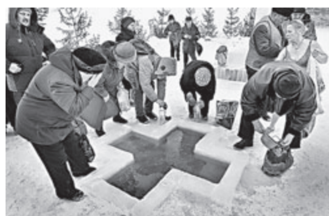
Из иордани люди берут святую воду.

него падают солнечные лучи, то вся площадка освещается удивительным сиянием. И это придает обряду крещения особое настроение.