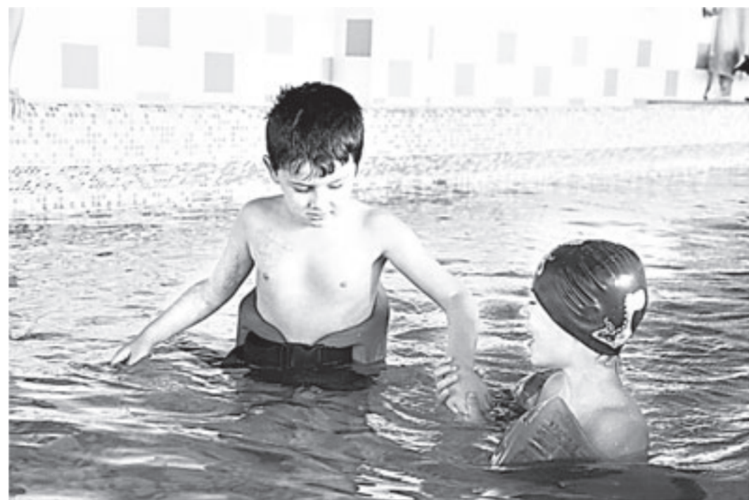
«Руку дружки протяни»

Она — замечательный человек, никто так, как она, детьми-аутистами прежде не занимался. Различные образовательные мероприятия, занятия с психологами были и