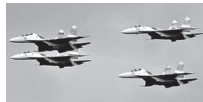
Пилотажная группа «Соколы России».

24 января в Барнауле пройдёт масштабная информационно-агитационная акция под названием «Служба по контракту в Вооружённых силах Российской Федерации – твой выбор!»