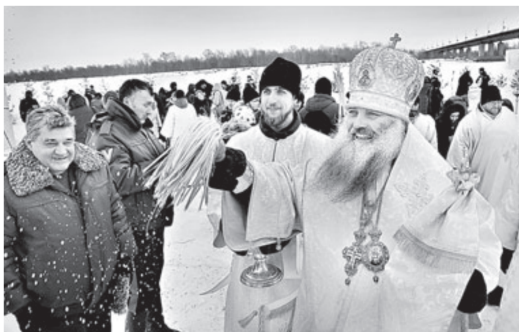
Епископ Барнаульский и Алтайский Сергей совершил на Оби обряд водосвятия.

снежная часовня, рядом ставят переносные баньки, но самое главное происходит на льду. Здесь вырубают большую купель, чтобы можно было безопасно купаться, и иордань – прорубь в виде креста, откуда верующие черпают воду. В центре крещенского городка большое ледяное распятие. Когда на