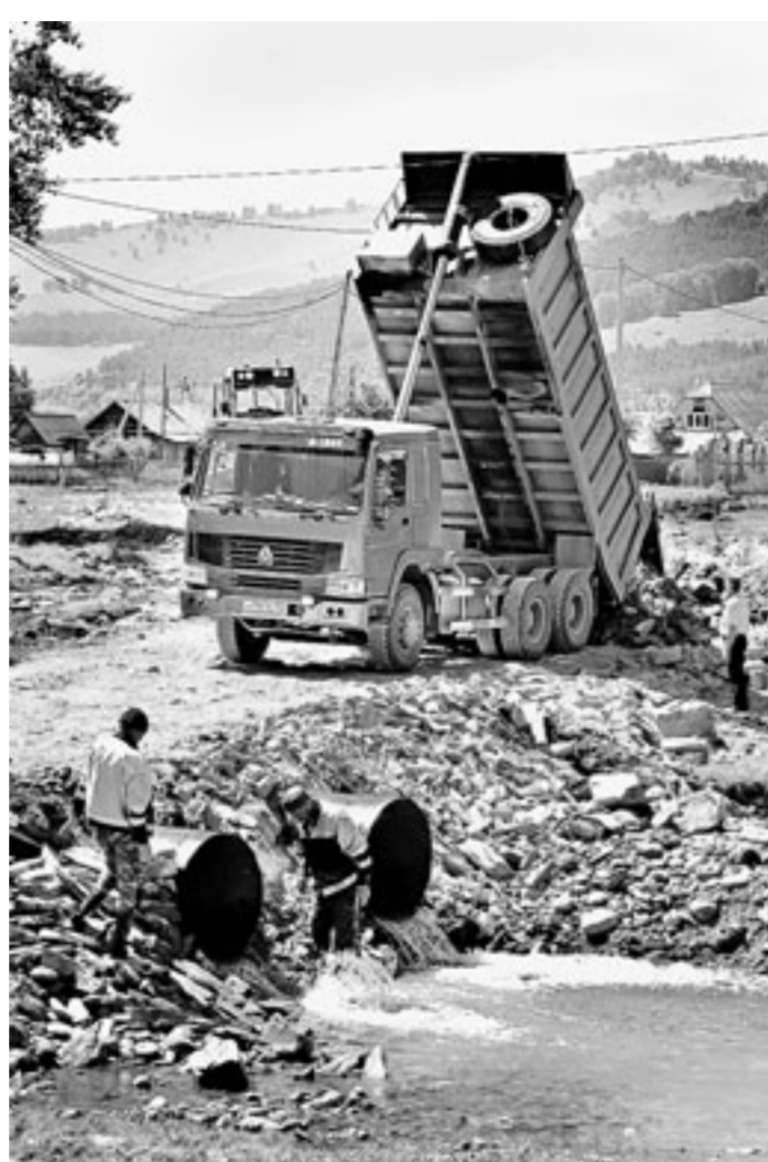
Мосты и дороги – важнейшие строительные объекты в крае.

сравнению с прежним подрос в 28 муниципальных районах и 9 городских округах. Повторимся, конечный результат еще предстоит подсчитать. Однако, как сказал Андрей Геттих, годовой итог