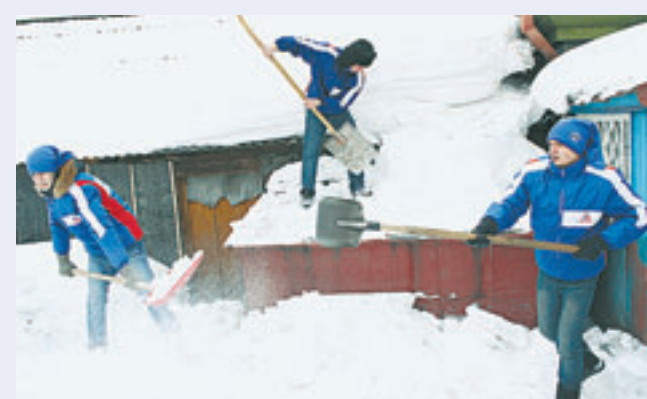
Бойцы «Снежного десанта» каждый год оказывают помощь жителям Алтайского края.

«Десантники» будут проводить профориентационные встречи с учащимися школ и средних специальных учебных заведений, пропагандировать ценности здорового образа жизни, организовывать массовые культурные и спортивные мероприятия. Особой обязанностью каждого бойца «Снежного десанта» является оказание помощи вете-