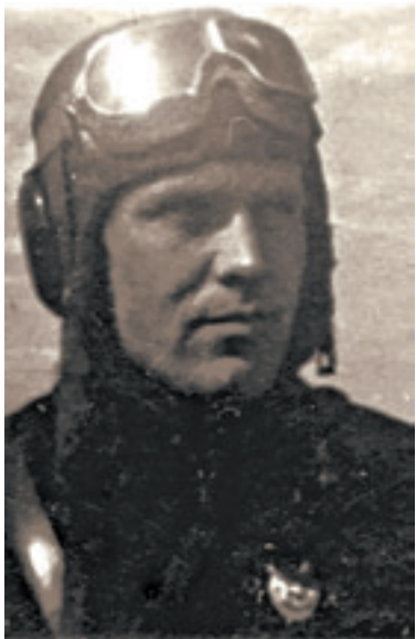
Ириной Беляев, последний лётчик времён Великой Отечественной войны, удостоенный в 1991 году звания Героя Советского Союза.

В конце 1920 годов юный Беляев вместе с семьёй оказался на Алтае. Известно, что он учился в