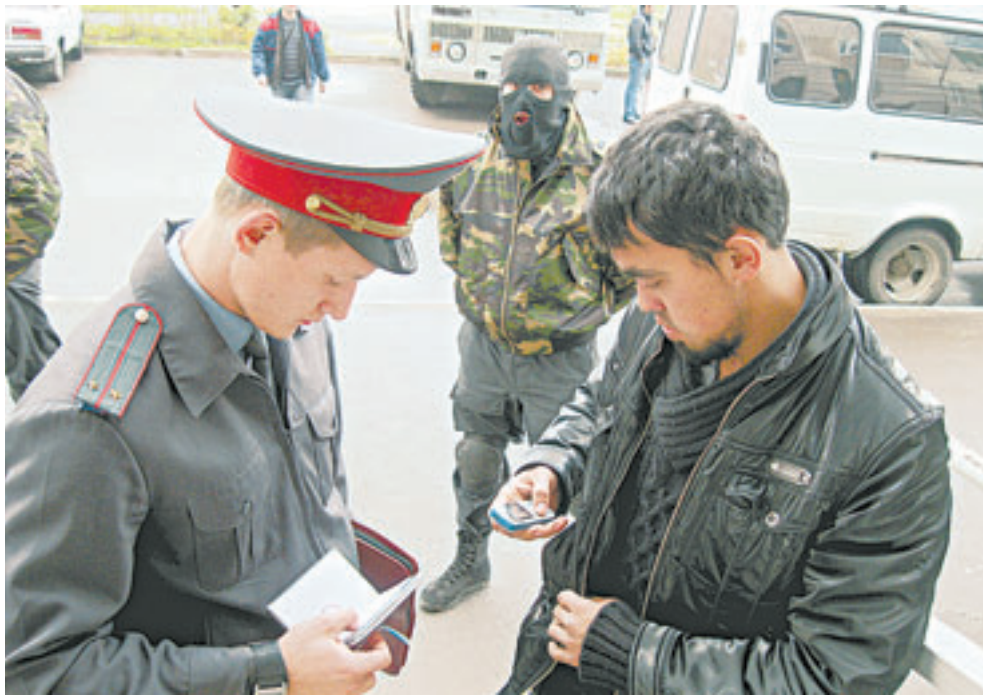
Нарушителям миграционного законодательства теперь придется несладко.

– С одной стороны, закон упрощает иностранцам, прибывающим на территорию Российской Федерации, ведение трудовой