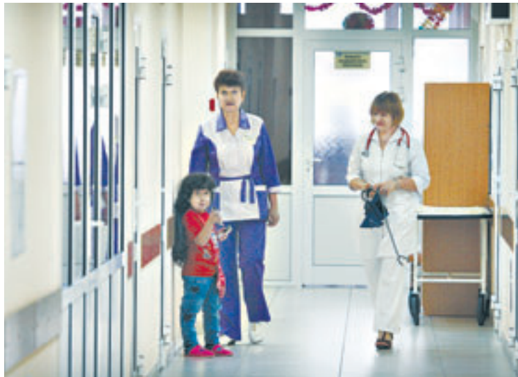
За счет рациональной планировки в отделении улучшены условия и для пациентов, и для персонала.

В краевой клинической детской больнице после капитального ремонта открыто отделение гастроэнтерологии и нефрологии. Теперь дети могут получать медицинскую помощь в новых комфортных условиях.