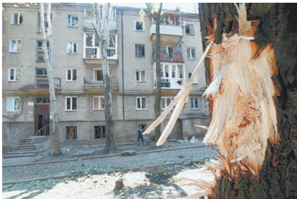
Донецк каждый день обстреливают.