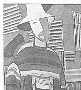
А. Фризен. «Молодой человек в белой шляпе».