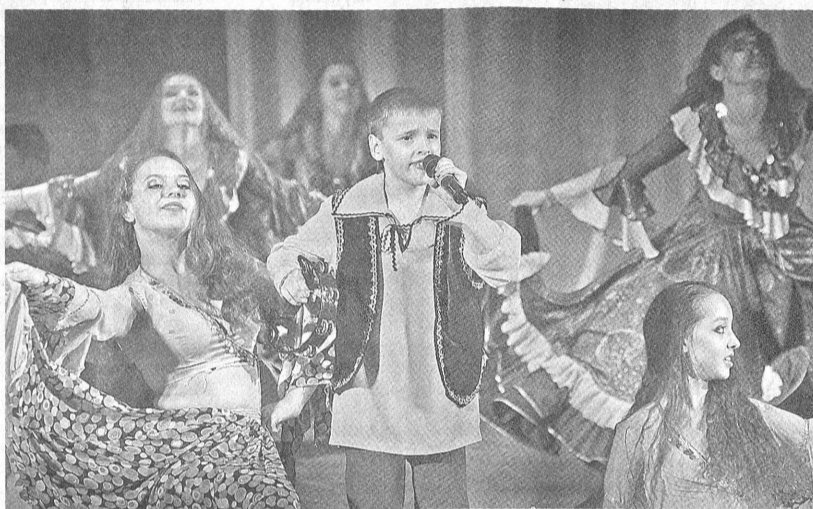
...и на сцене.