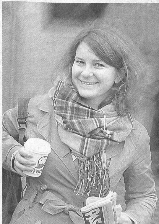
Ярмарка – хорошее подспорье в поиске работы.