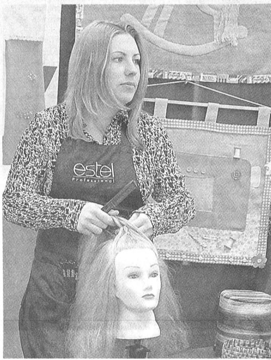
Мастер-класс по парикмахерскому искусству.

Край входит в тройку регионов России, где налажена хорошая работа по трудоу-