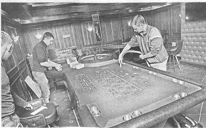
В здании идут последние приготовления к открытию.

Владельцы казино рассчитывают на весьма значительную аудиторию. Сейчас идут переговоры с авиаперевозчиками, которые будут доставлять