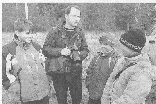
«Караван» из Зудилово друг Природы.