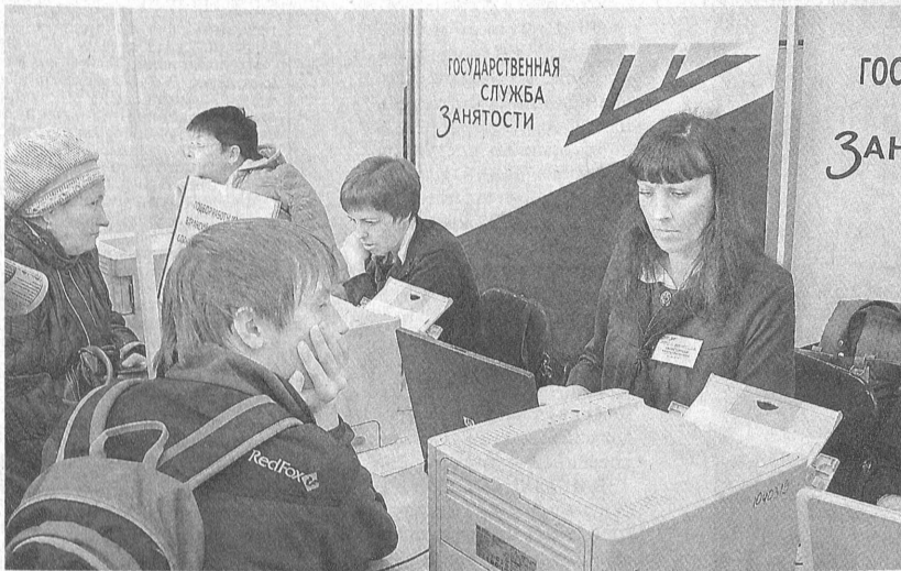
Консультации специалистов помогли определиться с выбором будущей деятельности.

Востребованные на рынке труда специальности – учитель, врач, водитель, механик, токарь, фрезеровщик, повар, швея, продавец, электромонтер и другие. Более 20 работодателей заявили около 900 вакантных рабочих мест с заработной платой 20 тысяч рублей и выше. Максимальное предложение по зарплате – 70 тысяч рублей – на должность старшего дорожного мастера в железнодорожной отрасли. Край входит в тройку регионов России, где налажена хорошая работа по трудоу-