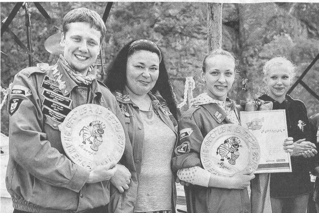
Бойцы студенческих отрядов Алтайского края представляют наш регион на мероприятиях различного уровня...

Публикация «Хоть сегодня в командировку»... приближается круглая дата — студотрядовскому движению на Алтае исполняется 50 лет.