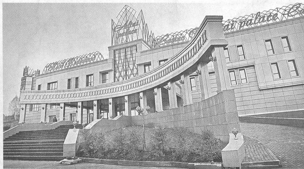
Вот так выглядит первое в Сибири легальное казино.