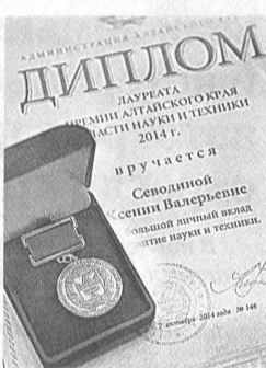
Премия Алтайского края вручалась вместе с дипломом и нагрудным знаком.

верситета, разработавшие оригинальные методики диагностики и лечения бесплодия. В итоге, по словам лауреатов краевой премии, за последние 13 лет у женщин, прежде неспособных воспроизводить потомство, появилось 1100 малышей.