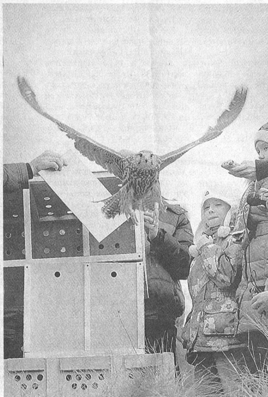
Лети. Путь открыт.

– Как летит! – говорит с радостными интонациями в голосе егеря «Алтайприроды»