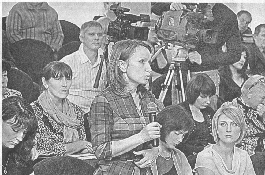
Губернатор края Александр Карлин во время встречи с журналистами многочисленных СМИ ответил на самые главные вопросы развития региона.