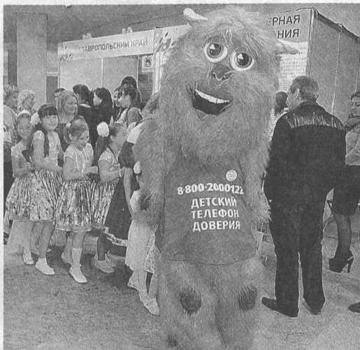
Такого символа детского телефона доверия, нет в Алтайском крае, нигде в России больше нет.

Игра может быть не только развлечением, но и средством реабилитации и воспитания.