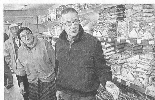
Цены в магазине райпотребкооперации чуть ниже, чем в других.

Самым зримым фактом идущих восстановительных работ в Клепиково является,