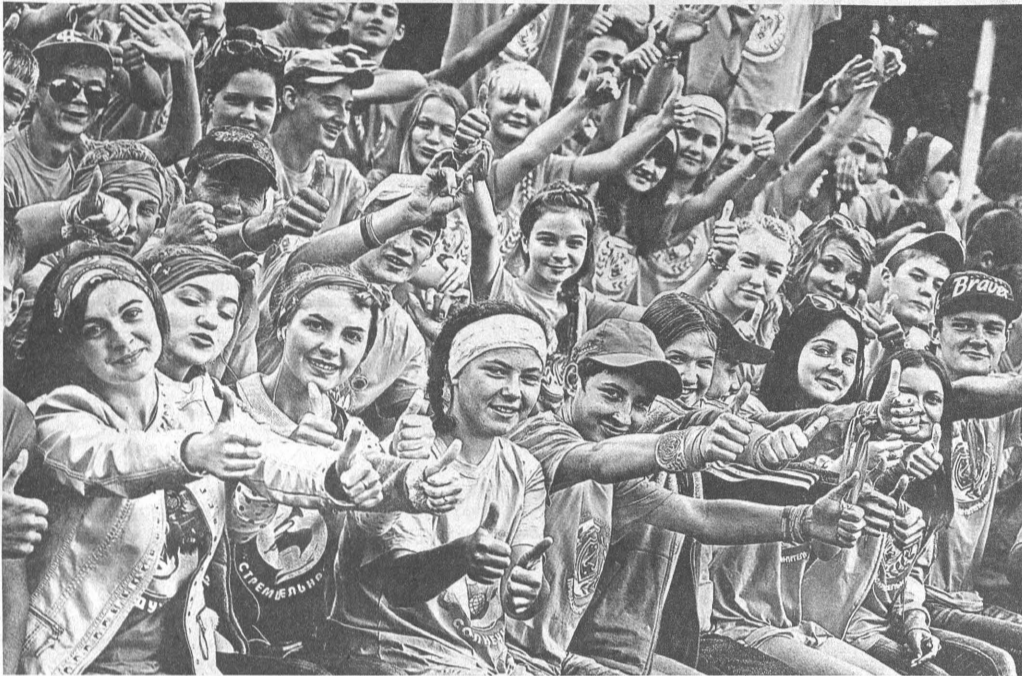
Международная летняя деревня «Алтай» – это здорово!