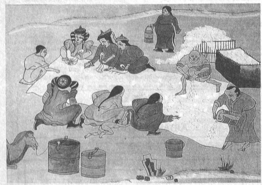
Д. Басандорж. Подготовка войлока. (Монголия).