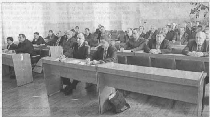
Во время беседы за «круглым столом».

Инициаторами очередного разговора на тему рационального использования леса в Алтайском крае выступили краевые парламентарии.