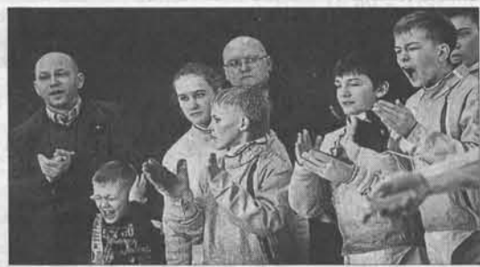
Зрители кричали так, что уши закладывало.