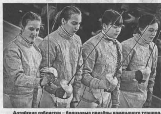
Алтайские сабистки – бронзовые призеры командного турнира.