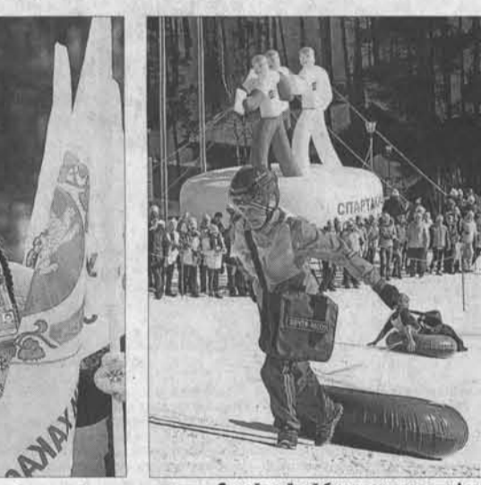
Самой веселой была почтовая эстафета.