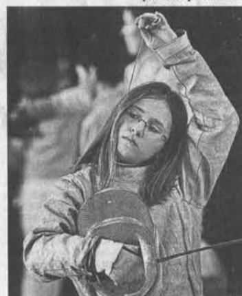
Современный Д'Артаньян в юбке.