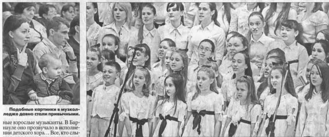
Подобные картины в музколлежде давно стали привычными.