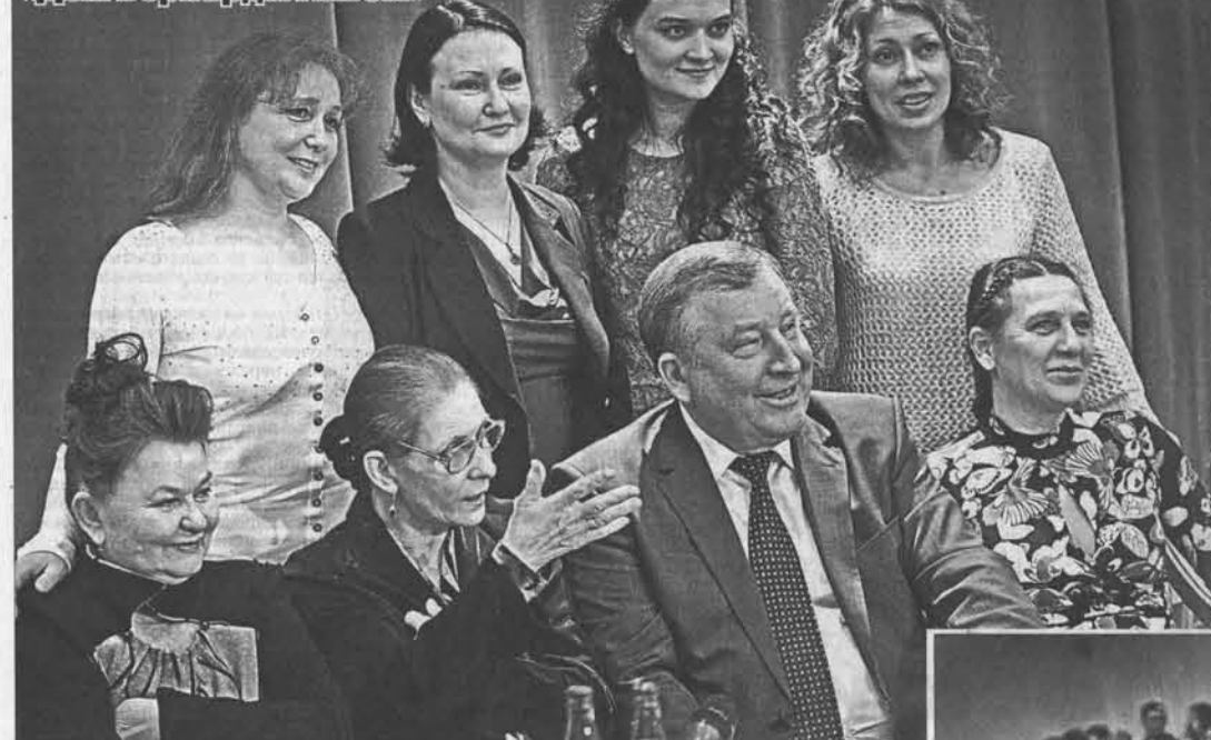
Губернатор Алексей Карлин с актрисами, игравшими в пьесе «Дом Бернарды Альбы».

8 марта Молодежный театр Алтай дал пьесу Фредерика Гавси Лорки «Дом Бернарды Альбы»