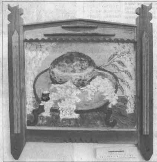
У акварели кисти Троценко люди задумываются о жизни.

ски же только «великий брат» и восстанавливал. Мне пришлось работать «в мире отверженных», прорабом на участке, где строили пленные самураи. Мы разбирали руины, вместо мазанок возводили дома капитальные, устойчивые к землетрясениям, армированные железобетоном. Военные в мажорской вывозили трупы из города, ими все было завалено, на улице Свободы тела погибших штабелями в несколько рядов лежали. Хоронили за городом,