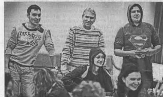
После спектакля «капустник» – мужчинам поздравили прекрасную половину театра.

Выбор драматической пьесы, похоже, угадал многих. Тем не менее он понятен – на сцене в женский день были только женщины. Да и драма повествует об их нелегкой судьбе в селениях Андалусии. Обычно этот спектакль представляется зрителям на камерной сцене театра, однако в этот день он был показан на большой сцене, что было вполне уместно. Это отметил после спектакля на встрече с коллективом театра Александр Карлин.