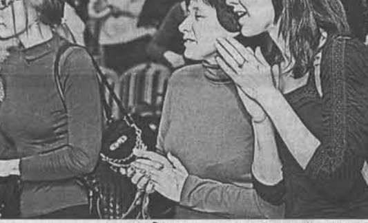
Зрители традиционно аплодировали сго-

Кроме того, актеры МТА обратились к губернатором с просьбой привлечь режиссеров для работы в коллективе. С одной стороны, это позволит привлечь режиссеров для работы в коллективе. С другой стороны, это позволит привлечь режиссеров для работы в коллективе.