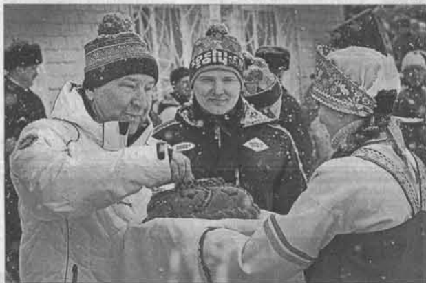
Хлеб-соль для губернатора.

края Александр Карлин, который поздравил всех с праздником, заметив, что спорт в нашем регионе становится неотъемлемой частью жизни большинства городов и сёл. По словам главы региона, чтобы стремление заниматься спортом у мест-