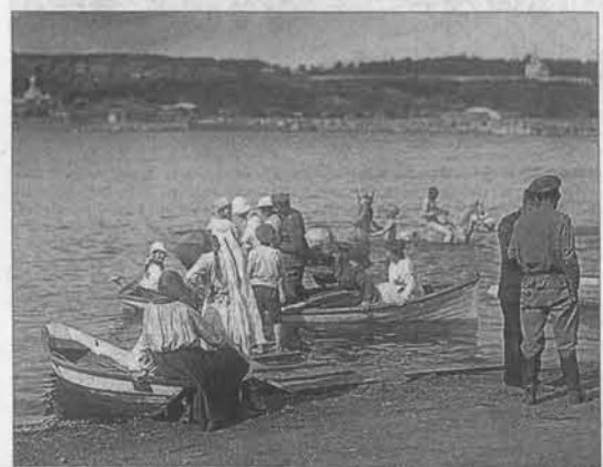
Барнаул в 1919 году.

Французской хронике стало мало, и мы начали работать с киноархивами. Съемку партизан Гражданской войны мы взяли, например, из Госфильмофонда. Для понимания ситуации требовались отсылки к Колчаку, к событиям в Новосибирске, в Омске, – поясняет