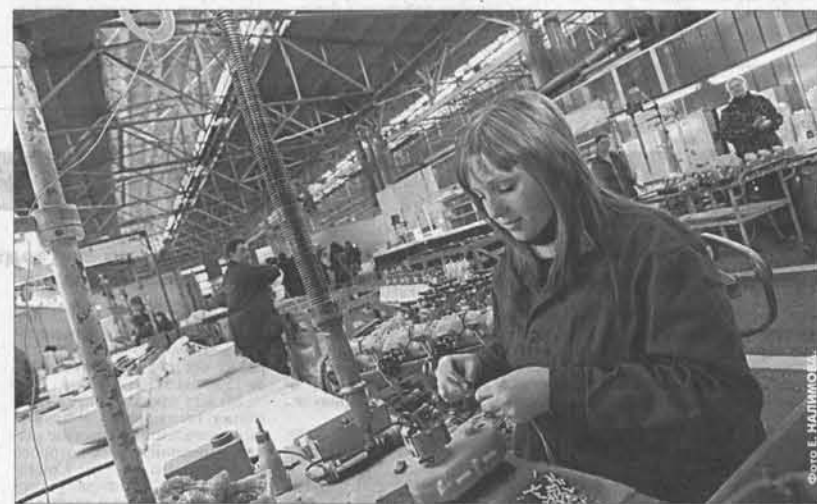
В цехах завода «Ротор».

Предприятие участвует в федеральных целевых программах по техническому перевооружению. В прошлом году получило на эти цели больше 300 млн. руб., в этом году меньше, зато на следующий обещают 400 млн. руб.