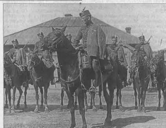
Чешские легионеры на улицах нашего города.