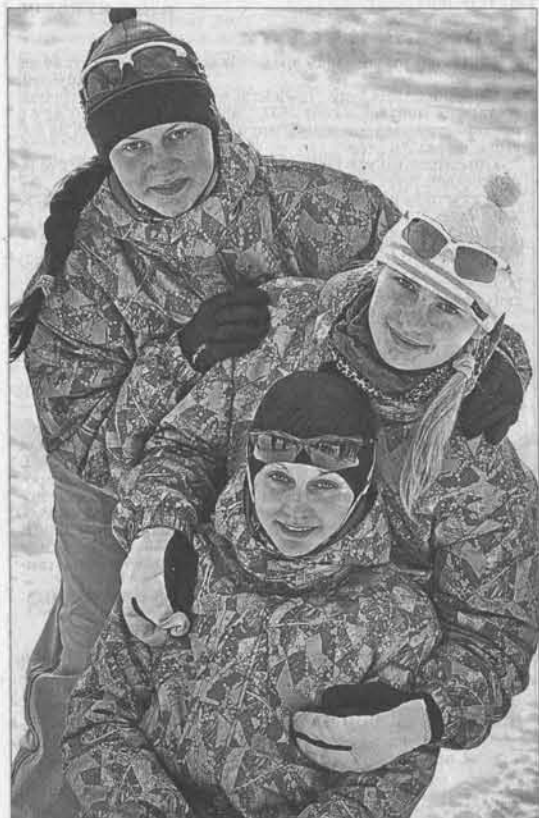
Чемпионы лыжной эстафеты – команда Родинского района.

В Троицком районе завершились самые массовые и популярные в крае спортивные соревнования