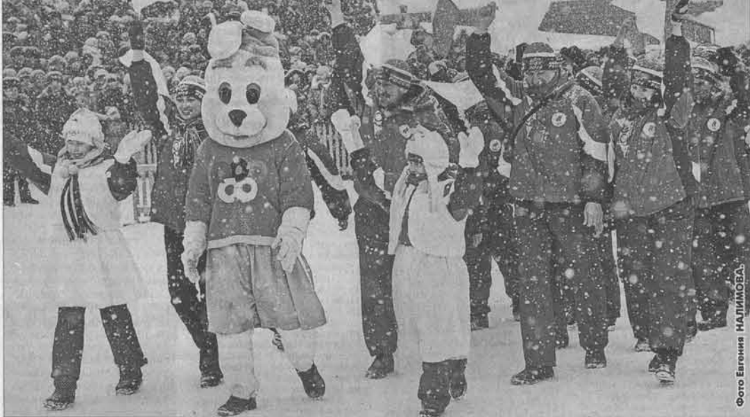
На параде – самая многочисленная делегация из Шипуновского района.

дили олимпиаду уже в третий раз, вновь постарались, чтобы всё в село было пропитано духом главных сельских стартов. Несмотря на обильный снегопад, трибуны стадиона во время открытия олимпиады были заполнены до отказа. Собравшихся поприветствовал губернатор