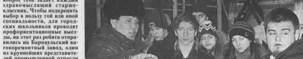
Во время экскурсии.

Куда пойти учиться — этот вопрос себе задаёт каждый здравомыслящий старшеклассник. Чтобы подкрепить выбор в пользу той или иной специальности, для городских школьников проводят профориентационные выезды, на этот раз ребята отправились на Барнаульский вагоноремонтный завод, один из крупнейших предприятий промышленной отрасли за Уралом.