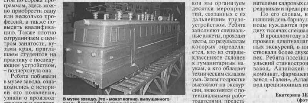
В музее завода. Это — макет вагона, выпущенного в годы Великой Отечественной войны.