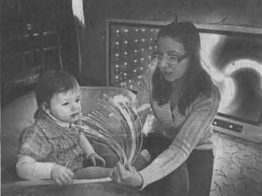
Темная сенсорная комната нравится всем — и детям, и взрослым.

пать ее. Есть также зона развития речи. Для детей, посещающих центр, это своеобразная школа. Каждый урок здесь начинается с приветствия — все собирается в круг и под музыку проводят пальчиковые игры или творческое занятие. А потом дети самостоятельно выбирают, в какой зоне будут играть. Задача