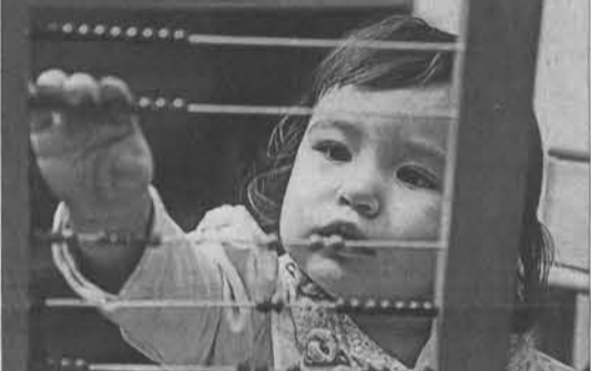
Синтоном — сколько нужно бусинок?