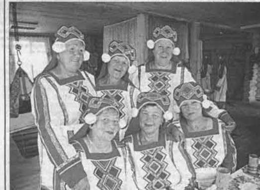
Выступают борисовские бабушки из ансамбля «Уморин».

В Залесово на этой неделе прошел праздник мордовского пирога «Паг пряка» с грибной начинкой.