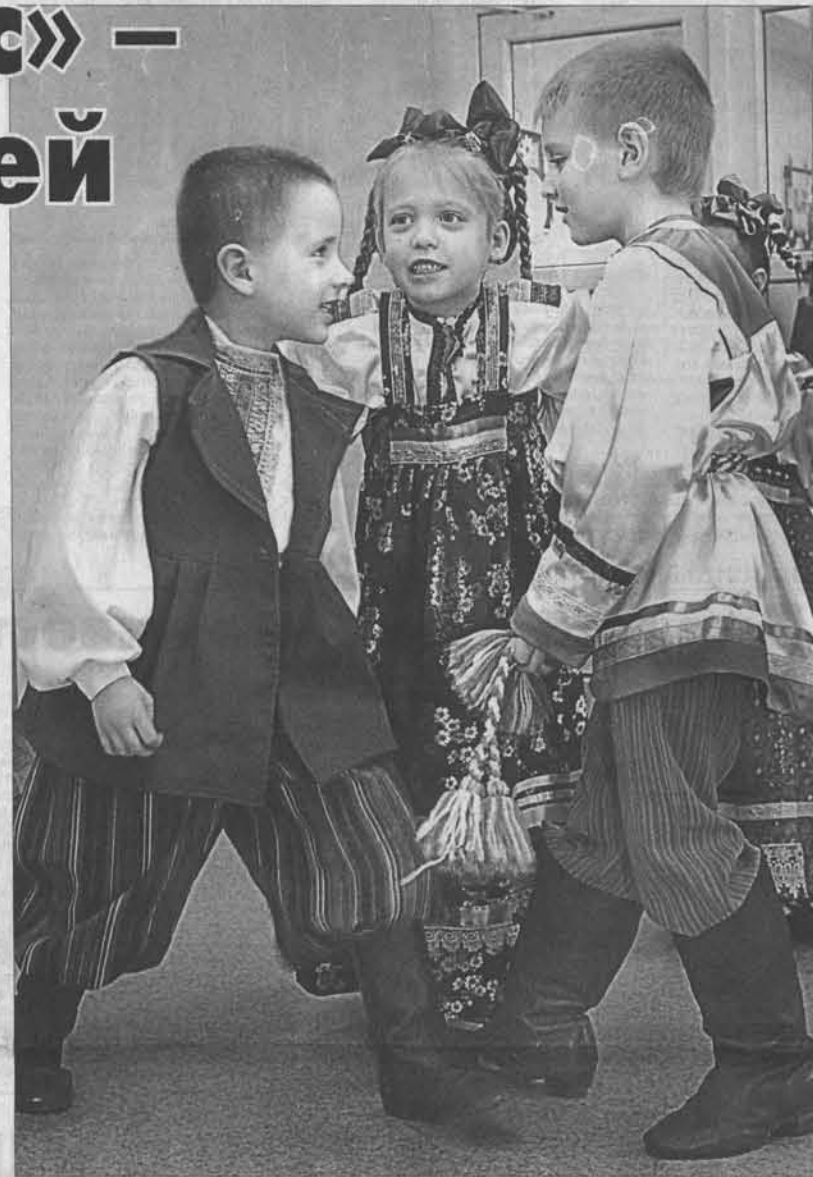
«Не лгушиться, оба радитесь»

школьных учреждений в крае обеспечивается через субсидии. Кстати, средний размер ее в учреждениях дошкольного образования в 2013 году составил 13 128 рублей. На совещании обсуждались и другие вопросы: качество питания, работа электронной очереди, родительская плата, которая в нашем регионе по-прежнему остается одной из самых низких в стране. Подводя итоги совещания, Александр Карлин предложил, что в детских садах необходимо создавать родительские советы, которые будут аналогом попечительских советов в школе. Они помогут администрации детских садов решить эти и другие не менее важные проблемы. Анна БОДАГОВА, Сергей БАШЛЫЧЕВ (фото).