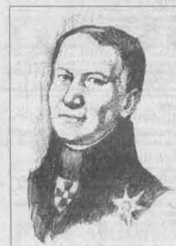
Академик Эрик (Кирилл) Лаксман.

И всё же в судьбе Лаксмана было много лишений. Из-за мелких придиорок президента академии Сергея Домашнева его лишили академического звания. А к тому времени у него было уже восемь детей: двое мальчиков от первой жены и шесть – от второй.