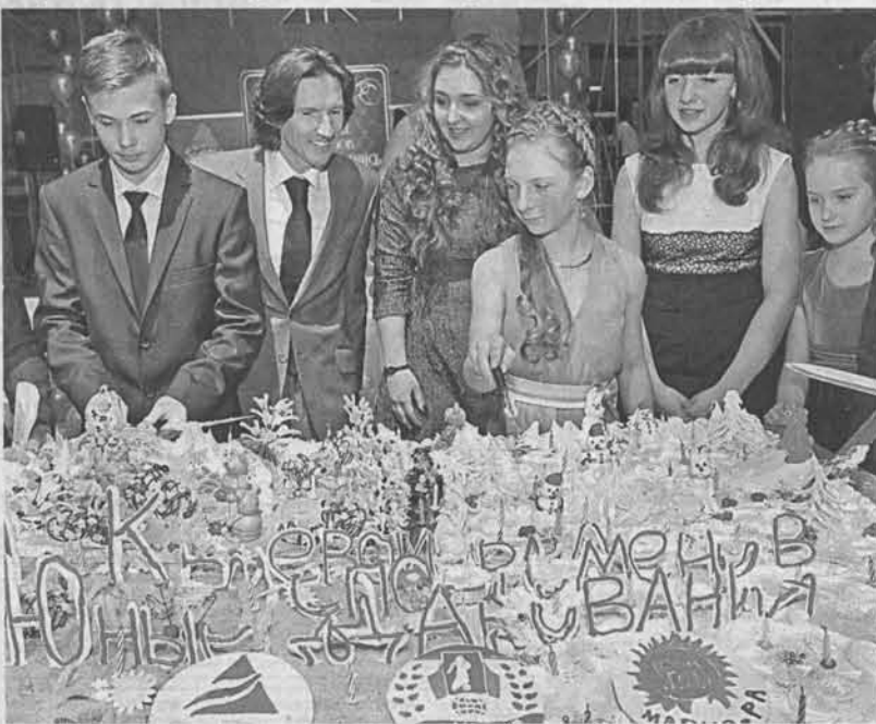
Такая красота тала во рту.

Я с удовольствием отмечаю, что за последние годы мы смогли построить в крае не только десятки новых, но и реконструировать некоторые старые спортивные объекты. К имеющимся 86 открыли ещё 18