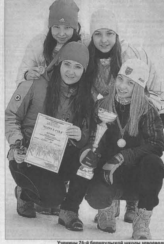
Ученицы 76-й барнаульской школы завоевали кубок в четвертый раз подряд.

8 февраля состоялся один из старейших в сибирском регионе лыжных стартов – эстафеты на призы газеты «Алтайская правда». В 70-й раз борьбу за кубки и медали «АП» вели спортсмены самых разных возрастов от школьников до ветеранов спорта. На стартую полную лыжную базу «Стройгаз» вышли 240 команд (около тысячи участников) из городов и районов края и Республики Алтай. Победителями в мужской и женской эстафетах стали студенты Алтайской педагогической академии. Причём «академики» взяли реванш у предста-