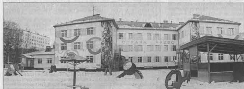
Яркий и необычный фасад детского сада привлекает внимание.

Табличка у входа в новенькое трехэтажное здание, расписанное яркими красками, гласит: «МАДОУ детский сад № 265 «Страна чудес». Входящий и выходящий не ошиблись с названием. Большие, светлые группы и коридоры, просторный спортивный и уютный актовый залы, приветливые улыбки воспитателей и других сотрудников детского сада – все это создает особую атмосферу, необходимую для хорошего настроения, а соответственно, правильного развития малышей. На церемонии открытия присутствовали губернатор края Александр Карлин, глава администрации Барнаула Игорь Савиных, гости и приглашенные.