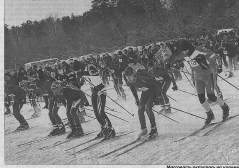
Массовость оказалась на уровне.

8 февраля состоялся один из старейших в сибирском регионе лыжных стартов – эстафеты на призы газеты «Алтайская правда». В 70-й раз борьбу за кубки и медали «АП» вели спортсмены самых разных возрастов от школьников до ветеранов спорта. На стартую полную лыжную базу «Стройгаз» вышли 240 команд (около тысячи участников) из городов и районов края и Республики Алтай. Победителями в мужской и женской эстафетах стали студенты Алтайской педагогической академии. Причём «академики» взяли реванш у предста-