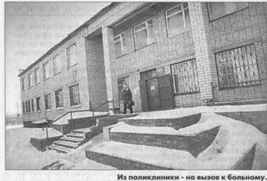
Из поликлиники – на вызов к больному.