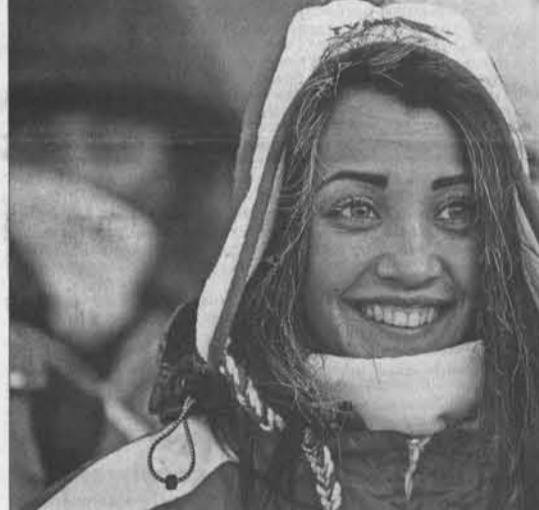
Самые красивые девушки – в «Снежном десанте».