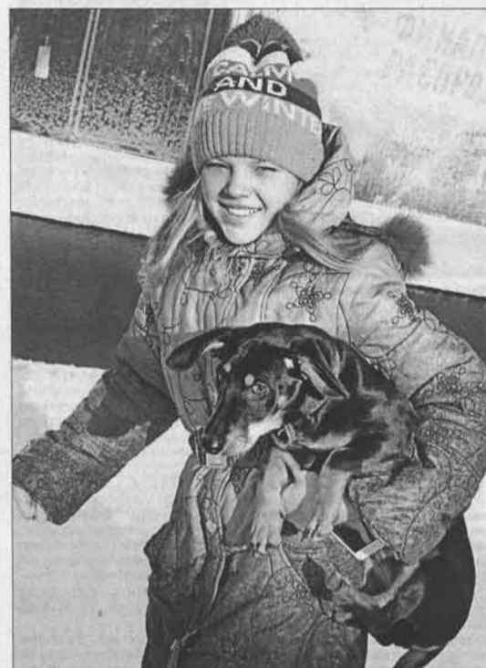
На выставку — за призами!

Зрительские аплодисменты не прекращались. Участники по очереди поднимались на сцену и демонстрировали своих подопечных.