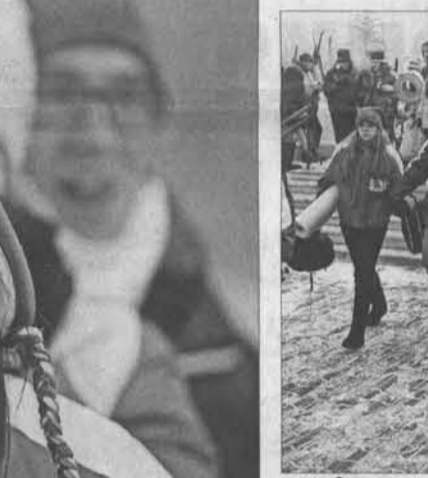
Сумок на площади Победы было больше, чем самих бойцов.