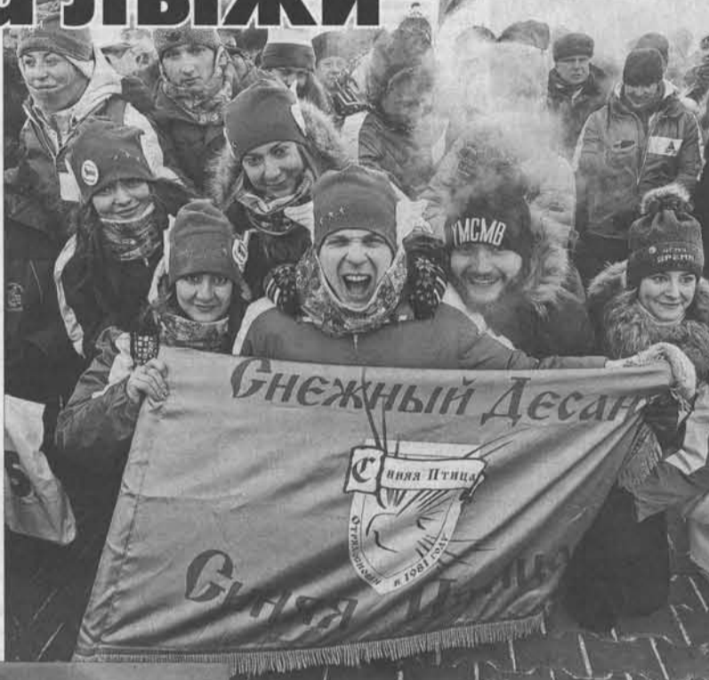
Отряд «Синяя птица»: «Мы мороза не боимся!»