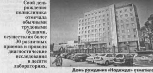
День рождения «Надежда» отметили обычными трудовыми буднями.

Поликлинике краевого онкологического центра «Надежда» 28 января исполнилось четыре года. За это время здесь принято около полутора миллиона пациентов