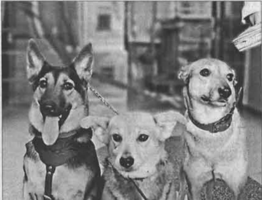
Умные и красивые.

По традиции на выставке были представлены три ринга: «Мини» (маленькие собаки), «Золотая середина» (собаки в холке около 30-45 сантиметров) и «Богатырь» (крупные псы).