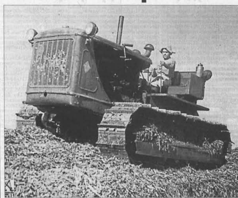
В 1955 году Алтайский край стал одним из крупнейших поставщиков пшеницы.

Годы освоения целины стали для Алтайского края одной из главных вех в его истории. После столыпинских реформ целина стала вторым масштабным событием, или, как теперь говорят, проектом, определившим статус Алтая как одной из ведущих житниц страны. Сложность задачи определяла не только грандиозность масштаба, но и новизна этого большого дела, ведь в мировой практике не было опыта освоения огромных массивов целинных земель за такой короткий период времени.