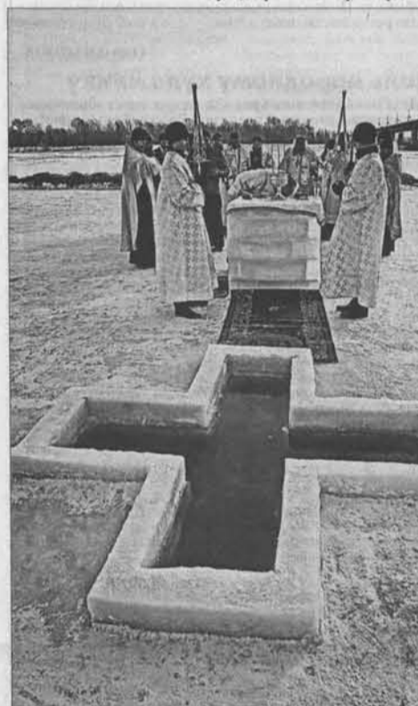
Через несколько минут мордны обступят люди. Но не все рискнут взять воду из Оби, многие горожане поедут в храмы.

Как правило, в Крещение на Алтае всегда сильные морозы: до -30 градусов. Но в этом году природа сделала православным подарок – столбик термометра остановился на -4 (по данным синоптиков, такого не было последние 20 лет). День был ясным и солнечным, на голубом небосводе маковки церкви горели золотым огнем. Под звон колоколов у Никольского храма начался крестный ход. Сотни человек (священнослужители, церковники, прихожане) с иконами на руках прошли по проспекту Ленина до речного вокзала. Специально к празднику на берегу Оби возвели снежную часовню. А на льду оборудовали прорубь для купания и мордны (небольшое «окошко» в форме креста, из которого можно черпать воду).