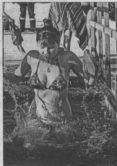
Красная девица прорубь не боится.

вый раз в жизни в проруби, уговорил муж, он уже три года как в Крещение окунается и ни разу не заболел.