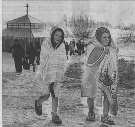
К купели Иоанно-Кронштадтского женского монастыря ехали люди из многих районов края.

– Сначала страшно, потом холодно, а потом приятно тепло – словно душа смеется. Пер-