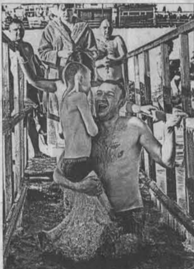
С папой не холодно.