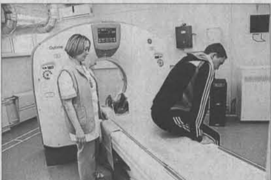
Томограф помог выявить у пациента скрытую патологию, которую на обычных рентгенограммах не видно.

Такие возможности для диагностики заболеваний пациентов появились в центральной городской больнице Бийска после введения в эксплуатацию рентгеновского компьютерного томографа.