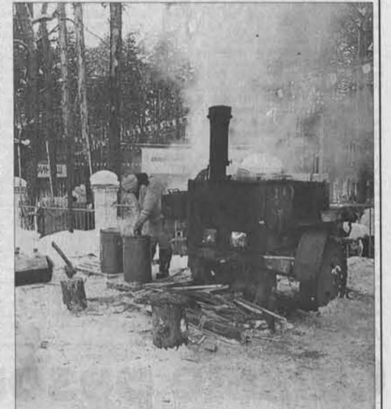
Топится печька, кипит чай.