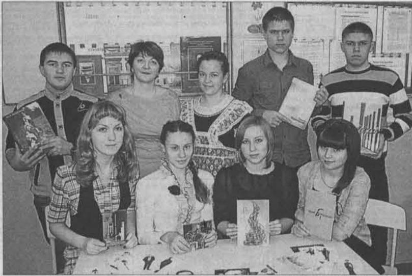
Участники бахрушинского кружка.

Домой я улетала, увозя с собой книги, буклеты, наборы открыток. Среди подарков были