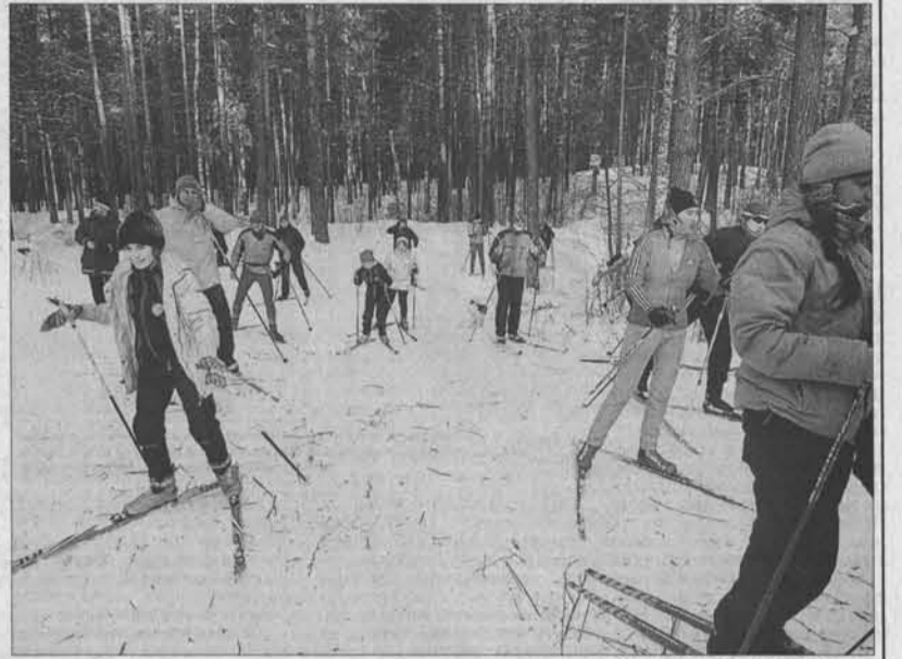
На пятикилометровом рубеже.

Компания регулярно устраивает для людей забывающихся лыжные праздники. С музыкой, концертной программой, подарками и бесплатными угощениями. И я не могла удержаться после 10-километровой пробежки от пары стаканчиков чудесного чая, причем с какой-то вкуснейшей ягодной заваркой. Смо-