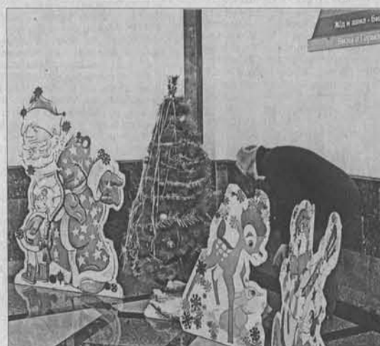
Та самая ёлка, под которой полицейские нашли мужик взрывного устройства.

последовало. «Отличились» не только пассажиры, но и работники вокзала. Дежурная достала радиотелефон и начала кому-то звонить. Она стояла в нескольких метрах от «взрывчатки» — оказались бомба в настольной, то слетонировала бы и взорвалась.