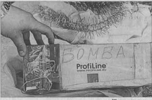
Шутки в сторону...

том его обнаружил сотрудник патрульно-постовой службы. В тот раз, чтобы подогреть ситуацию, мы попросили милиционера повременить с рассказами свидетелей и очевидцев, а сами несколько раз по громкоговорящей связи на весь вокзал «протрубили» информацию: «Во избежание террористических актов необходимо сообщать о бесхозных вещах, находящихся в здании вокзала». Никакой реакции не