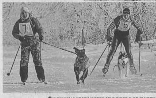
Синеглазые хаски мчались гонщиков и на лыжах...