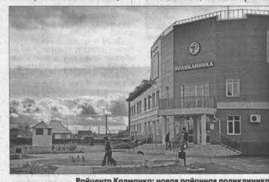
Райцентр Калманка: новая районная поликлиника.