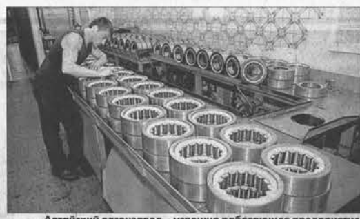
Алтайский вагонозавод - успешно работающее предприятие.