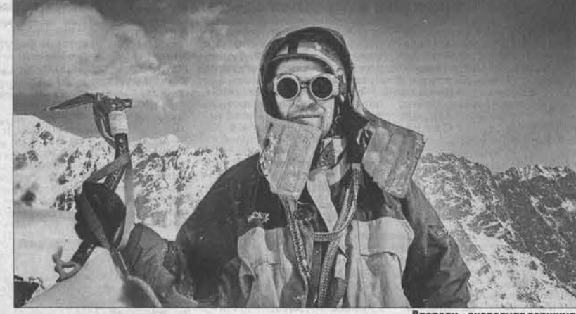
Впереди — очередная вершина.