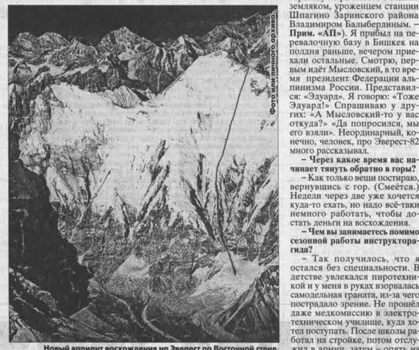
Новый вариант восхождения на Эверест по Восточной стене.

В чемпионате России трижды выступал в составе казанской команды. К стати, в 2005 году на пике Победы был в одной команде с Эдуардом Мысловским — первым советским восходящим фаланги отрезали.