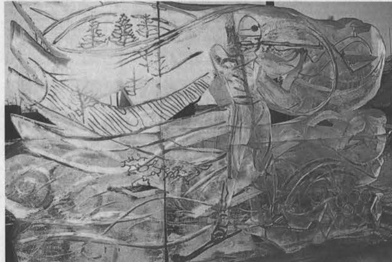
В этом году мало не только снега, но и льда. На реке он совсем тонкий (по сибирскому меркам) — меньше 20 см. Поэтому решено делать не ледяные фигуры, а особые панно. Тематика, как вы догадались, олимпийская.