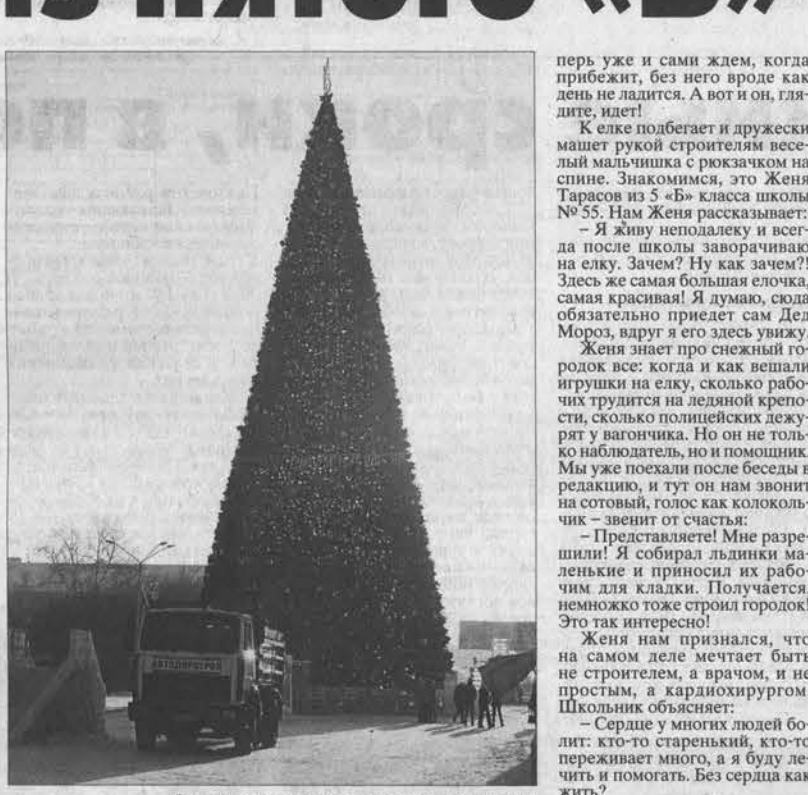
Елка уже установлена, а городок еще строится.