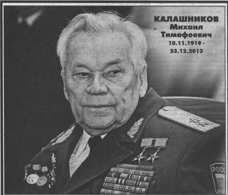
КАЛАШНИКОВ Михаил Тимофеевич 10.11.1919 - 23.12.2013