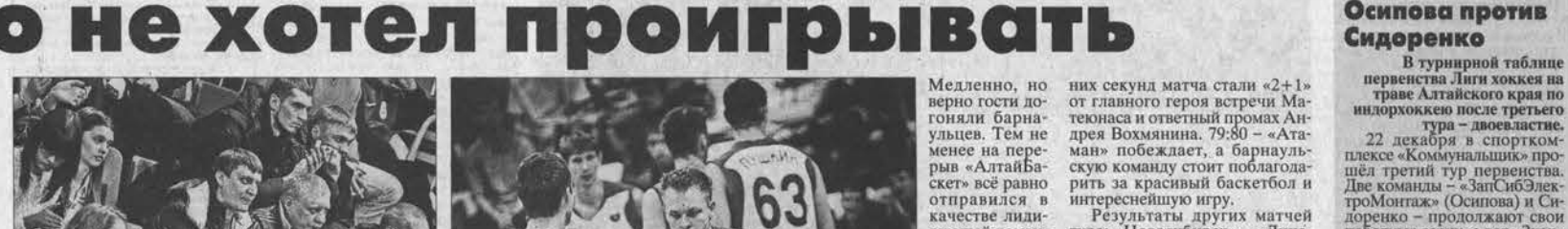
Большевики поддерживали, как могли...