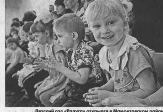
Детский сад «Радуга» открылся в Мамонтовском районе.