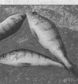
Окунишки на Песчаном жадные.