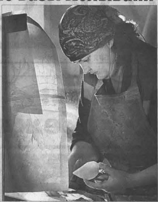
Шлифовка камня — работа тонкая и кропотливая.

Но завод (уже который раз в истории) не умер, как мно-