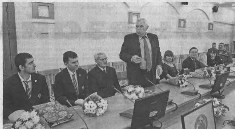
Всего губернатор вручил денежные сертификаты 17 спортсменам и тренерам.

Губернатор края Александр Карлин, поздравляя победителей, отметил, что спортсмены, защищающие честь России и региона, служат для подрастающего поколения образцом, лучшим примером людей с правильной жизненной позицией. И тем более это верно в отношении инваспортсменов.