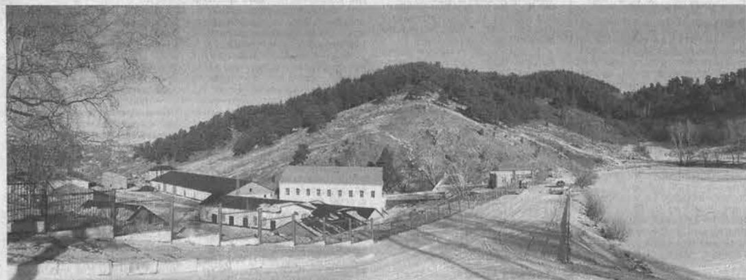
Колыванский камнерезный завод стоит в красивом месте.

Впрочем, не только Государственный художественный музей получит уникальные экспонаты, выполненные колыванскими мастерами. Каждый объект губернаторской программы «80x80» будет украшен издели-