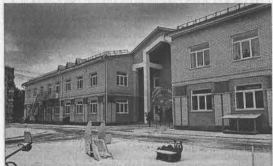
Детский сад рассчитан на 225 мест.

В него пошли сразу 225 детей. Благодаря дошкольному образовательному учреждению в городском округе удалось полностью решить проблему с местами в детские сады. Все маленькие жители Сибирского в возрасте от двух до семи лет обеспечены дошкольным образованием.